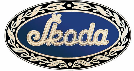
ЛОГОТИП ŠKODA (1926 – 1933)