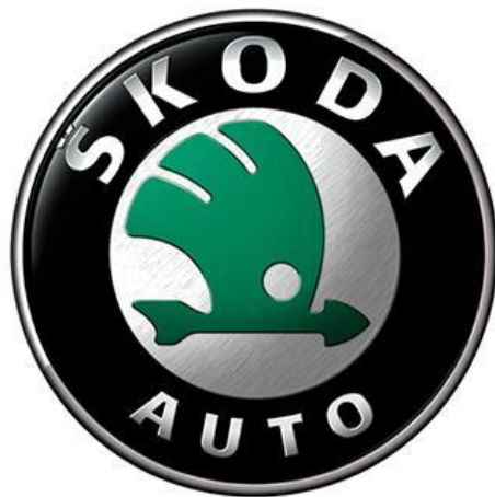
ЛОГОТИП ŠKODA (1999 - 2011)