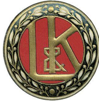
ЛОГОТИП L&K (1905 – 1925)