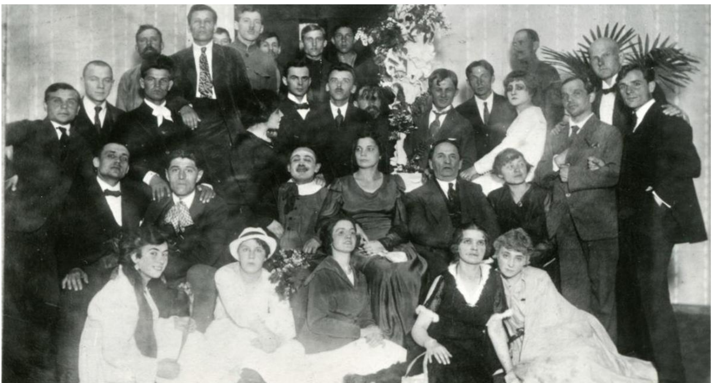
Колектив Молодого театру. Закриття першого сезону 1918 р.