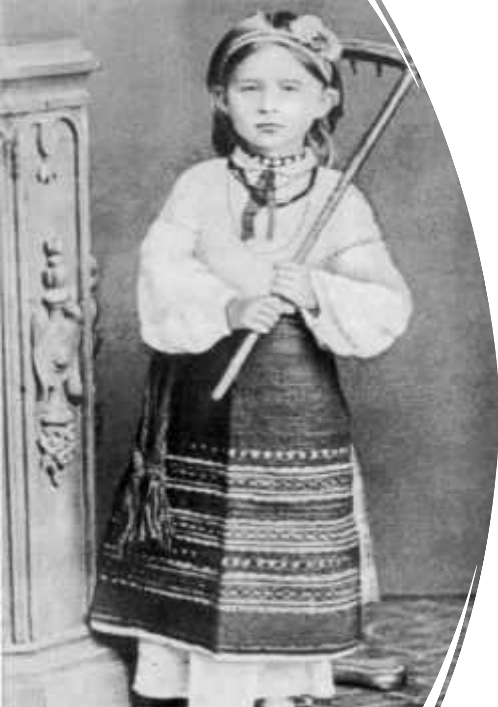
Леся Українка у волинському народному вбранні. 1878–1879 роки