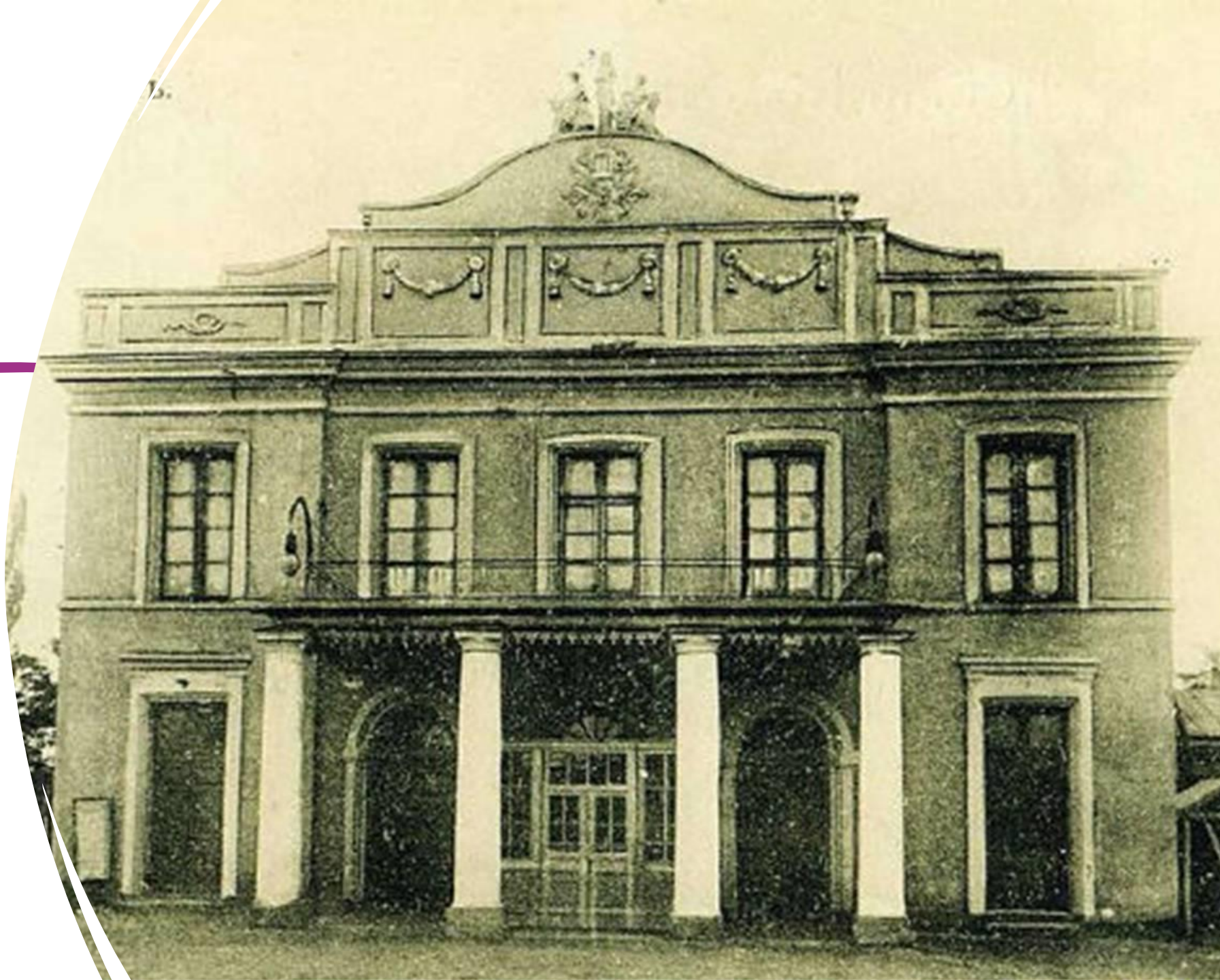
Фото будівлі Театру корифеїв 1882р.