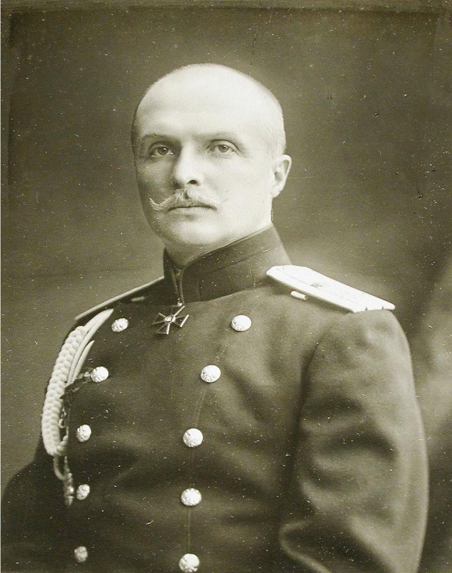
П. Скоропадський із орденом святої Анни на шії