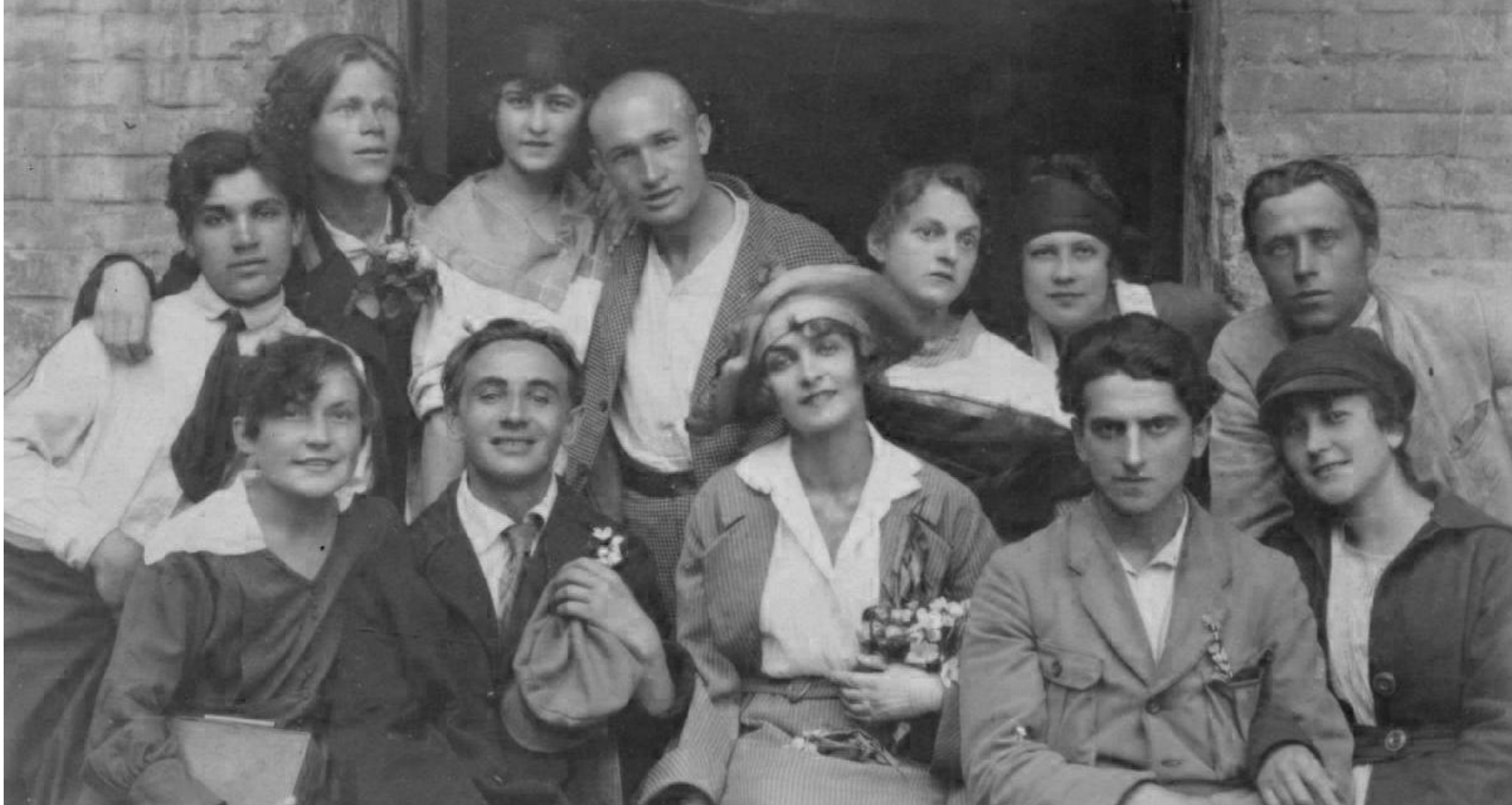
Л. Курбас та актори театру "Березіль" 1925 р.