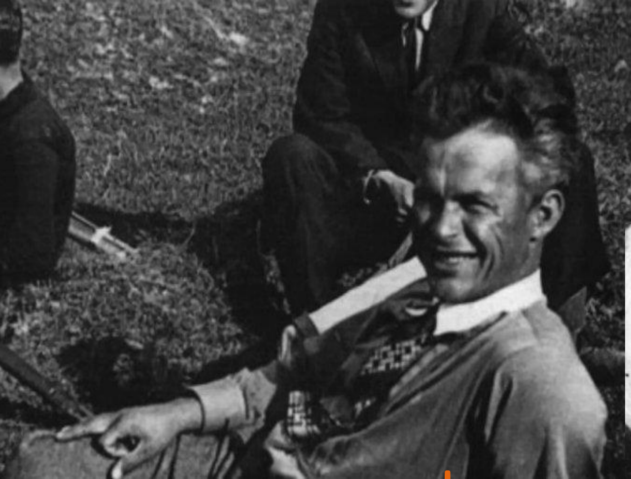
О.Довженко на знімальних майданчиках.