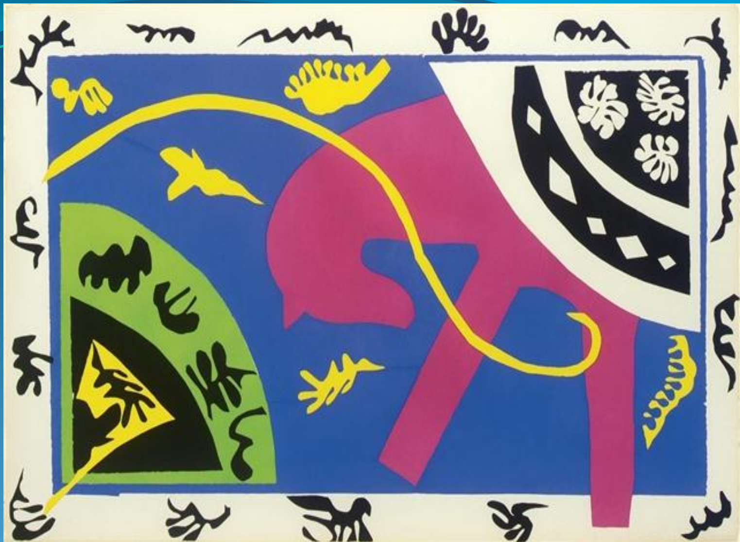
Джас, лошадь, наездница, клоун - 1947