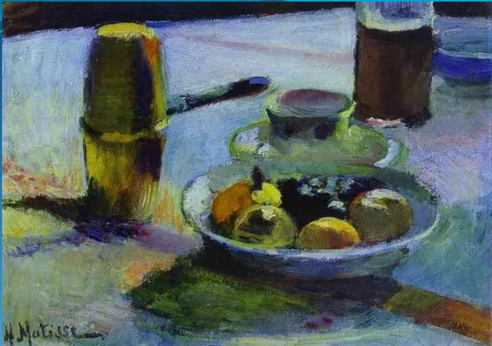
Фрукты и кофейник - 1899