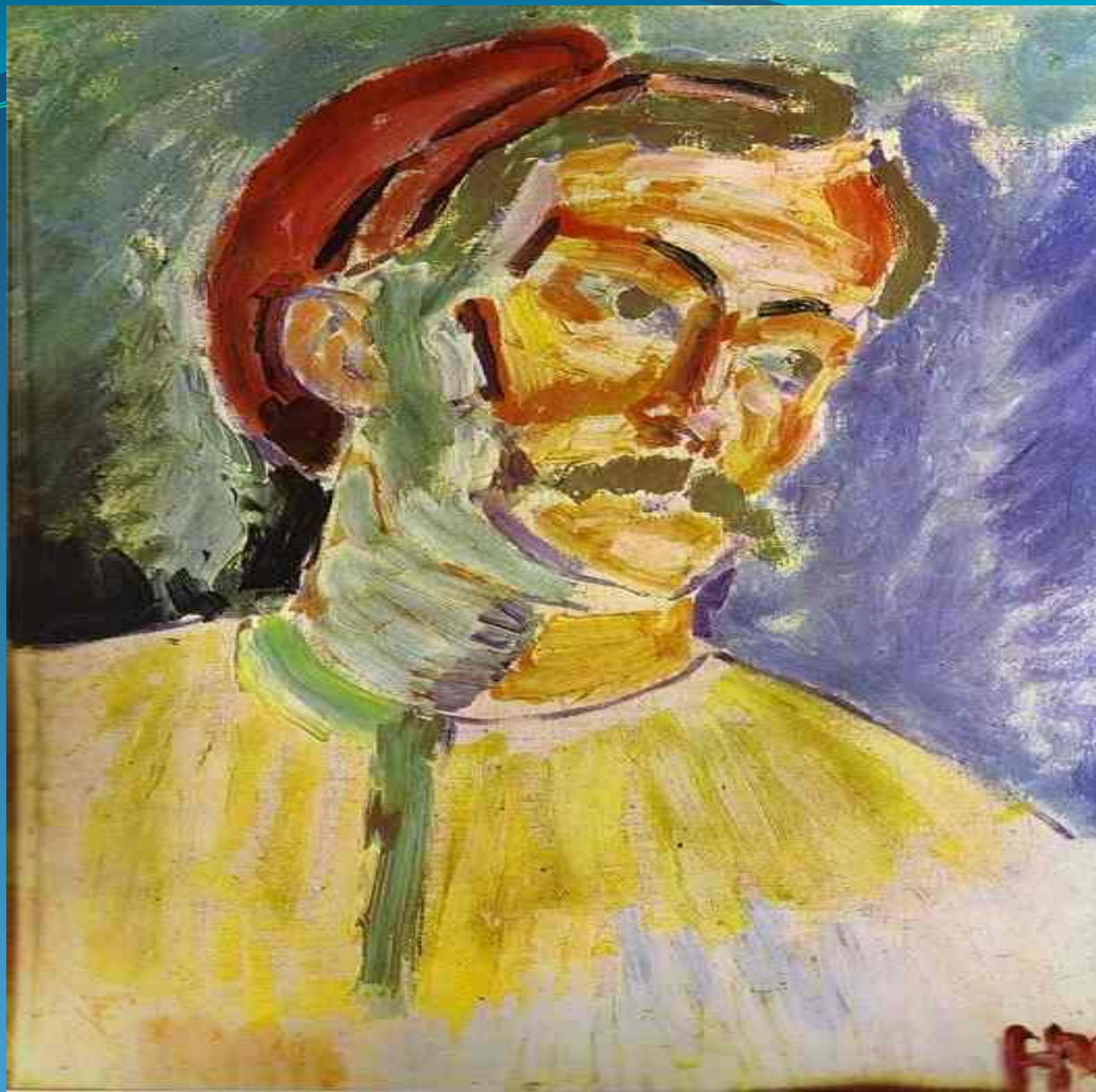
Портрет Андре Дерена - 1905