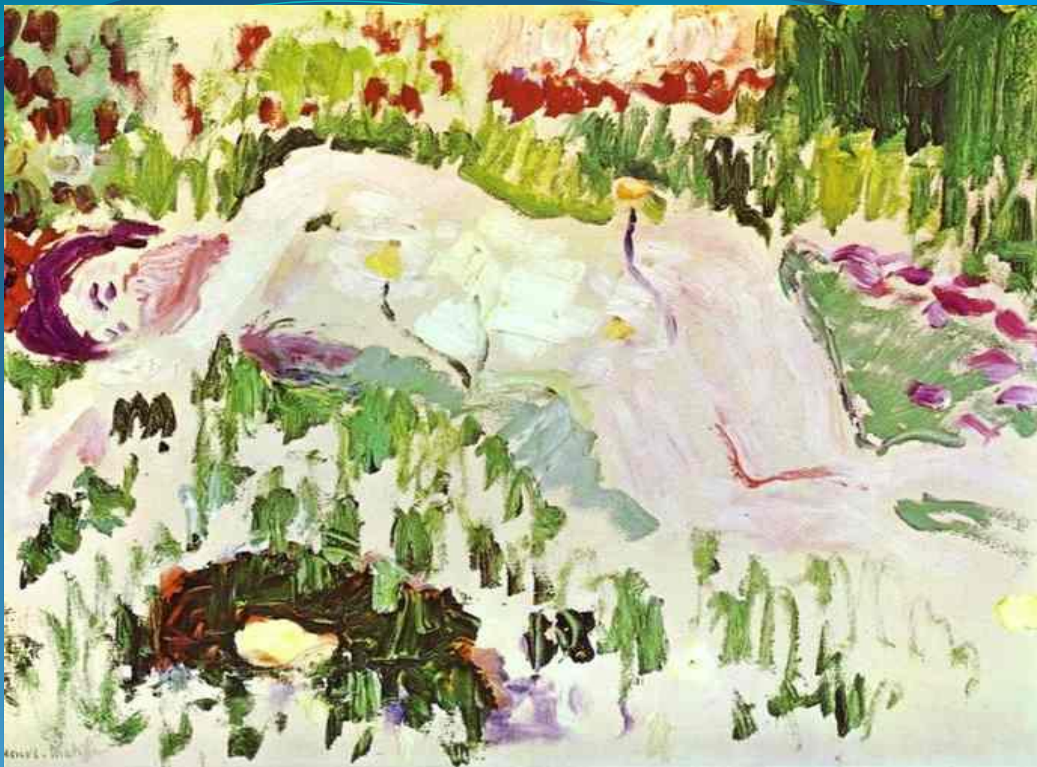
Лежащая обнажённая - 1906