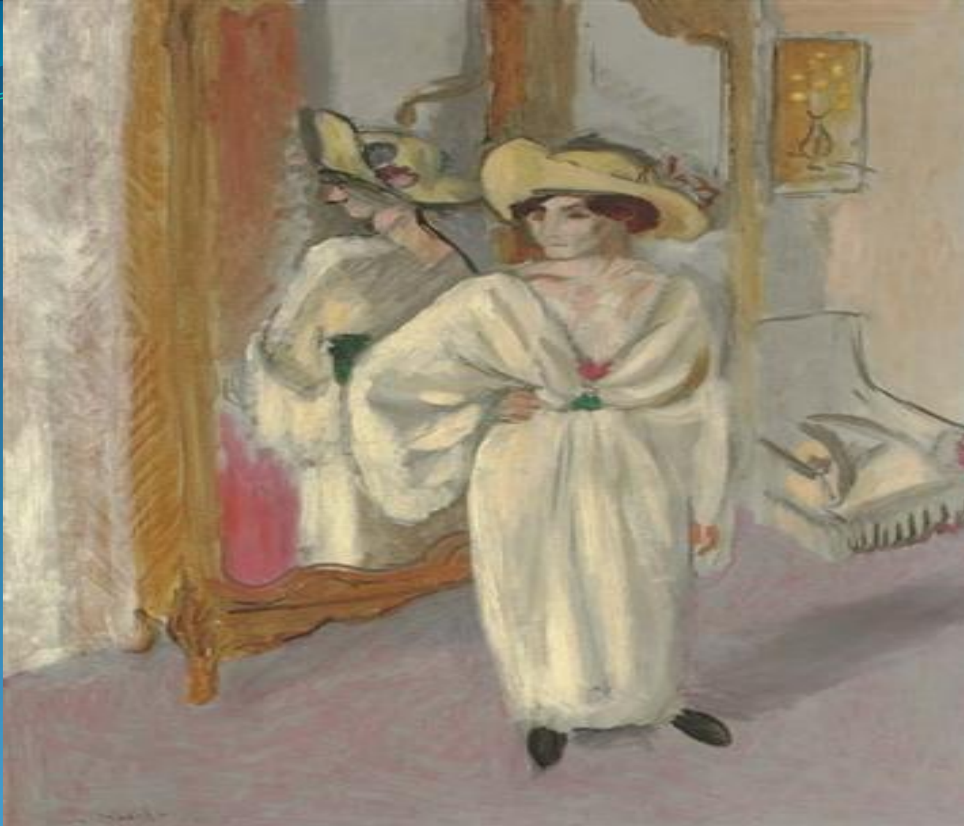
Женщина в белом, стоящая у зеркала – 1918-1919.