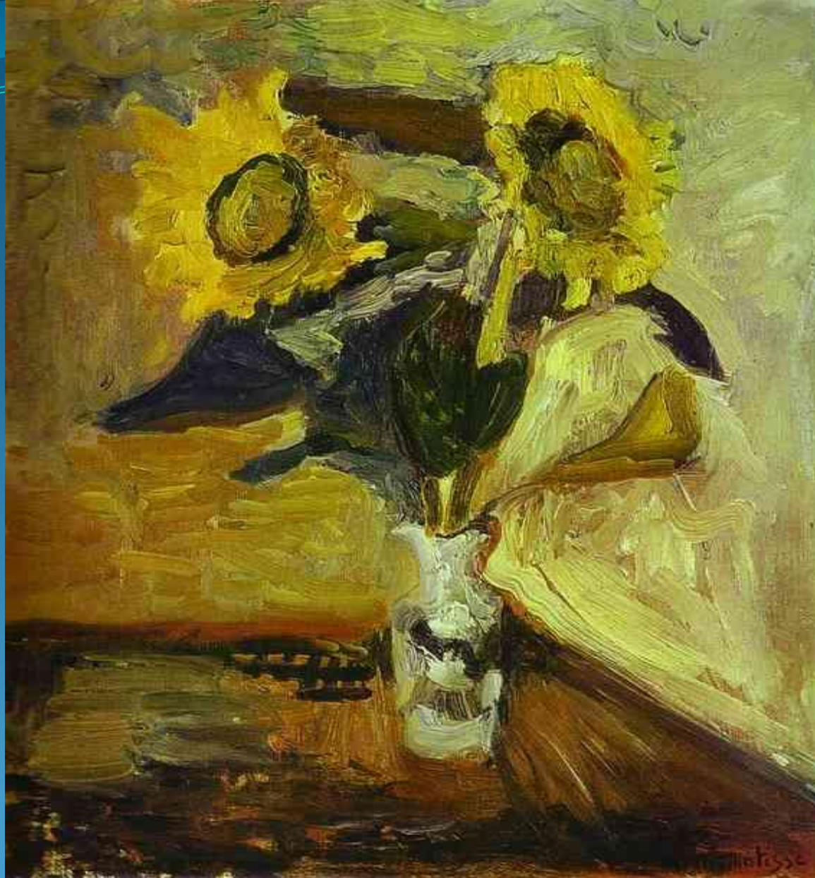
Ваза с подсолнухами - 1898