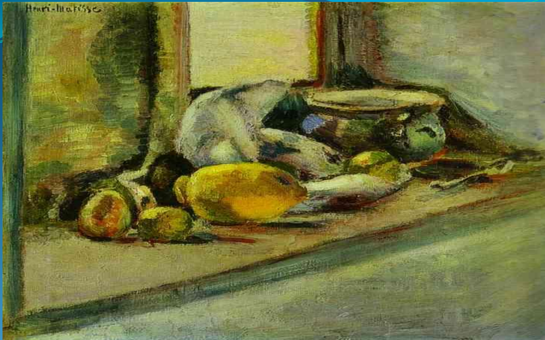
Голубой горшок и лимон-1897