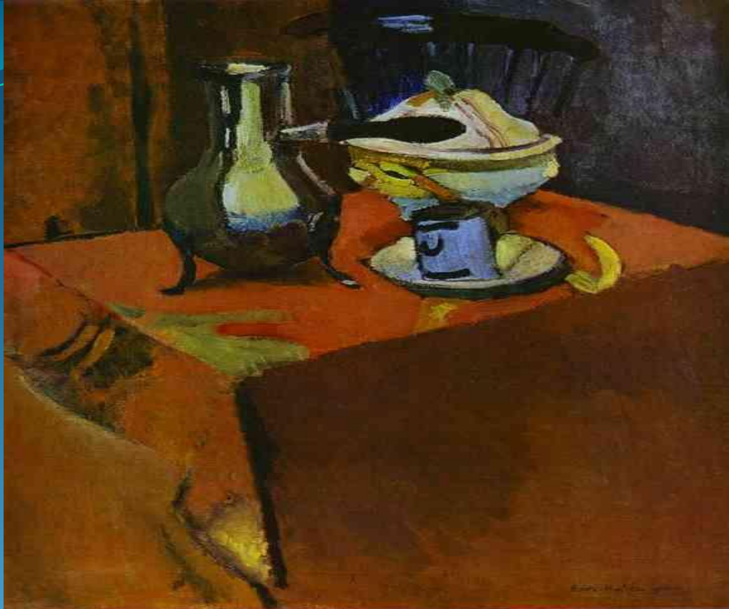
Посуда на столе - 1900