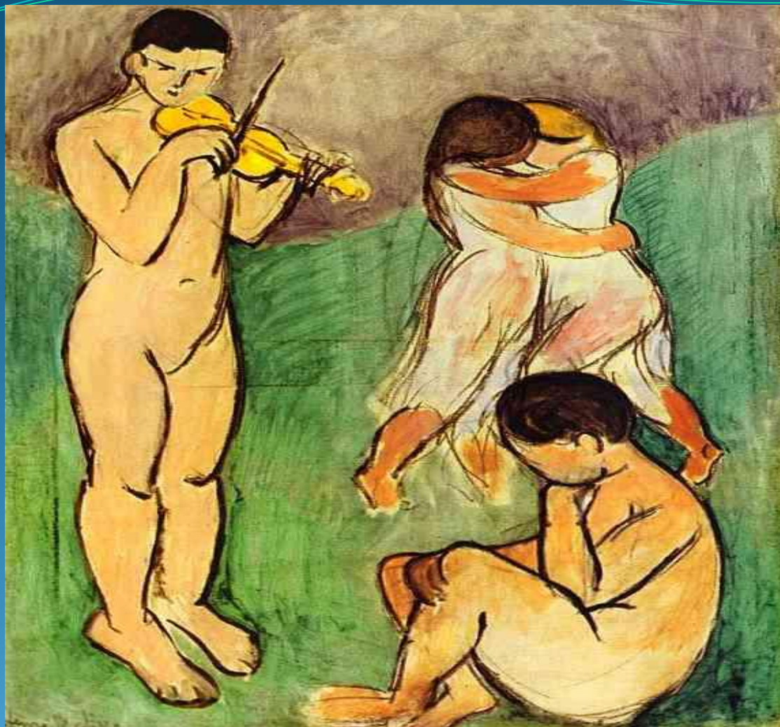
Музыка (эскиз) - 1907