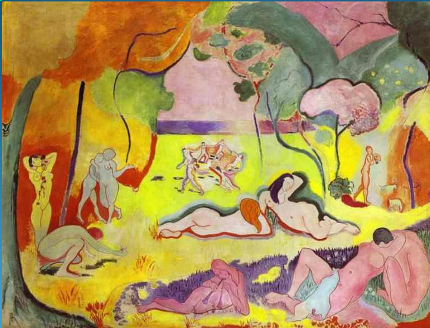
Счастье существования - 1905