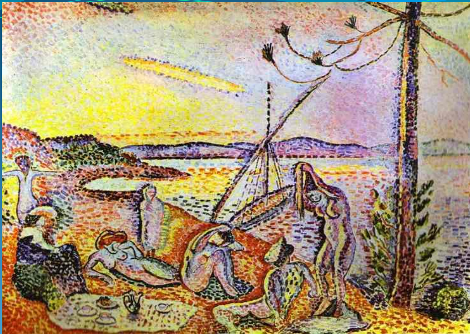
Роскошь, покой и наслаждение - 1904