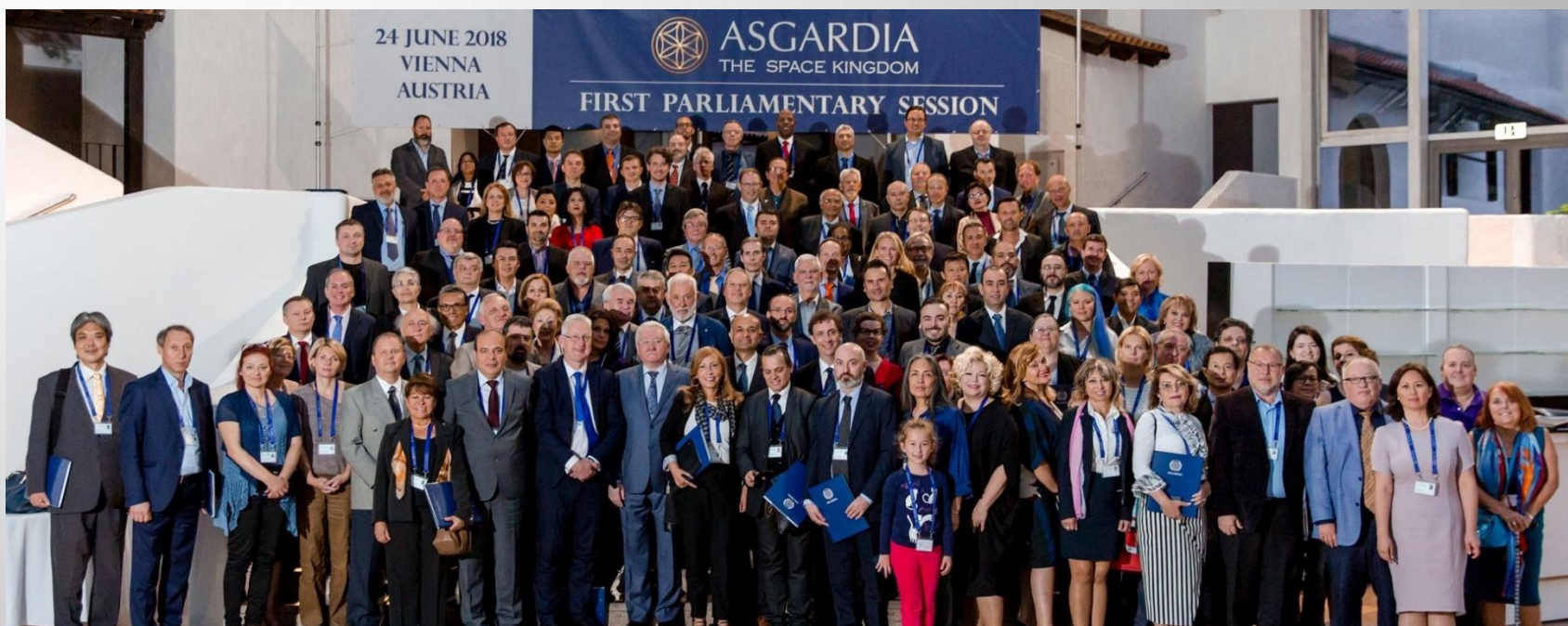
Первый Парламент государства ASGARDIA 24 июня 2018 г., Вена, Австрия [ https://asgardia.space/en/page/parliament ]