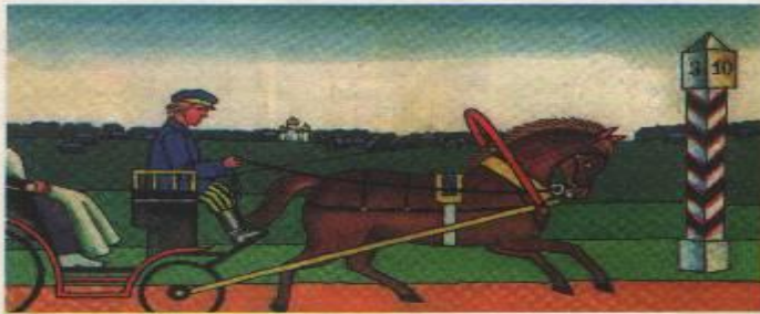
Когда возникли дорожные знаки

Особым языком «разговаривает» улица. На этом дорожном языке с водителями и пешеходами «разговаривают» улицы всех стран мира.