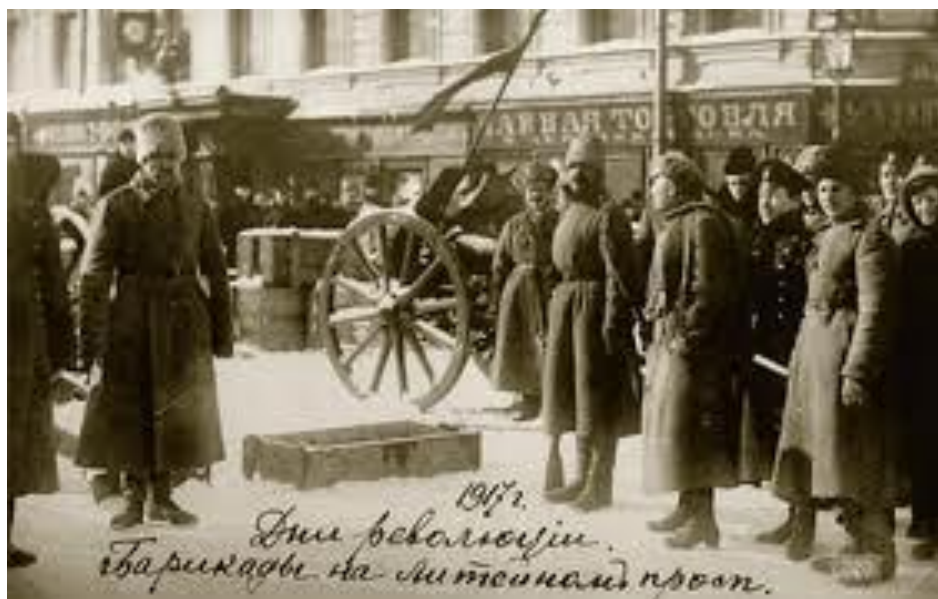
25 февраля 1917г на Путиловском заводе