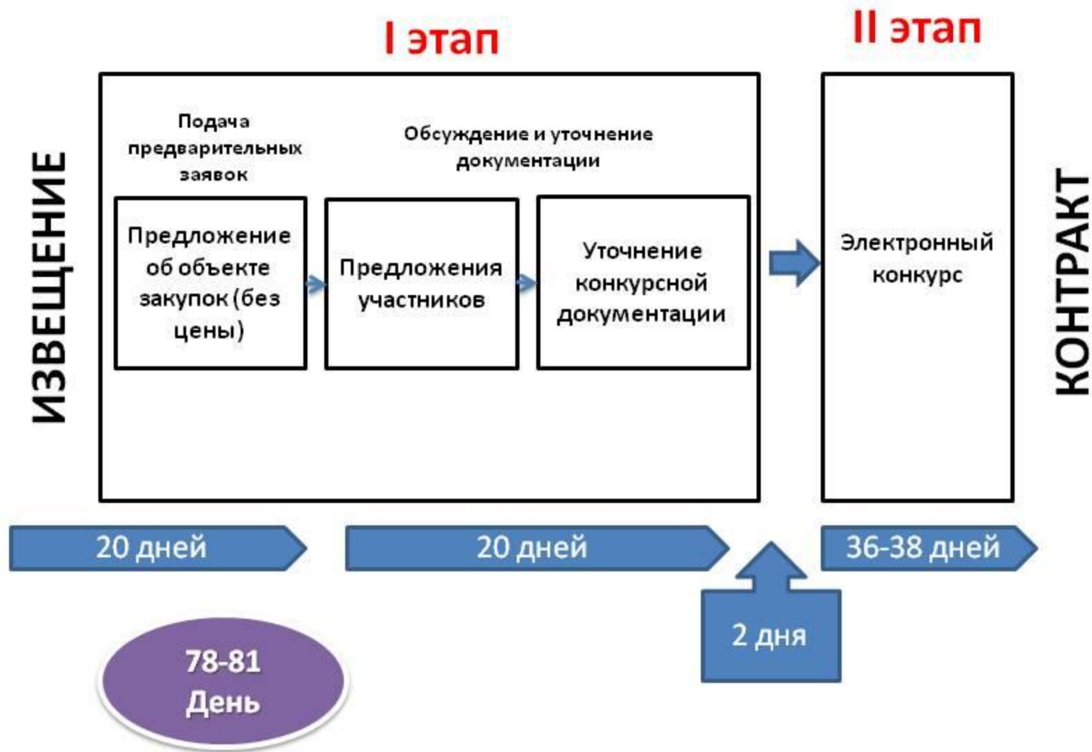
Схема проведения электронного двухэтапного конкурса