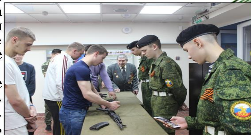
Экскурсии в военные части