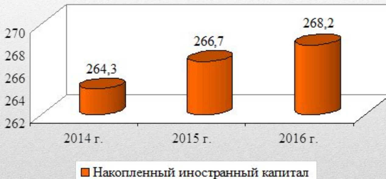
Рисунок 2 – Накопленный иностранный капитал в экономике России за 2014-2016 гг., млрд. долл. США