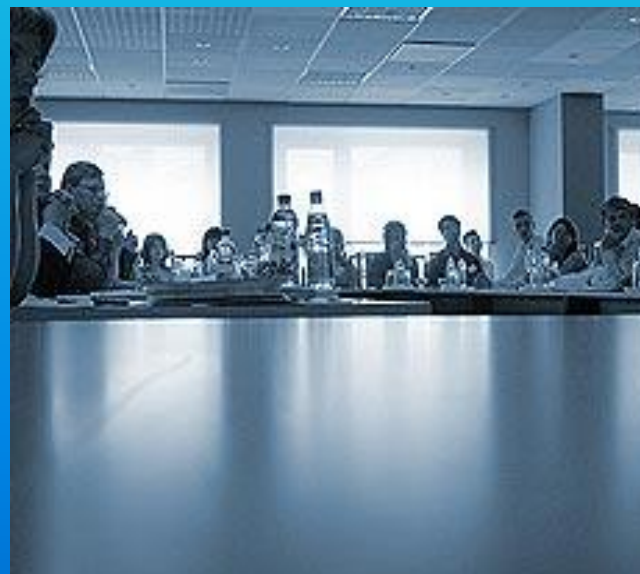
График работы нотариальных контор в Москве утвержден постановлением, подписанным мэром Юрием Лужковым. В зависимости от выбора нотариусов конторы могут работать с 09:00 до 18:00 с перерывом на обед с 13:00 до 14:00 либо с 10:00 до 19:00 с перерывом с 14:00 до 15:00. Прием населения должен осуществляться не менее шести часов в день. Работа в выходные дни и вечернее время, после 18:00, осуществляется дежурными нотариальными конторами, количество которых ежегодно утверждается Московской городской нотариальной палатой

▪ «Сами нотариусы понимают, что законы непрерывно обновляются, а значит, возникает необходимость учиться, - отметил Евгений Клячин. - Последний пример - это закон о дачной амнистии, до него дорабатывали III часть Гражданского кодекса, закон об акционерных обществах, об обществах с ограниченной ответственностью». Открывая семинар, представители петербургского университета, на базе которого проходит мероприятие, отметили, что актовому залу юридического факультета и раньше доводилось принимать в своих стенах президентов, но иных - Владимира Путина, Жака Ширака и Герхарда Шредера. Президенты же нотариальных палат, в отличие от них, не почетные гости, а свои люди, коллеги. К их услугам, заявила руководитель Института нотариата, созданного на базе юрфака университета, Наталья Рассказова - обширная юридическая библиотека (в том числе электронная), по отзывам экспертов, лучшая в Европе.