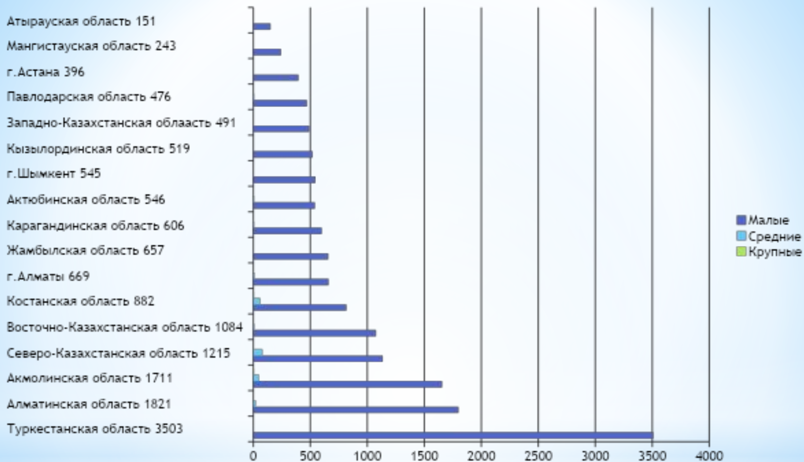
* Рисунок 1 - Количество предприятий по регионам

Примечание: рассчитан на основе данных Евразийской экономической комиссии [14]