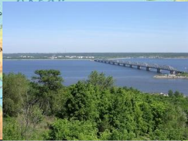
р. Волга (3530 км)

Бассейн внутреннего стока занимает центральную часть материка. Самая крупная река этого бассейна – Волга, длиной 3530 км. Волга – равнинная река, которая несёт свои воды в Каспийское море-озеро, образуя мощную дельту.