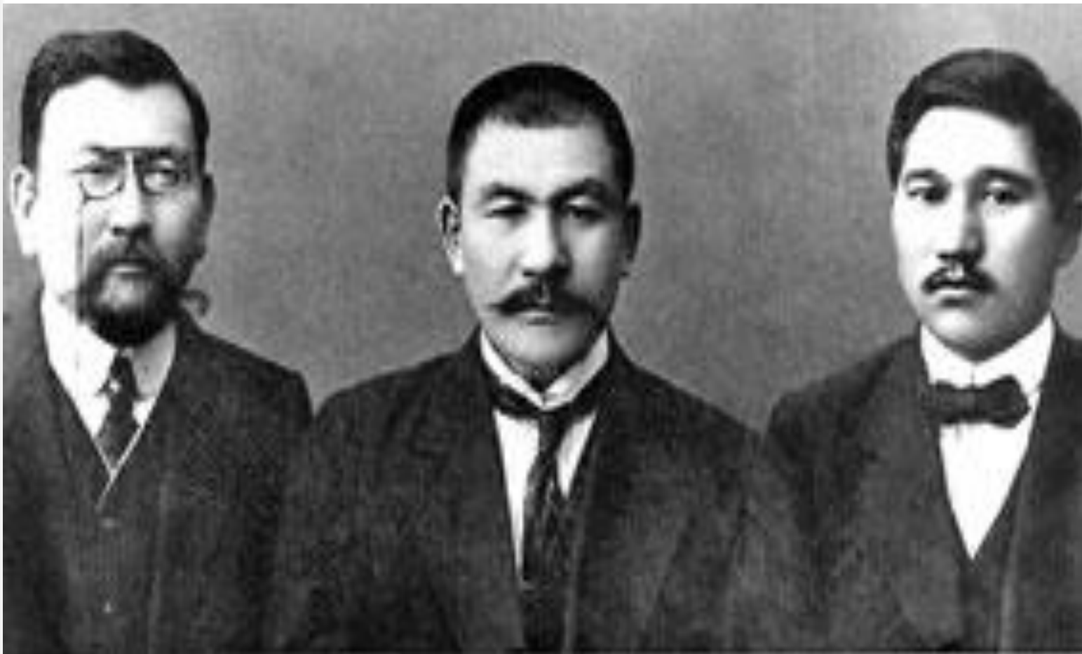
А.Байтұрсынов, Ә.Бөкейханов, М.Дулатов (Алаш Орда мүшелері)