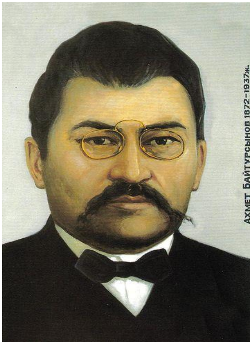
Ахмет Байтұрсынов (1872- 1937)