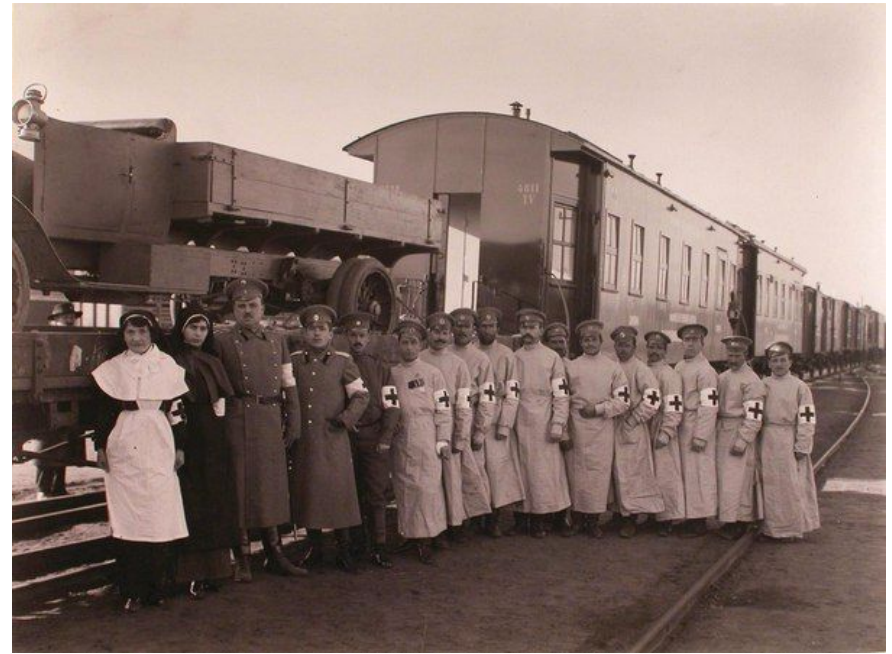
Группа медицинского и обслуживающего персонала подвижного питательного отряда около санитарного поезда