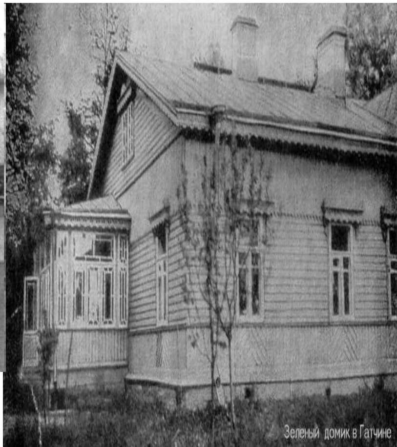
Частный госпиталь в жилом доме писателя Куприна