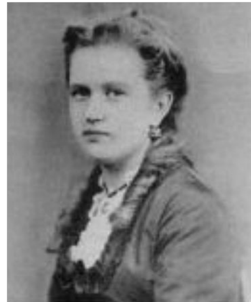
Александра Львовна Толстая