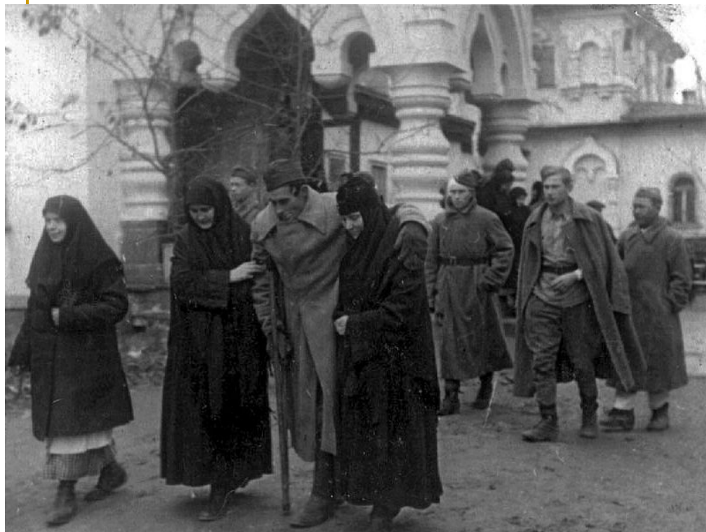
Госпиталь в Покровском монастыре