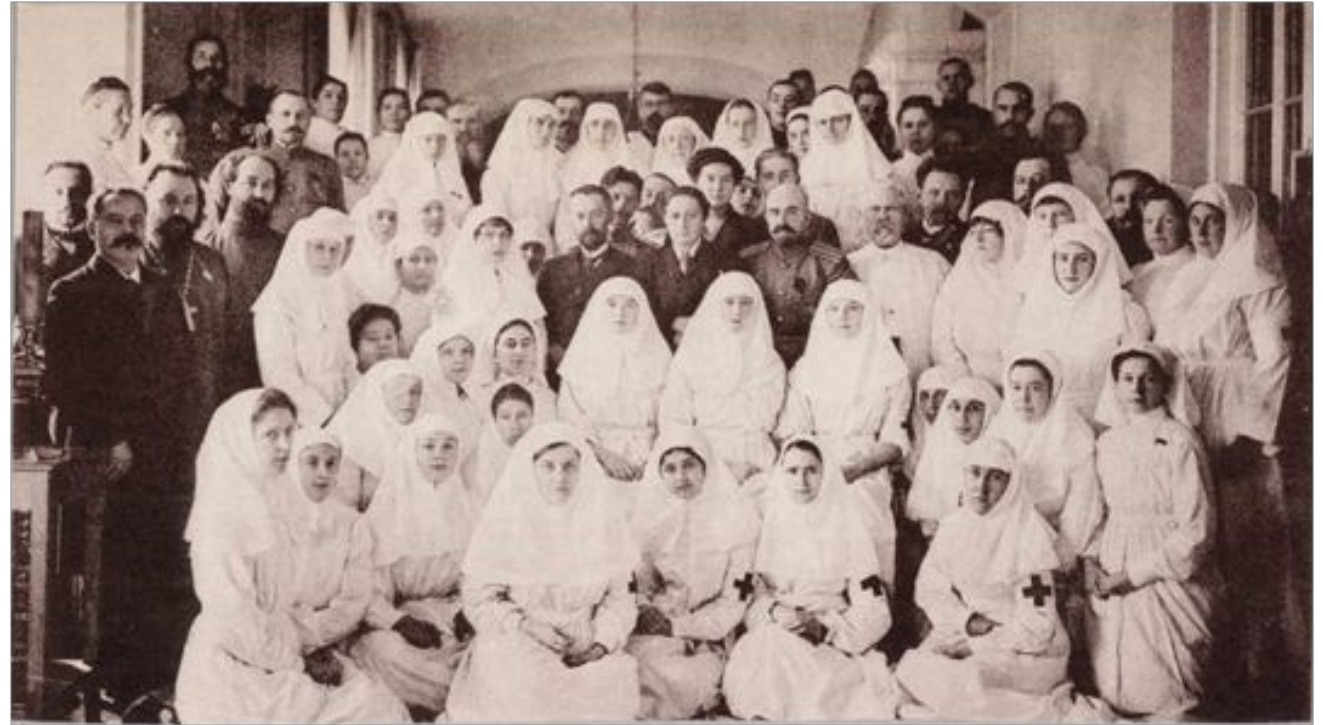
Персонал Дворцового лазарета