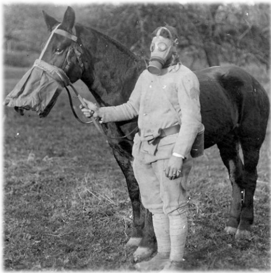
Противогазы Первой мировой