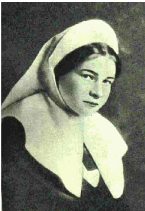
Любовь Дмитриевна Менделеева