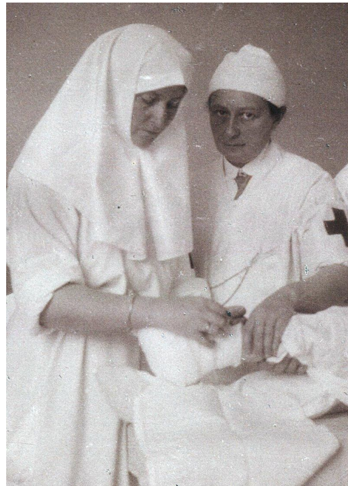
Императрица Александра Федоровна и старший врач лазарета княжна В.И. Гедройц в перевязочной.