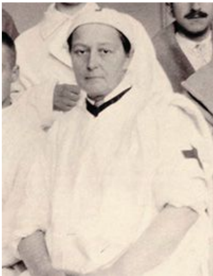
Княжна Вера Игнатьевна Гедройц