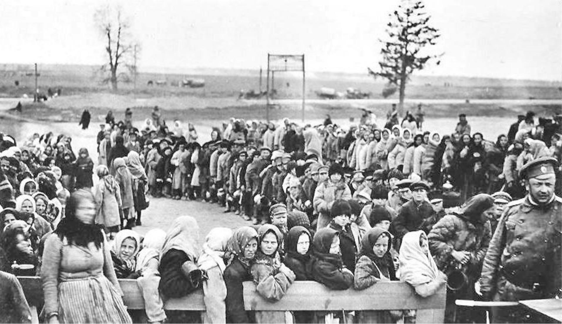
Дети-беженцы в очереди за хлебом и сахаром у врачебно-питательного пункта, организованного отрядом РОКК, созданным на средства В. М. Пуришкевича. Бобруйск. Сентябрь 1915.