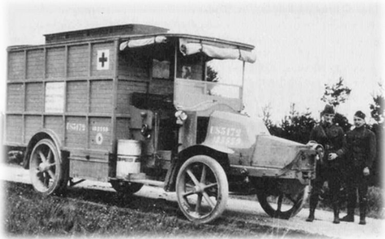
Мобильный рентген Первой мировой войны