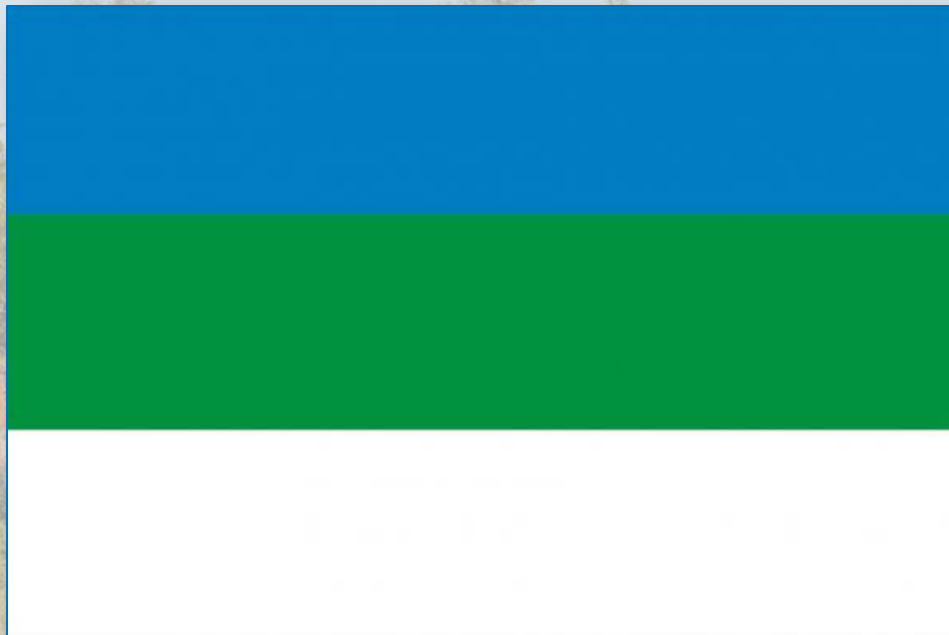
Флаг Республики Коми

Синий цвет символизирует чистое небо, величие и бескрайность севера.