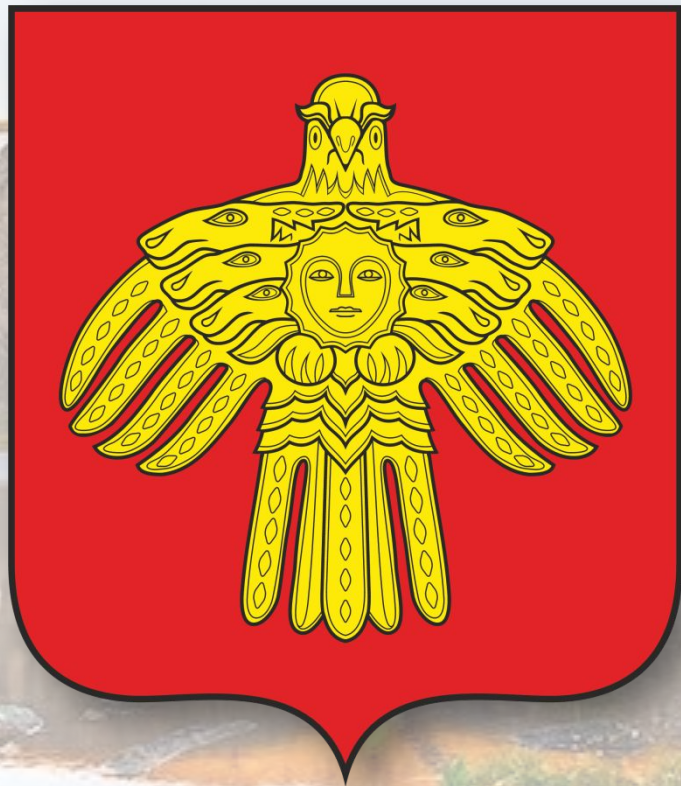
Герб Республики Коми

На гербе изображён силуэт золотой хищной птицы на красном геральдическом щите, а на её груди - лик женщины в обрамлении шести лосиных голов.