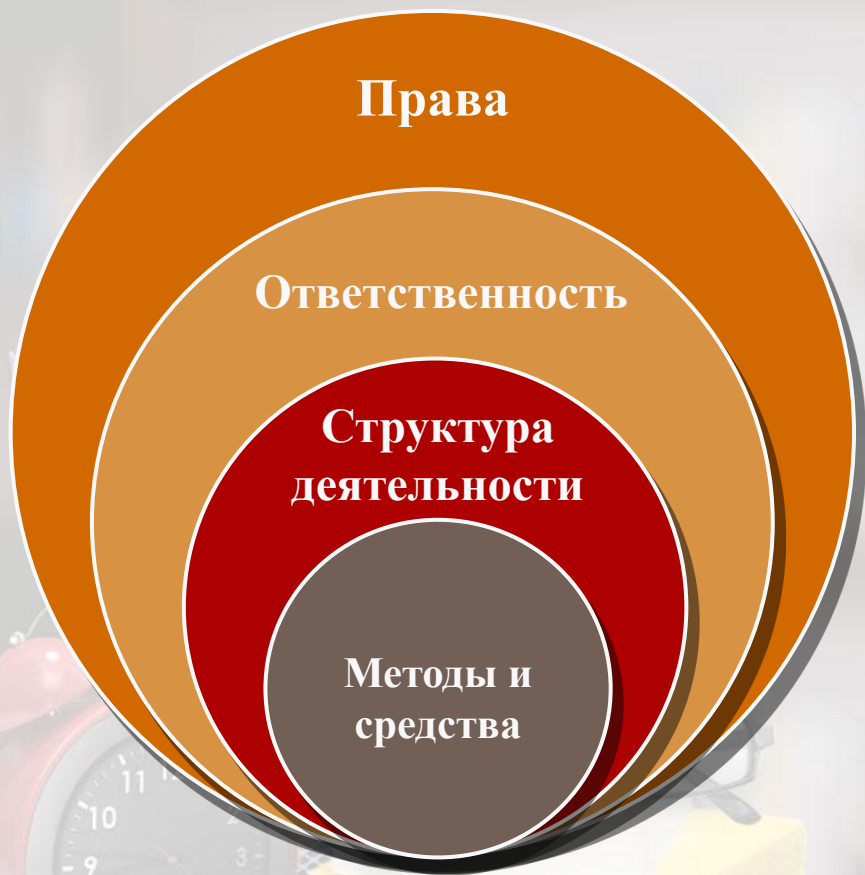
Схема деятельности учителя

◆ То, что учителю начальных классов разрешено и запрещено законом;