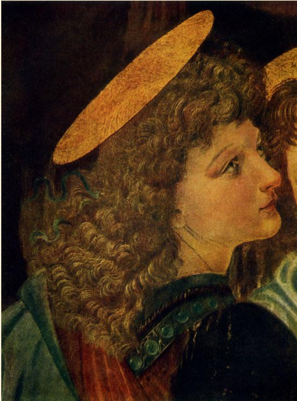
Ангел на картине Веррокьо написан Леонардо да Винчи