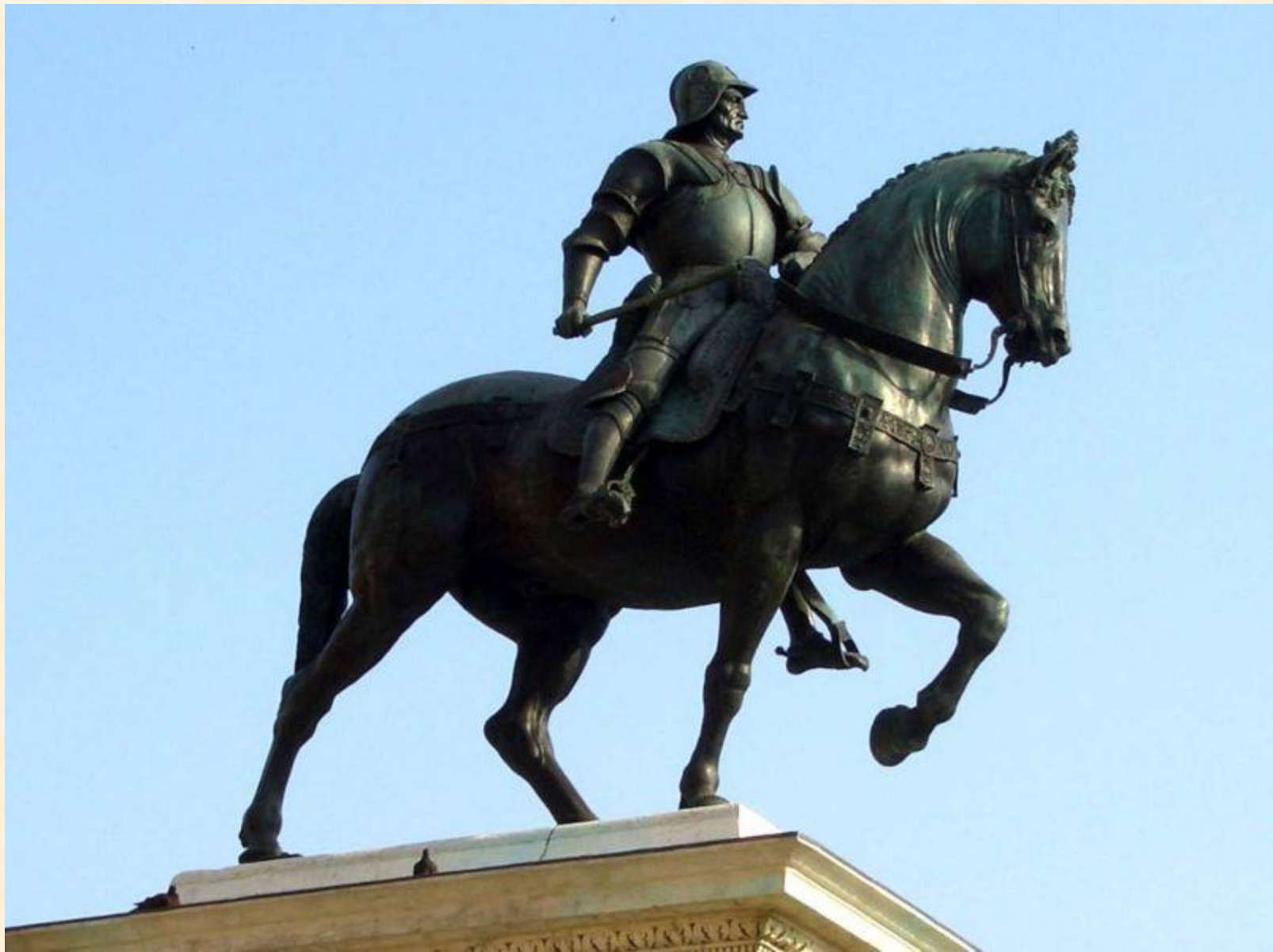
Верроккьо. Конная статуя кондотьера Коллеони в Венеции