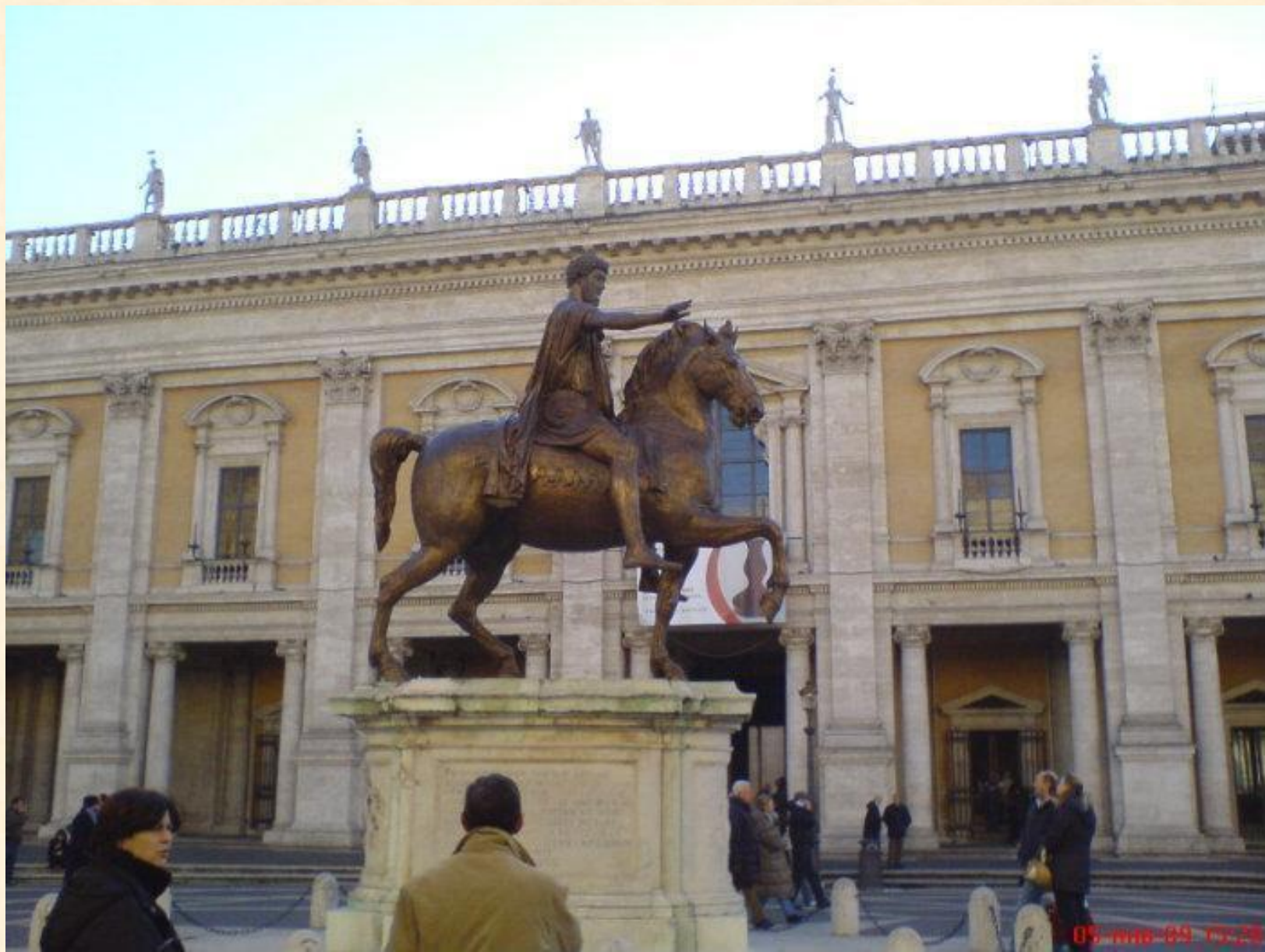
Конная статуя Марка Аврелия