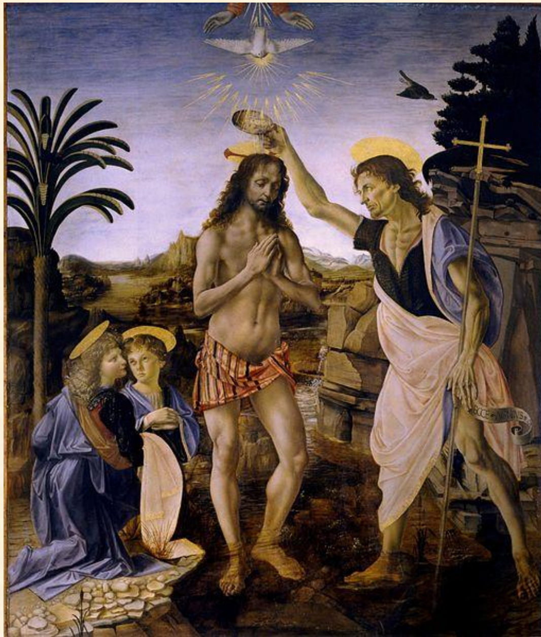
Крещение Христа, галерея Уффици, Флоренция, 1470-1475