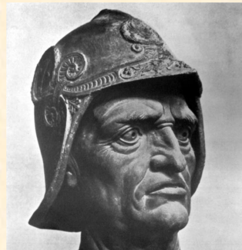
Верроккьо. Конная статуя кондотьера Коллеони в Венеции