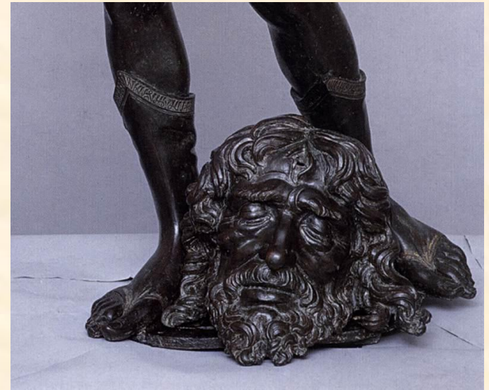
Бронзовая статуя Давида в Палаццо Веккьо