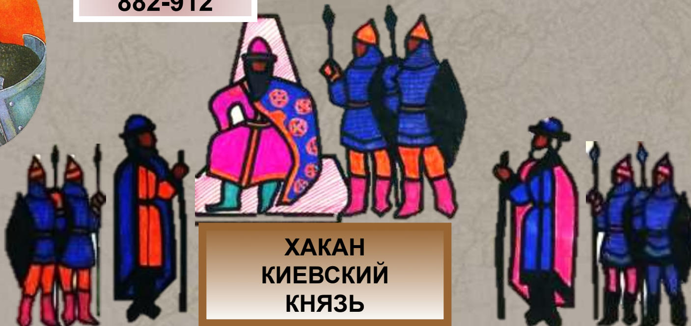
ХАКАН КИЕВСКИЙ КНЯЗЬ

ПЛЕМЕННЫЕ КНЯЗЬЯ ОБЛАДАЮТ ЗНАЧИТЕЛЬНОЙ САМОСТОЯТЕЛЬНОСТЬЮ, НО ПОДЧИНЯЮТСЯ КИЕВСКОМУ КНЯЗЮ ПРИ РЕШЕНИИ ВНЕШНЕПОЛИТИЧЕСКИХ ПРОБЛЕМ