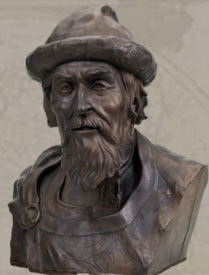
Ярослав Мудрый 1019-1054