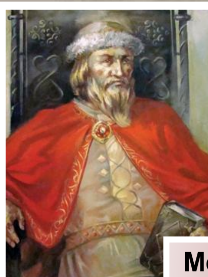
Мстислав Великий 1125 -1132

Древнерусское государство распалось на независимые княжества и земли