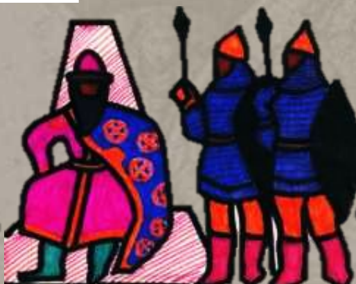
ВЕЛИКИЙ КНЯЗЬ РУССКИЙ