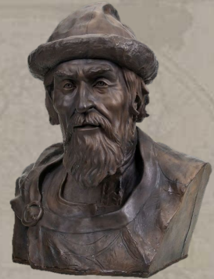
Ярослав Мудрый 1019-1054