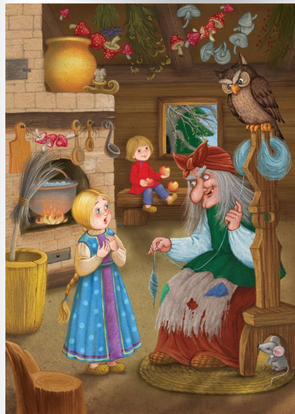
Русская народная сказка «Гуси-лебеди»