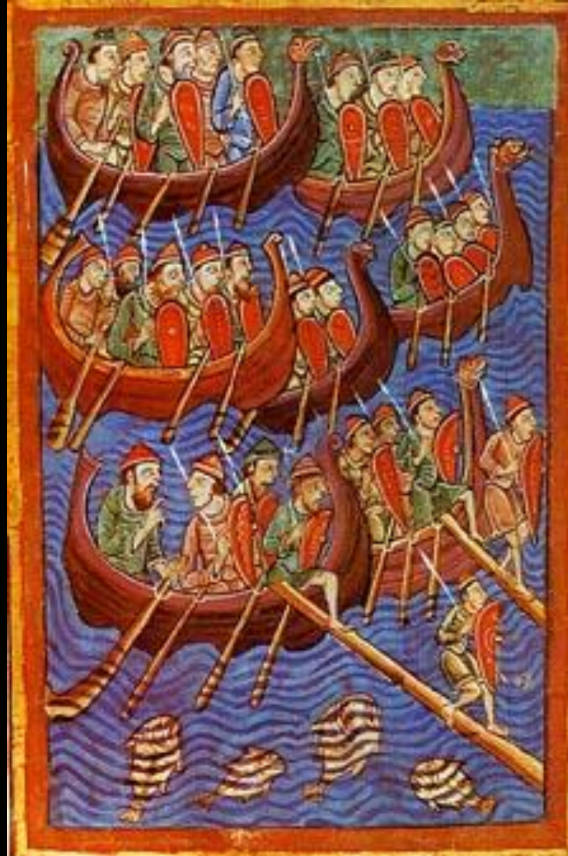
Représentation de Vikings datant du IXe ou du Xe siècle.