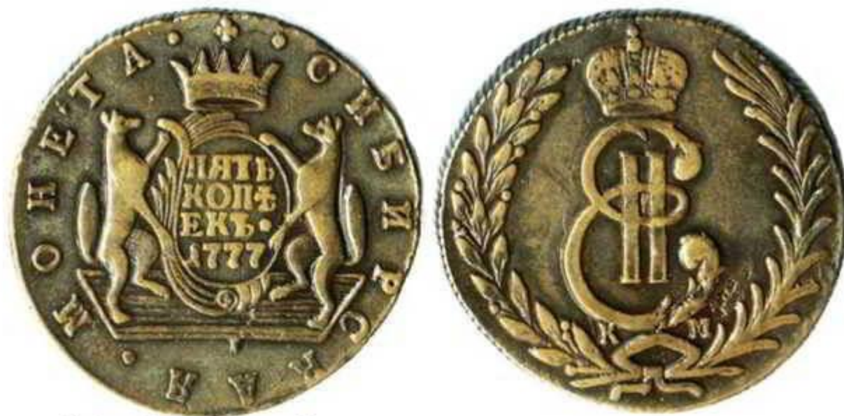
“Сибирские” деньги из сплава меди, серебра и золота, 1777