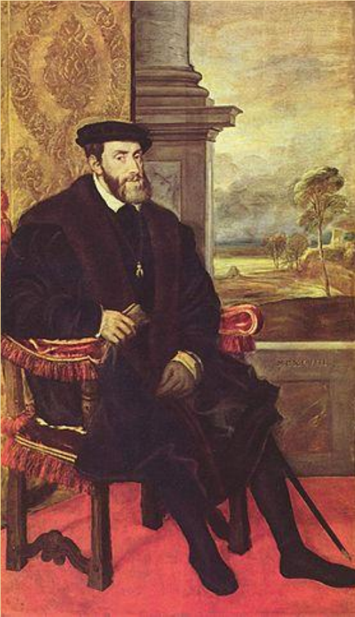
Карл V Габсбург