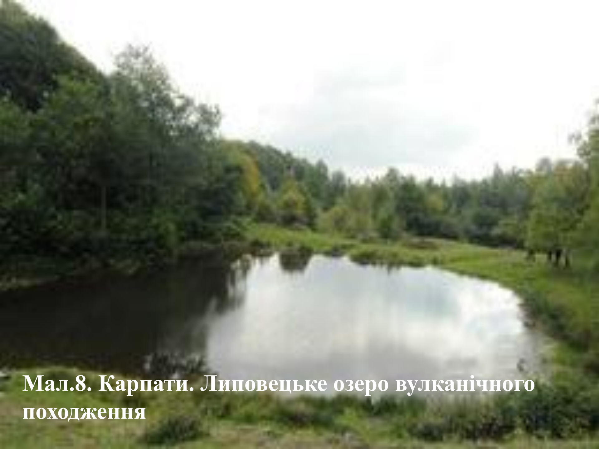
Мал.8. Карпати. Липовецьке озеро вулканічного походження