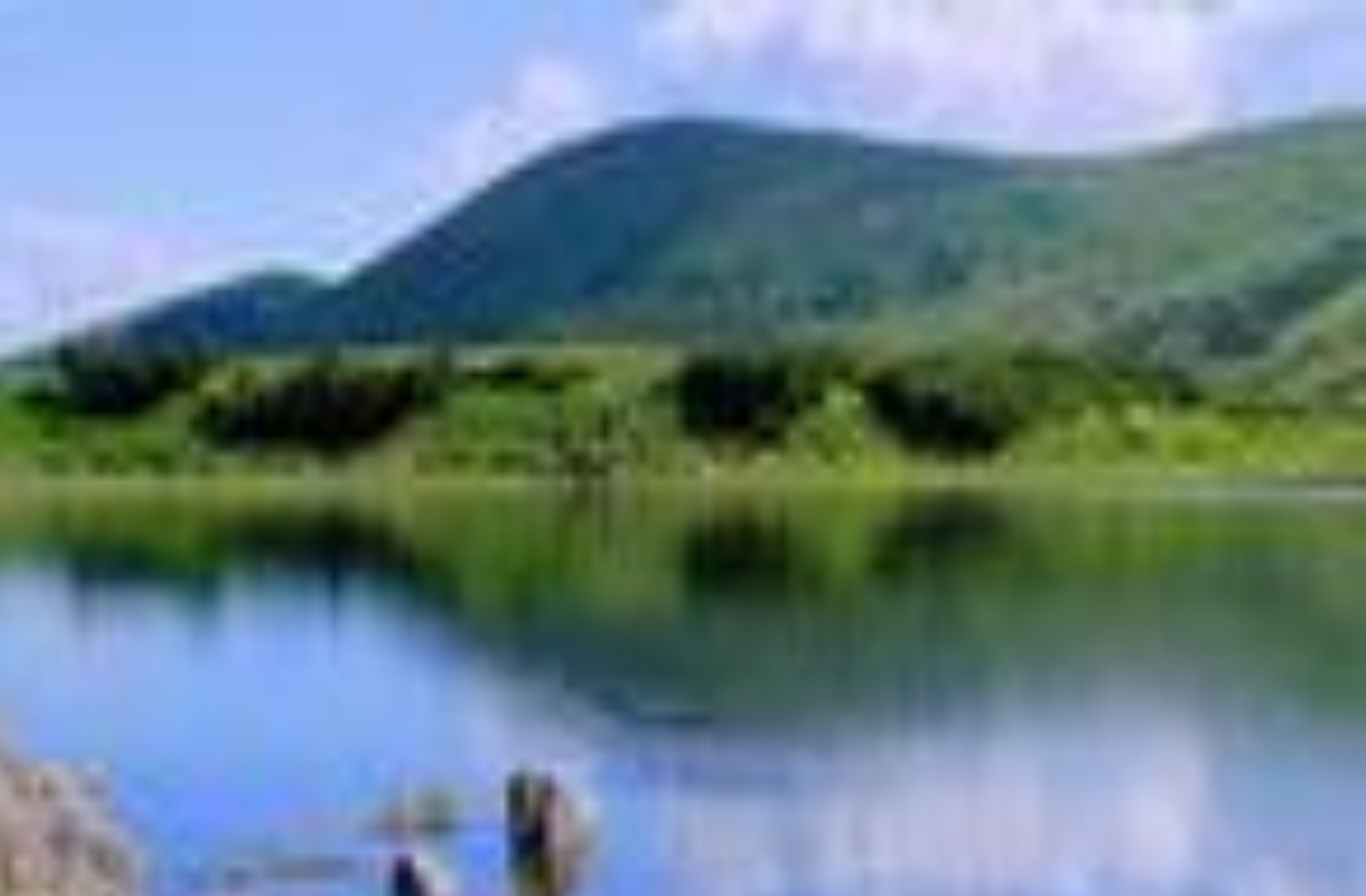
Мал.3. Закарпатська область. Озеро Бребенескул – найбільш високогірне озеро України (льодовикове)