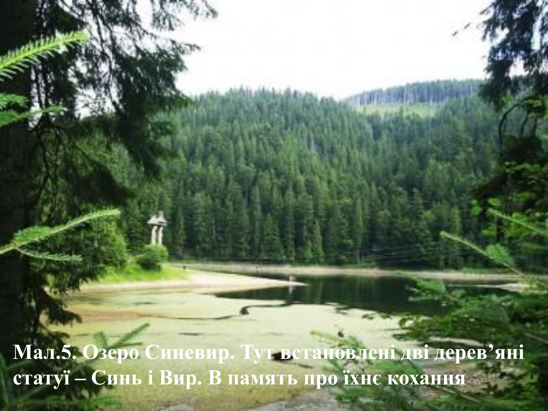
Мал.5. Озеро Синевир. Тут встановлені дві дерев'яні статуї – Синь і Вир. В пам'ять про їхнє кохання