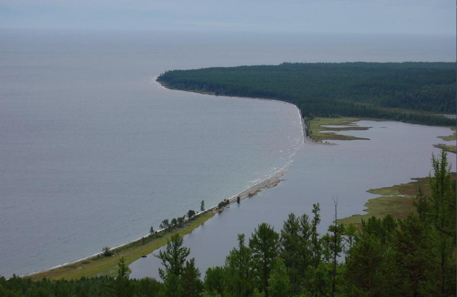
Мал.11.озеро Сасик (лиманне)