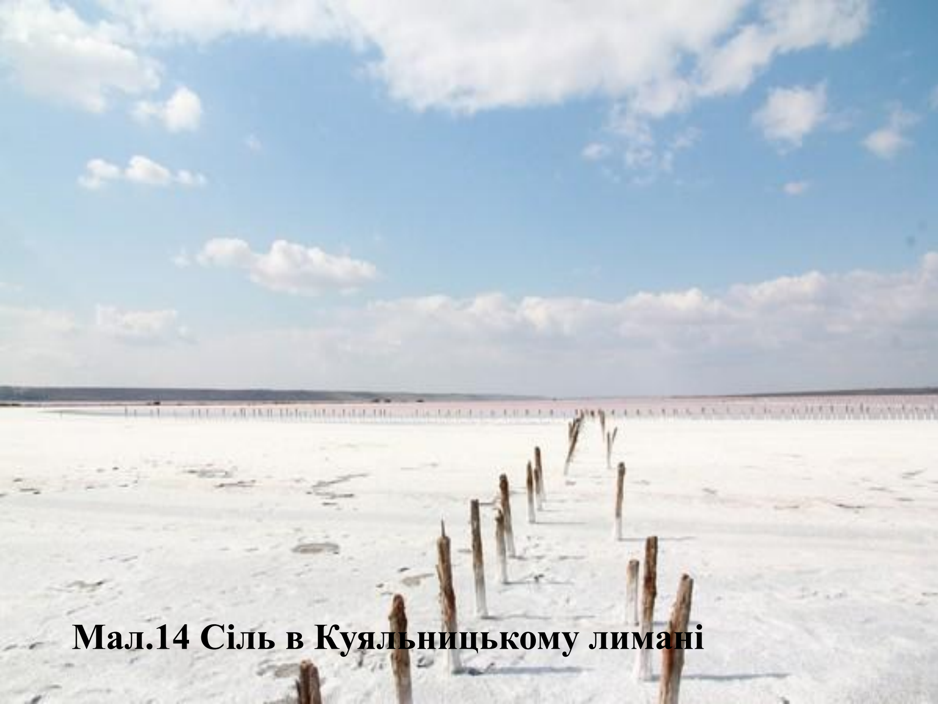
Мал.14 Сіль в Куяльницькому лимані