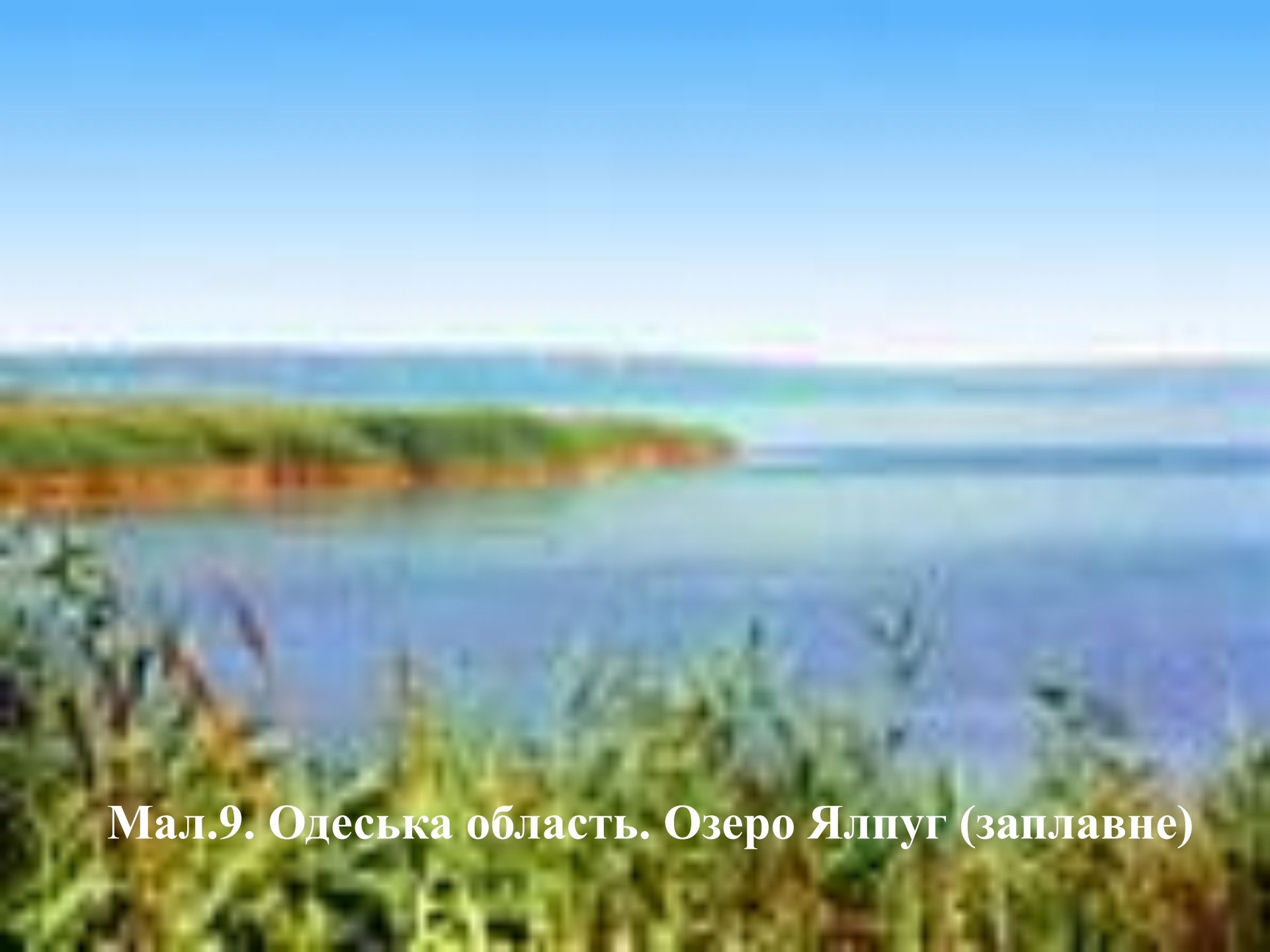
Мал.9. Одеська область. Озеро Ялпуг (заплавне)