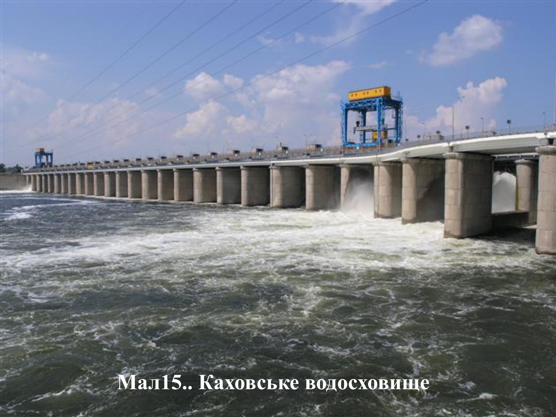
Мал15.. Каховське водосховище