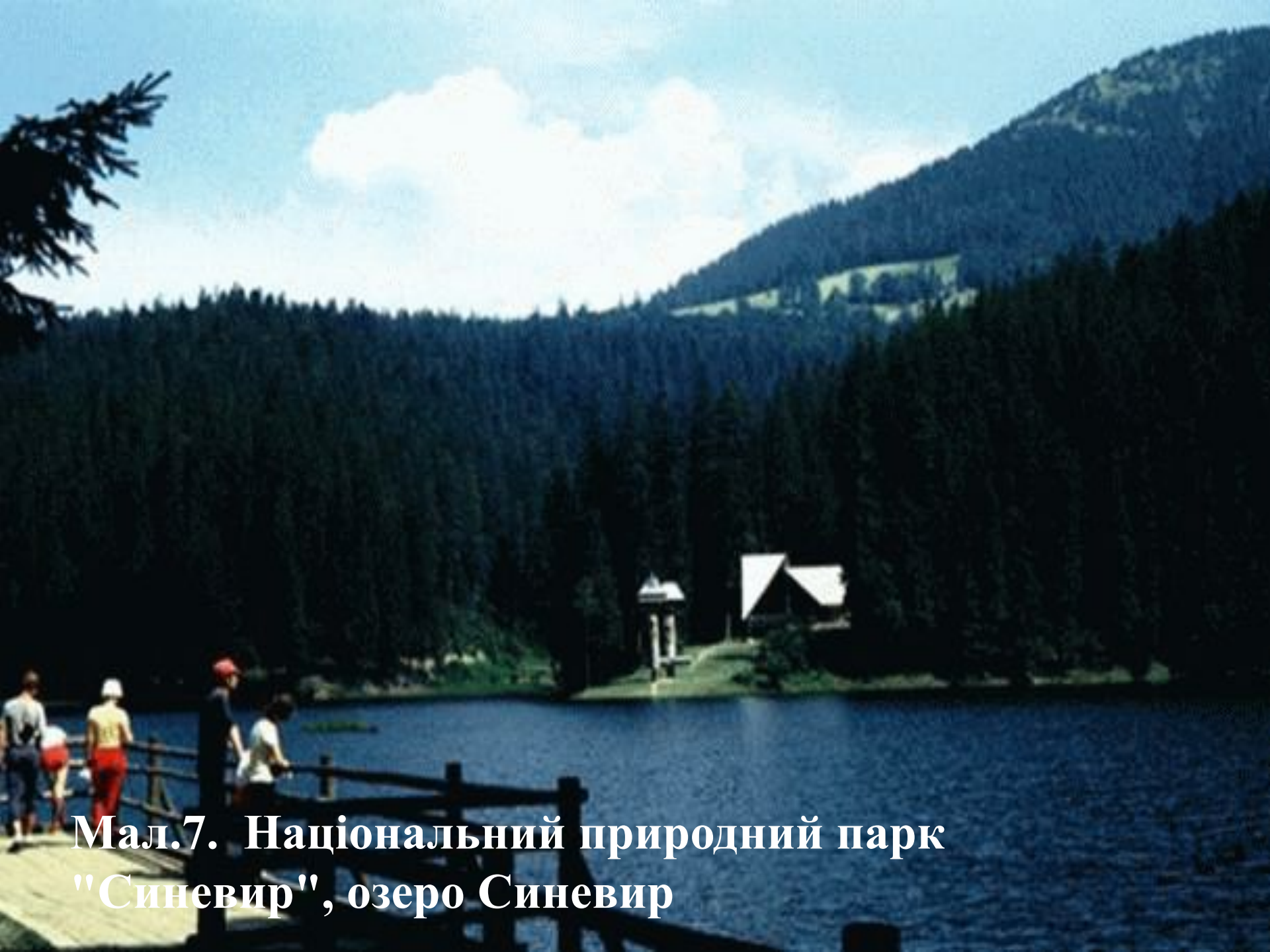
Мал.7. Національний природний парк "Синевир", озеро Синевир