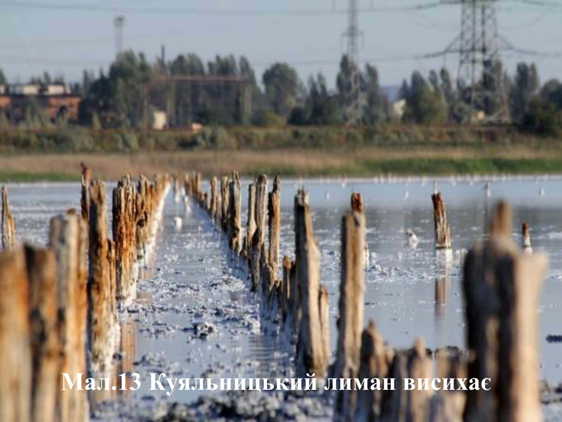
Мал.13 Куяльницький лиман висихає