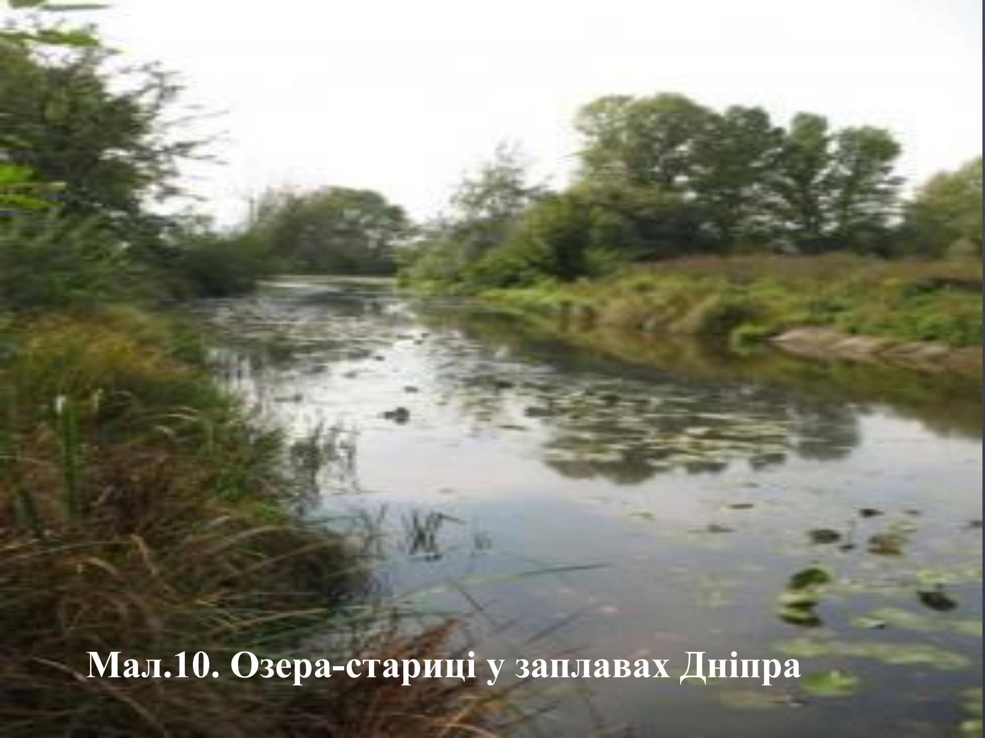
Мал.10. Озера-стариці у заплавах Дніпра