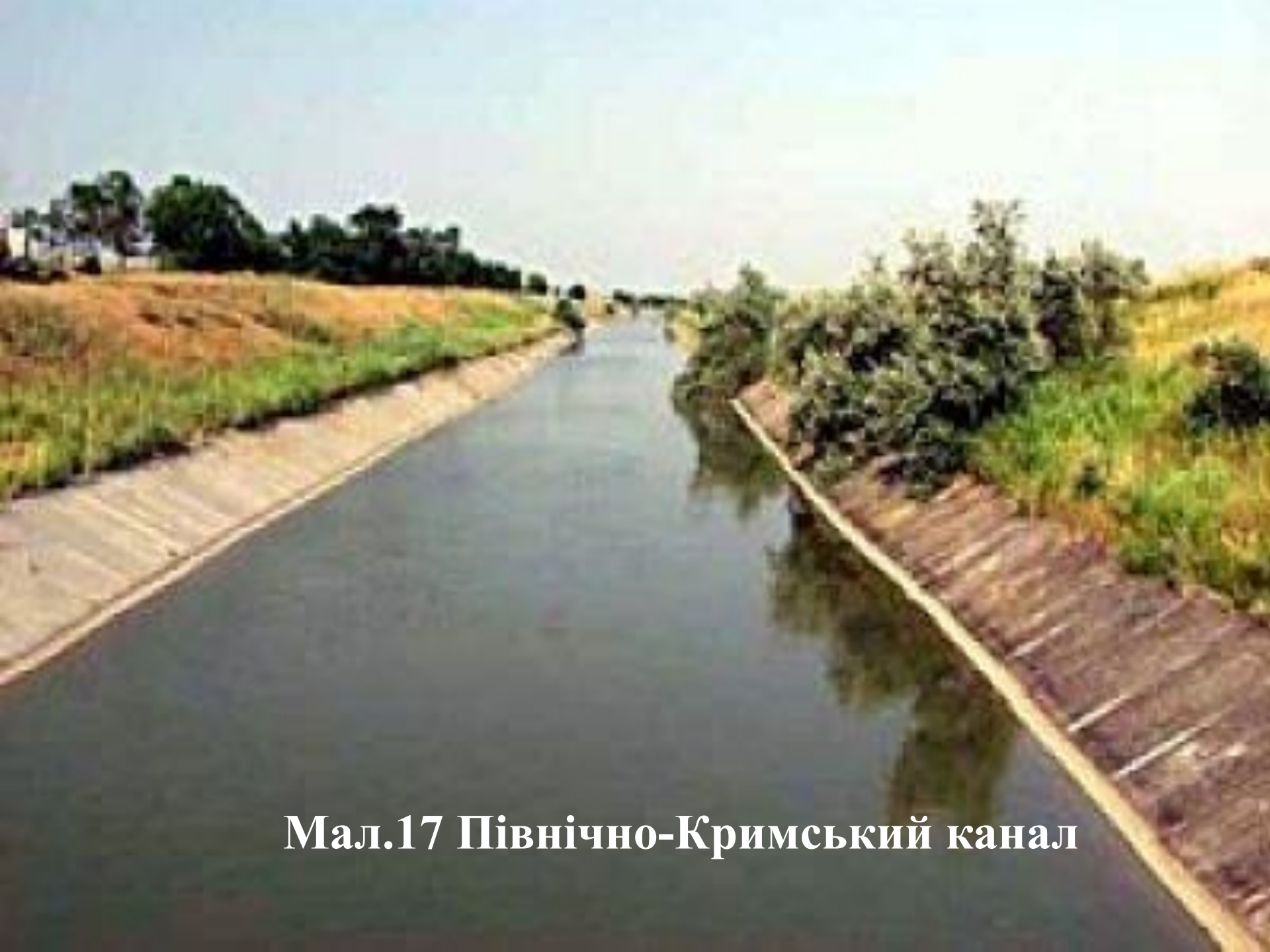
Мал.17 Північно-Кримський канал