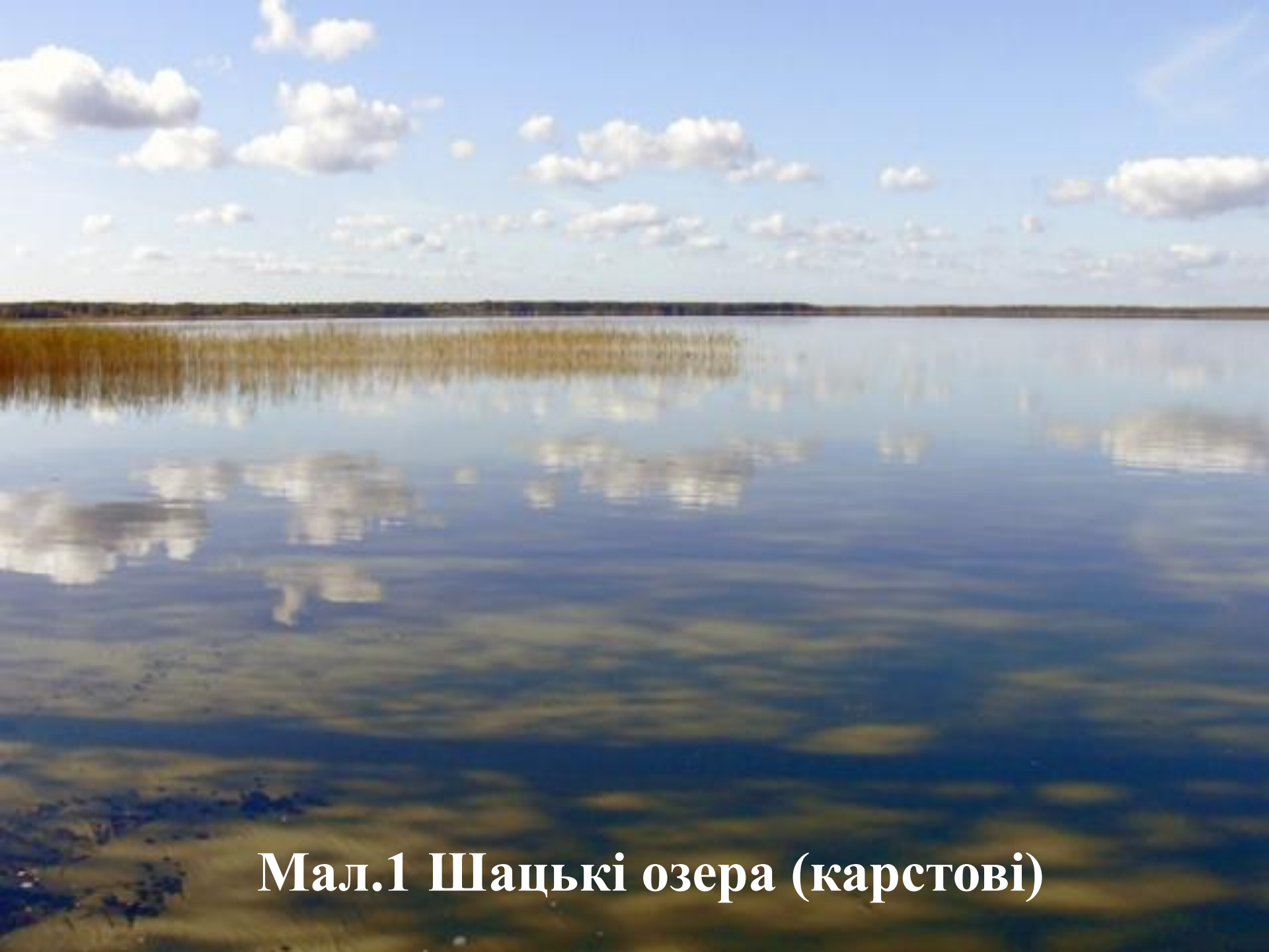
Мал.1 Шацькі озера (карстові)