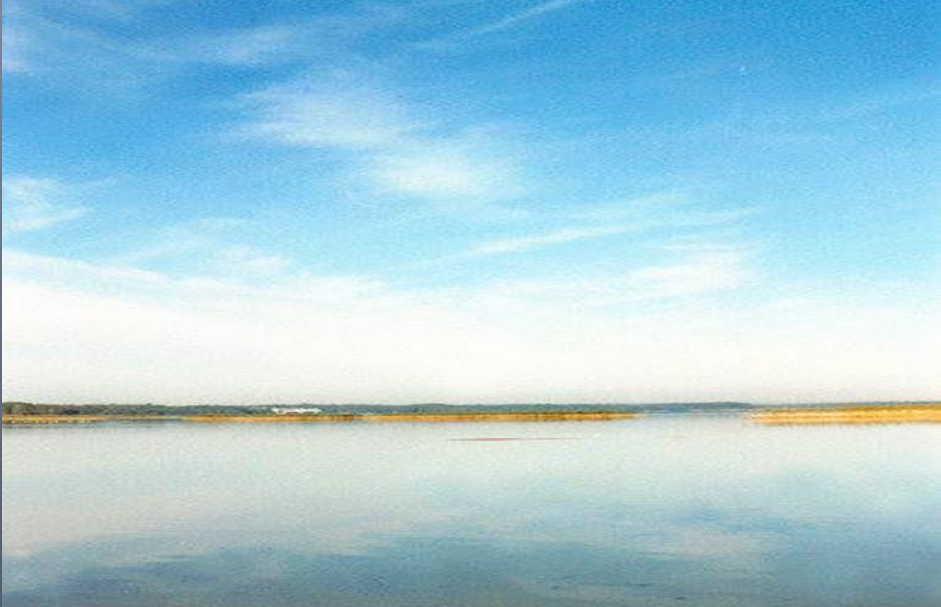
Мал.2. Найглибше озеро в Україні – Свитязь (карстове)