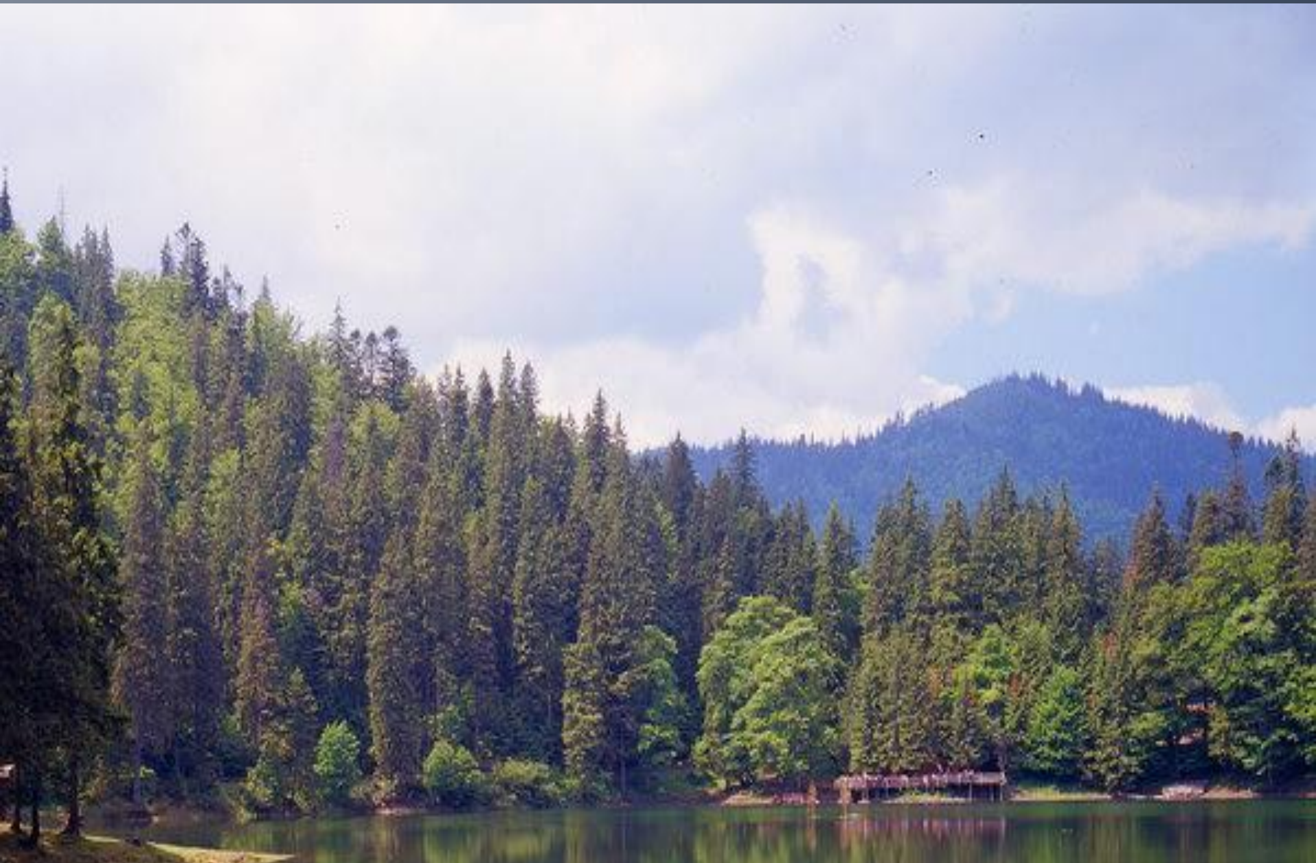
Мал.6. Закарпатська область. Живописний Синевир – озеро обвально-завального типу.