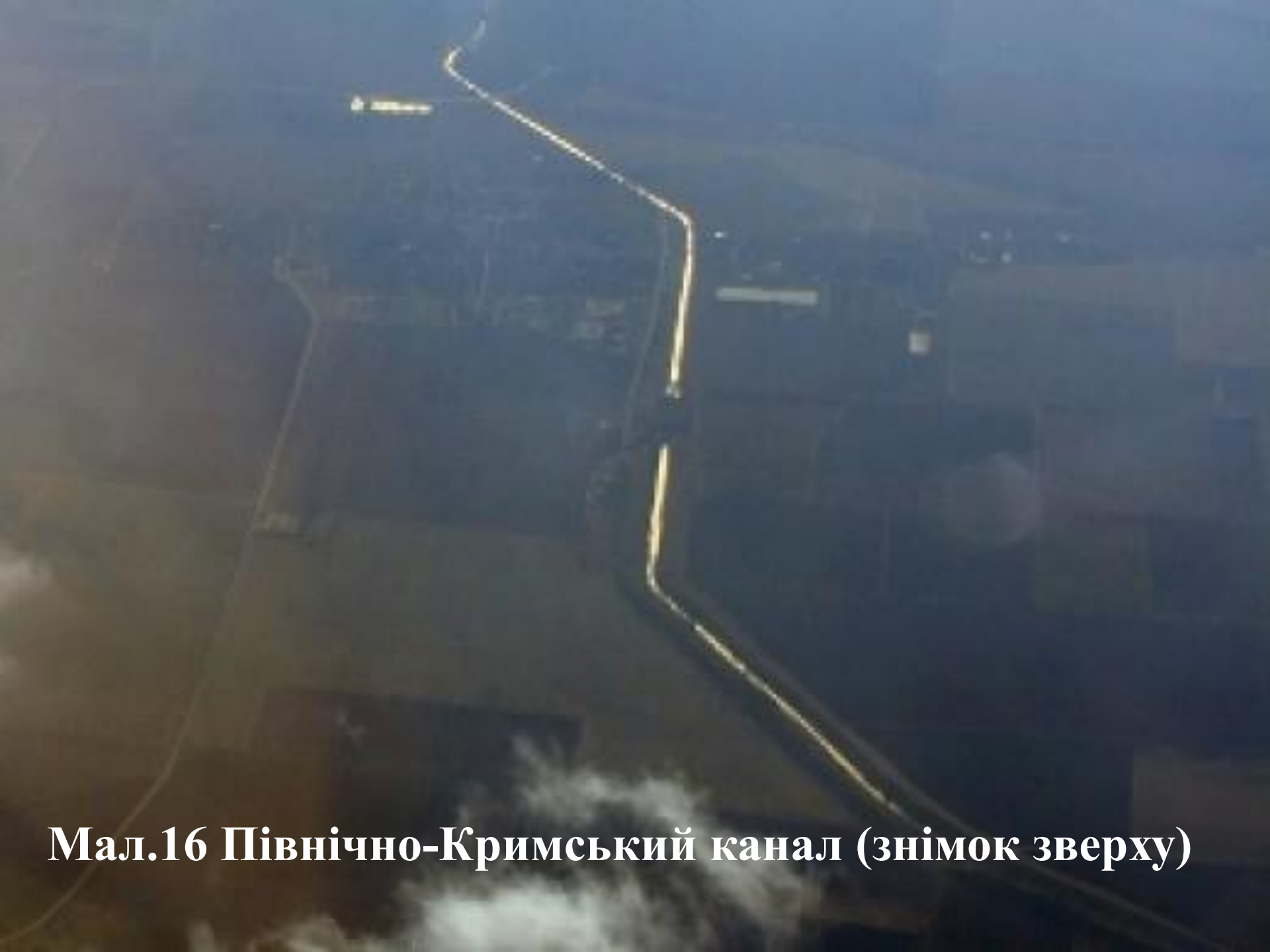
Мал.16 Північно-Кримський канал (знімок зверху)