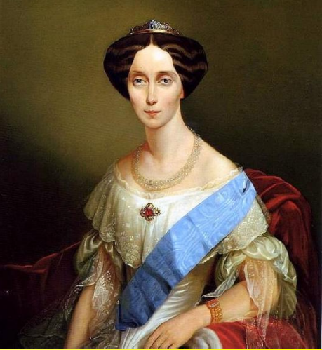
Княгиня Мария Александровна