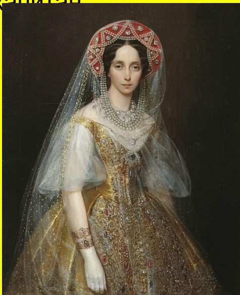
Княгиня Мария Александровна

Наиболее известными произведениями И.К. Макарова считаются портреты членов семьи А.С. Пушкина – жены («Портрет Натальи Николаевны Пушкиной-Ланской, рожд. Гончаровой». 1849), дочерей Натальи («Портрет Натальи Александровны Пушкиной». 1849) и Марии («Портрет Марии Александровны Гартунг». 1860), сына Александра. Работы художника хранятся в музеях Москвы, Санкт-Петербурга и других городов.