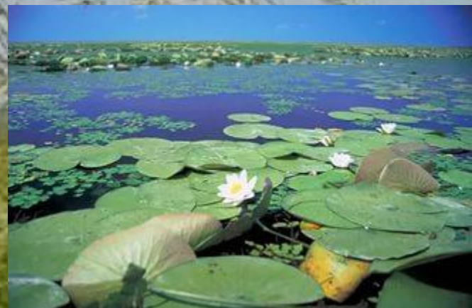
Дунайський Біосферний заповідник