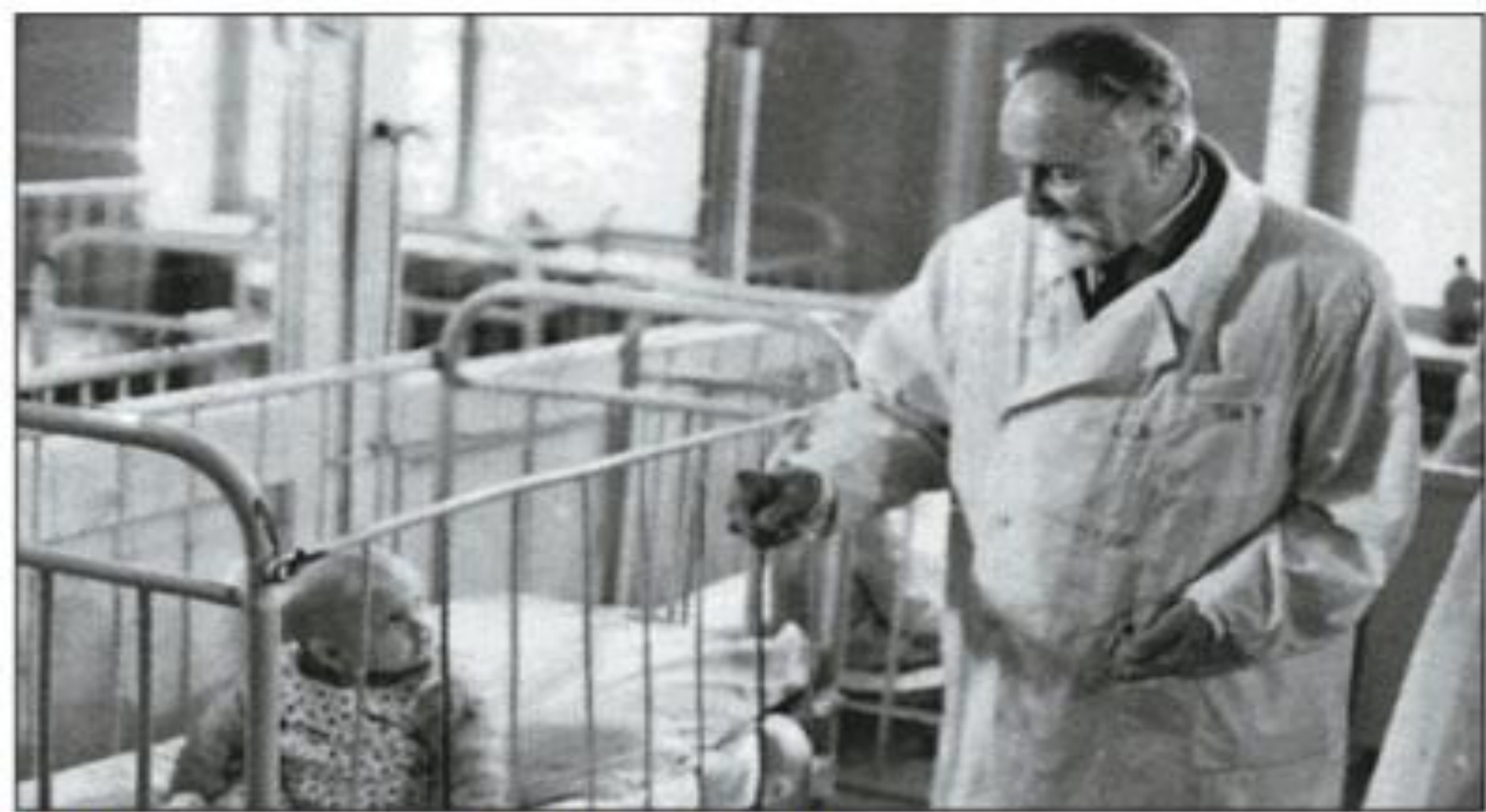
На обходе больных в клинике. Фото 1965 г.

Выдающийся советский профессор педиатрии Георгий Сперанский