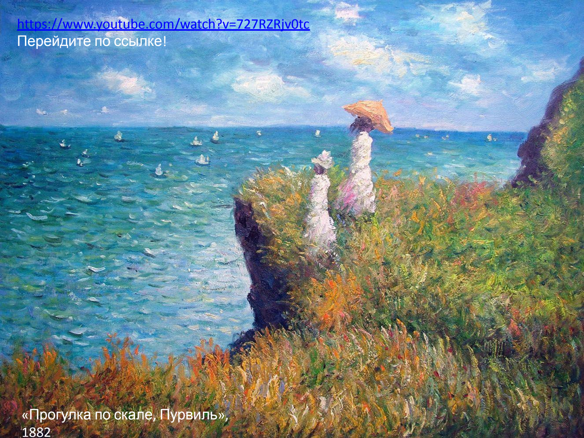
«Прогулка по скале, Пурвиль»,