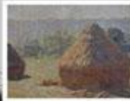
HAYSTACKS AT THE END OF THE SUMMER, MORNING EFFECT