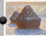
HAYSTACKS, WHITE FROST EFFECT

1891 EDINBURGH, NATIONAL GALLERIES OF SCOTLAND