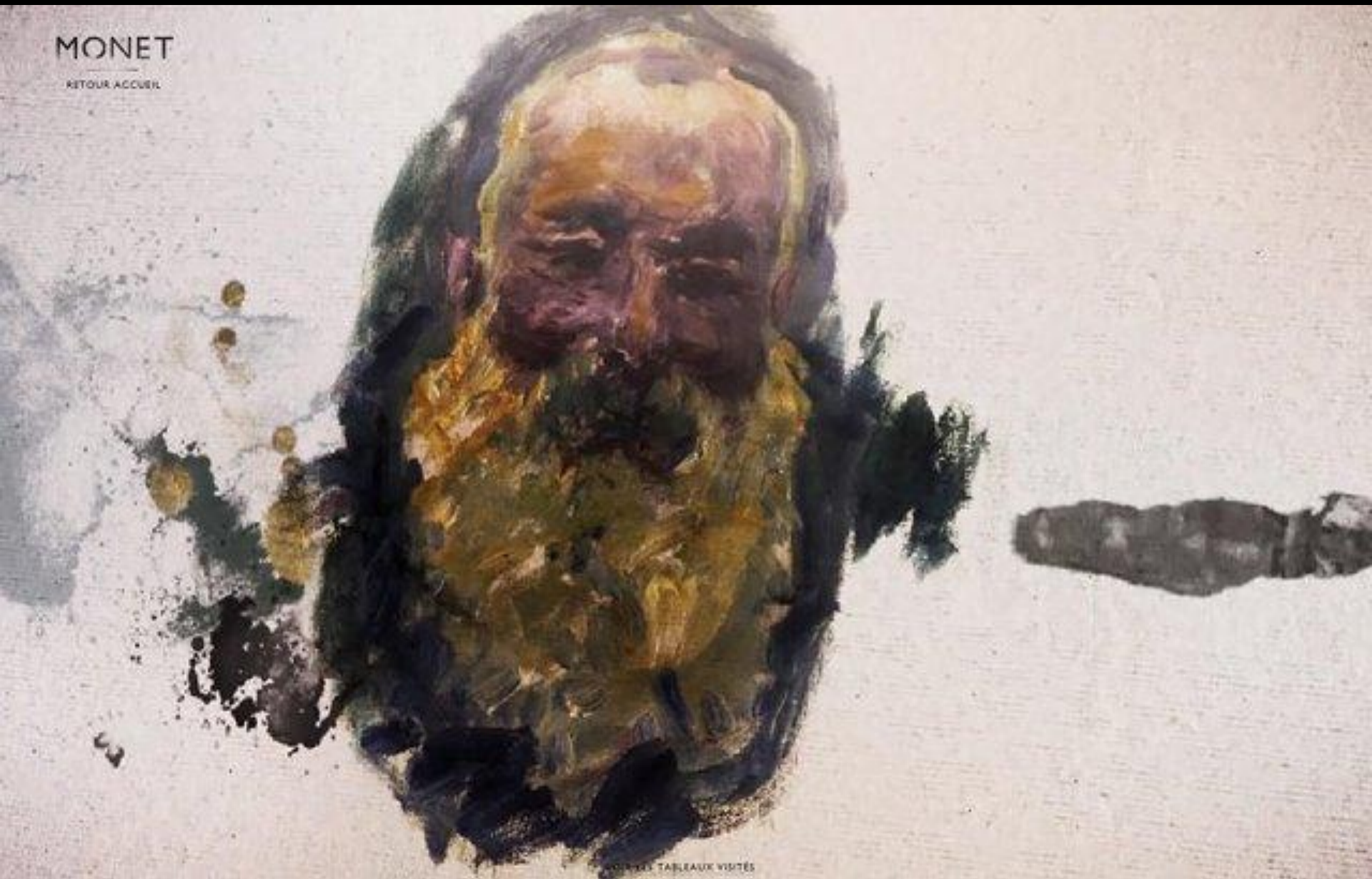
Автопортрет художника. 1917