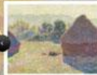
HAYSTACKS IN THE SUNLIGHT, MIDDAY

1891 EDINBURGH, NATIONAL GALLERIES OF SCOTLAND