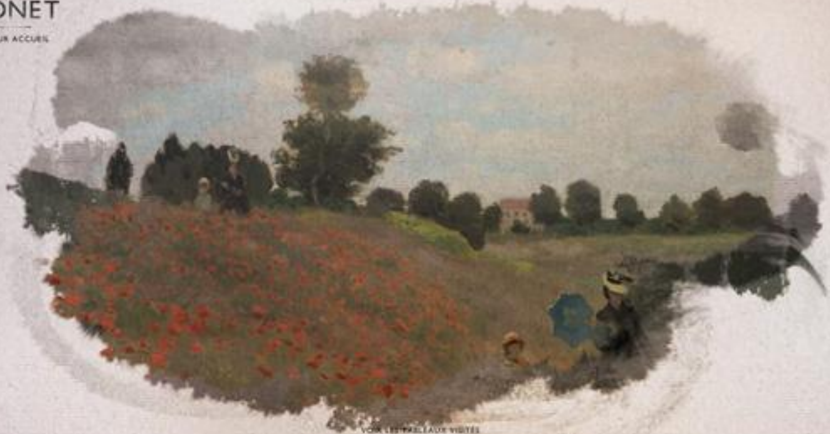
Возникает картина "Поле маков", 1873 г. Музей д'Орсэ, Париж.