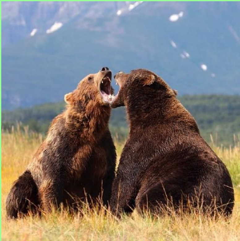
Бурый медведь (хозяин тайги)

Многочисленны и широко распространены: бурый медведь, рысь, росомаха, бурундук, куница, соболь, белка и др.