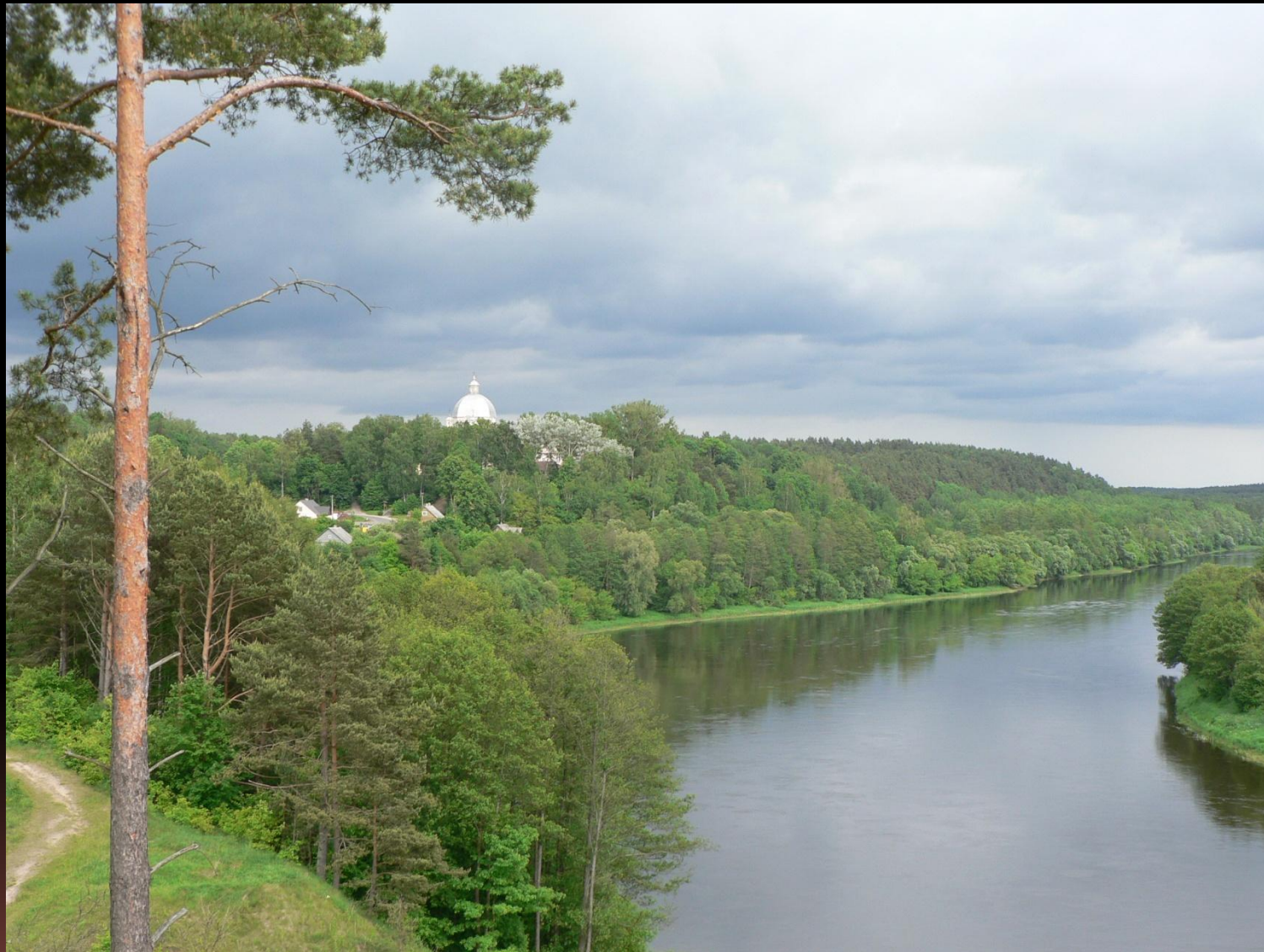
Вид на Неман в районе литовского местечка Лишкява