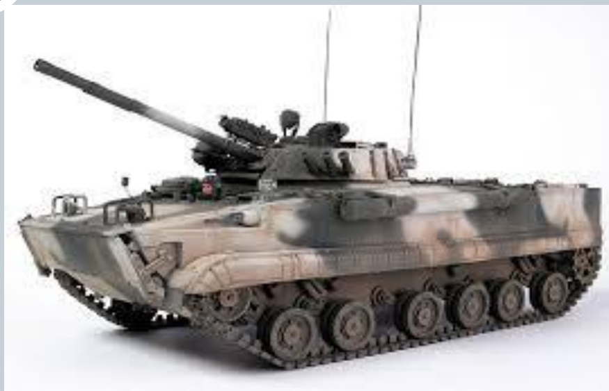
Боевая машина пехоты БМП-3