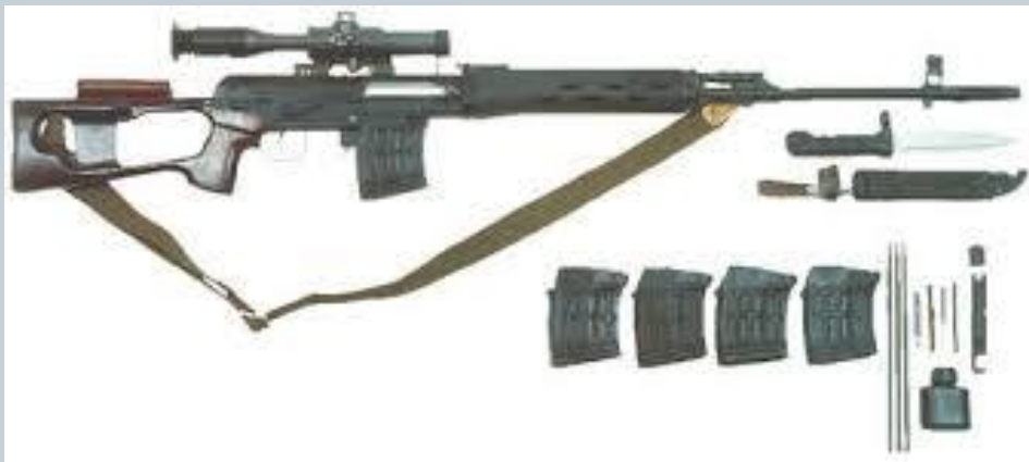
7,62-мм снайперская винтовка Драгунова СВД