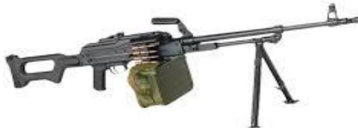
7,62-мм модернизированный пулемет Калашникова ПКМ