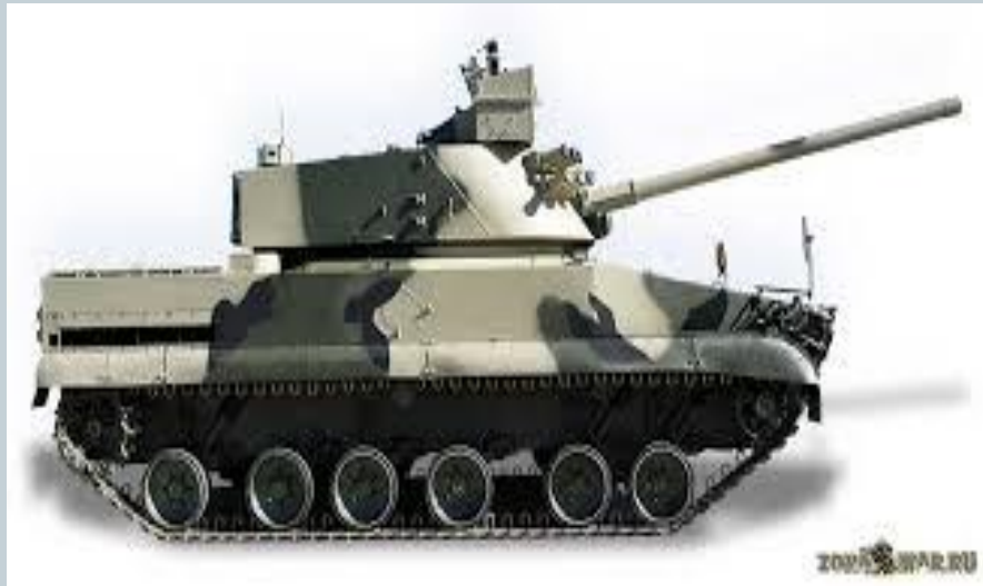
120-ММ автоматизированное самоходное орудие «Вена»