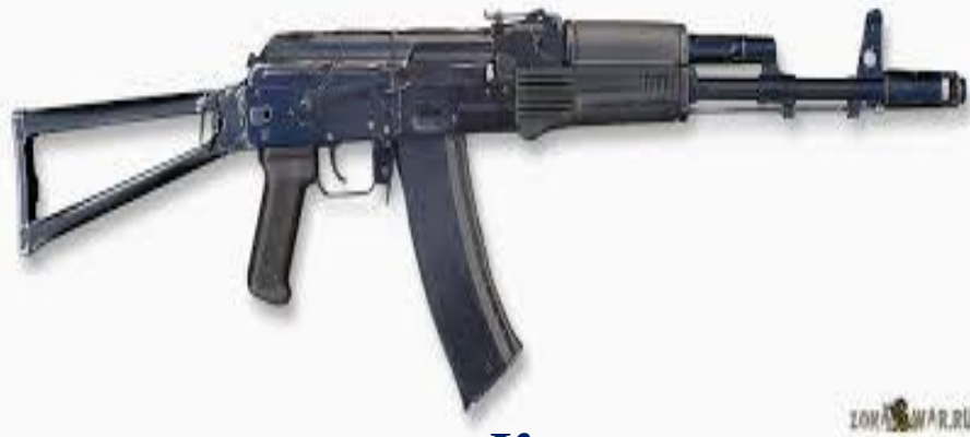
5,45-мм автомат Калашникова АК74М