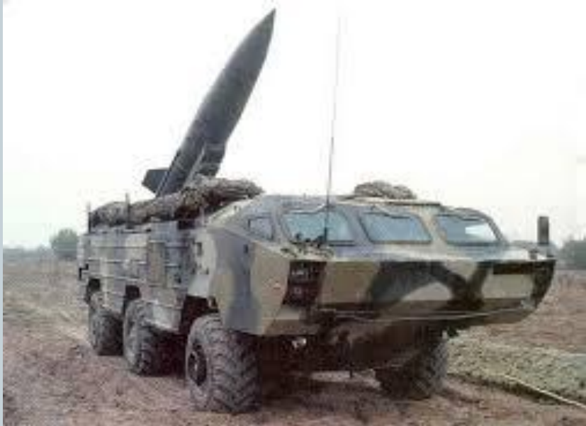
Тактический ракетный комплекс «Точка-У»