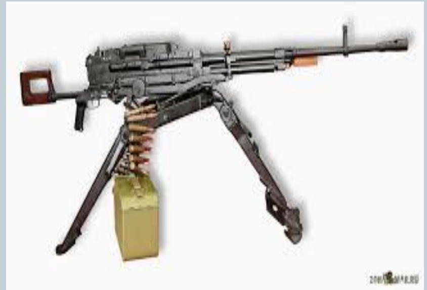
12,7-мм пулемет НСВ-12,7