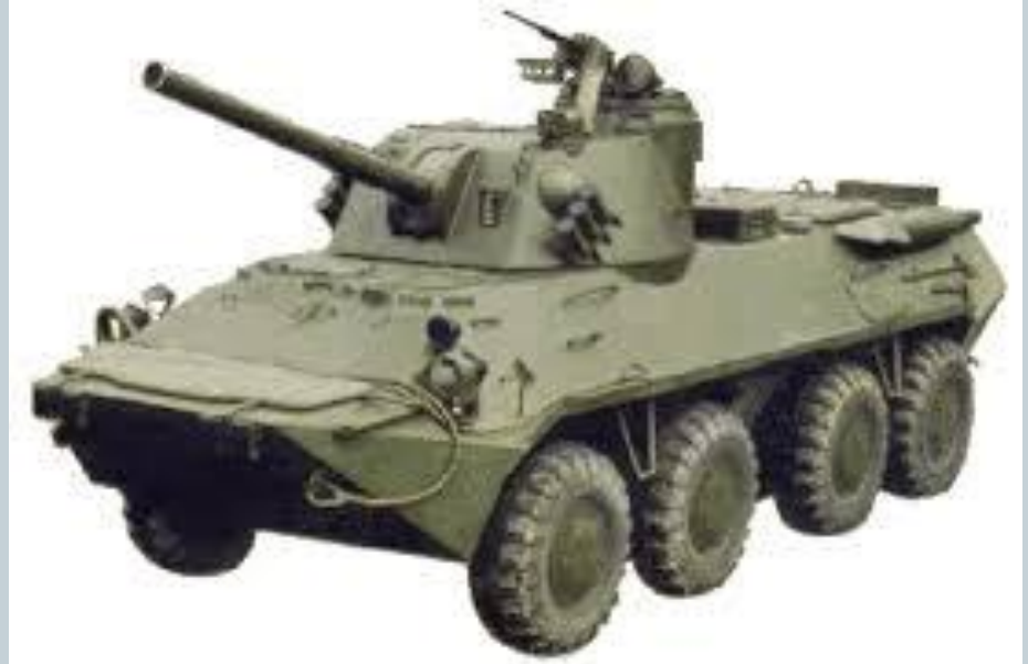
120-мм самоходное орудие «Нона-СВК»