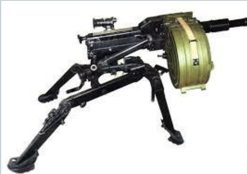
30-мм автоматический станковый гранатомет АГС-17 «Пламя»