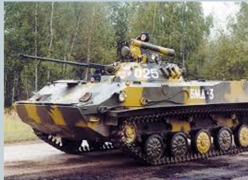
Боевая машина десанта БМД-3