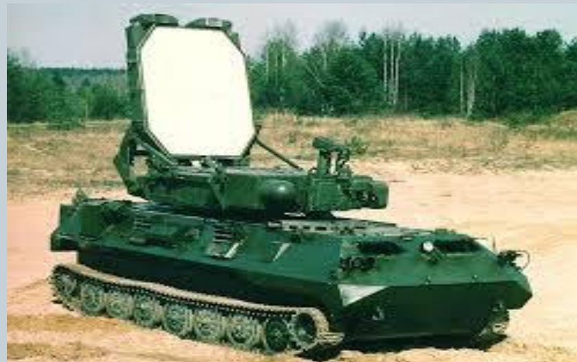
Радиолокационный комплекс «Зоопарк-1»