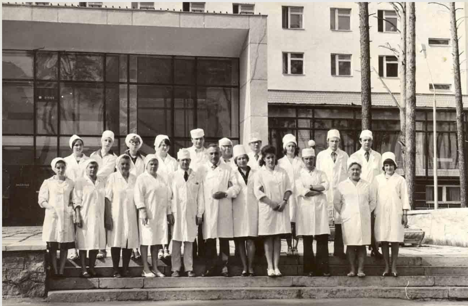
Коллектив кафедры хирургической стоматологии, 1980г.