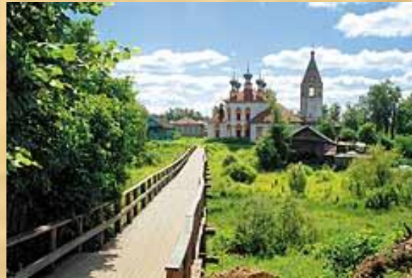
Почти центр города...

Ю.Манн, литературовед: «Сила «Ревизора» в том, что это особый город. Все нормы общежития, обращения людей друг к другу выглядят как повсеместные..Перед нами весь мир русской жизни, «вся Русь»