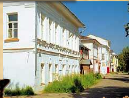
Улица со старыми домами, по которой могли гулять герои «Ревизора»