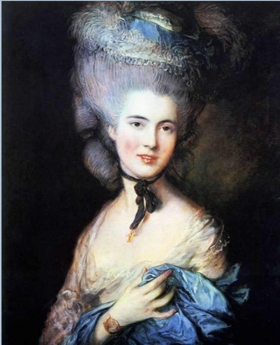
Томас Гейнсборо Портрет герцогини де Бофор Конец 1770-х