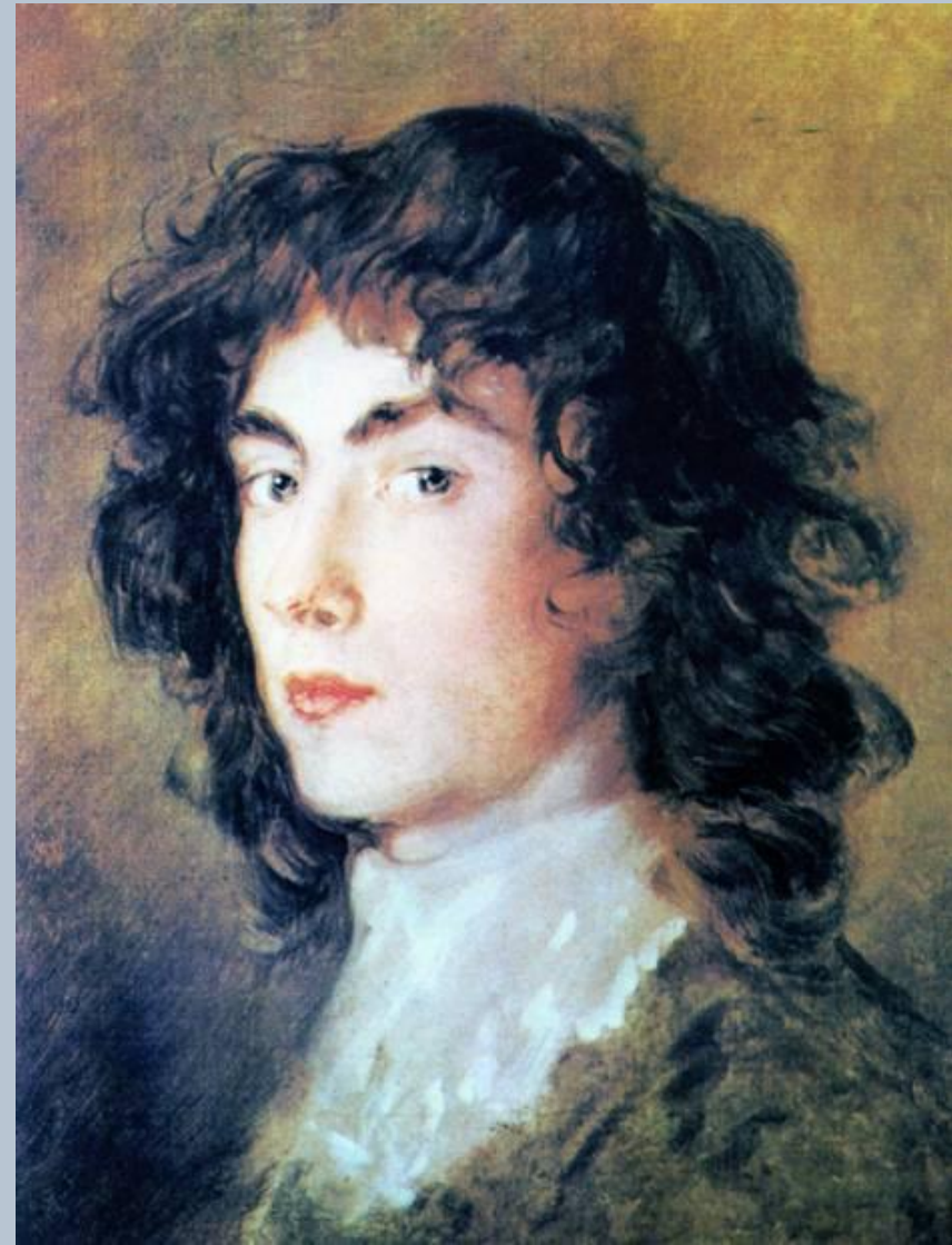
Томас Гейнсборо Портрет Гейнсборо-Дюпона Ок. 1770