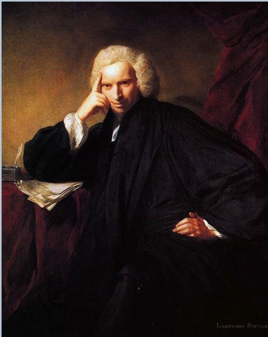
"Портрет писателя Стерна" 1760