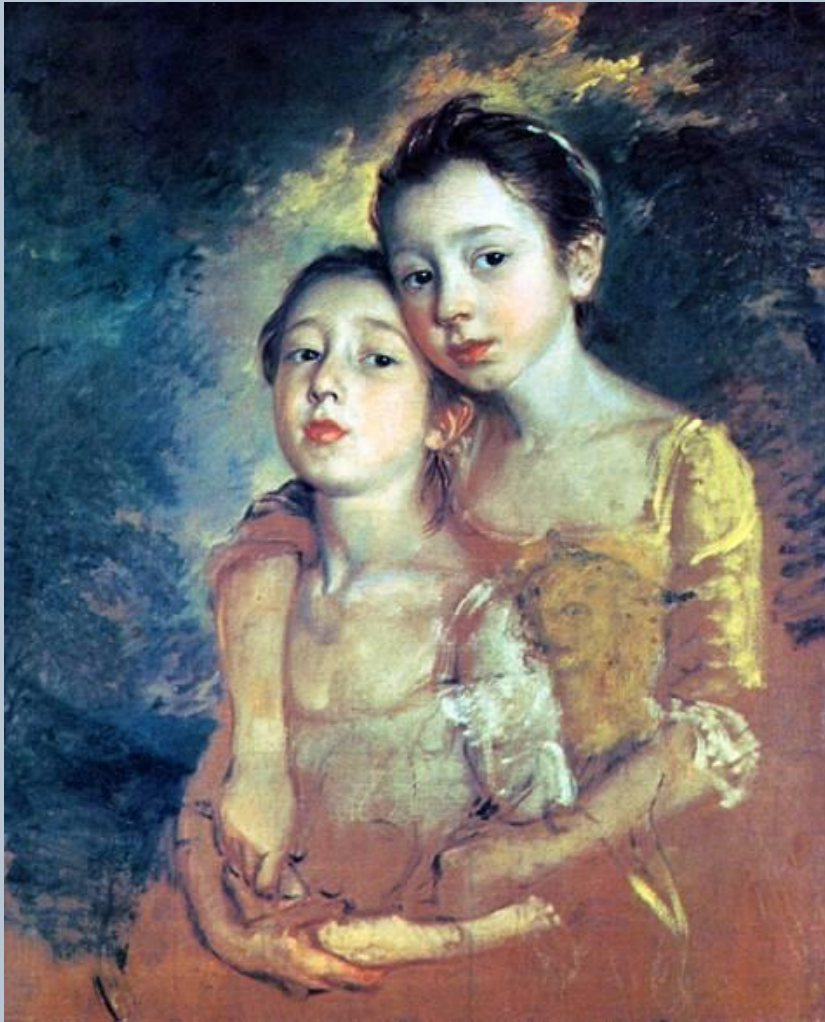
Томас Гейнсборо Неоконченный портрет дочерей художника Ок. 1759