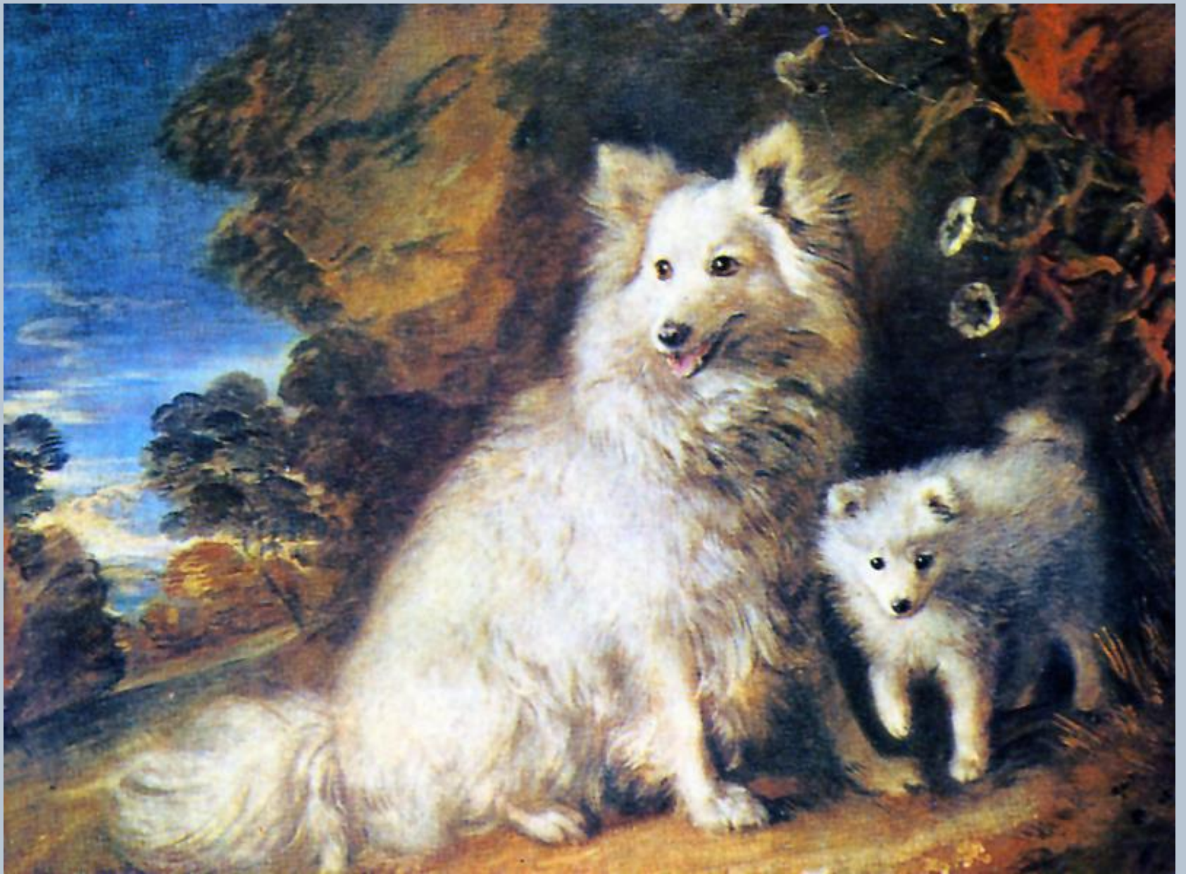
Томас Гейнсборо Бич и щенок. Ок. 1777