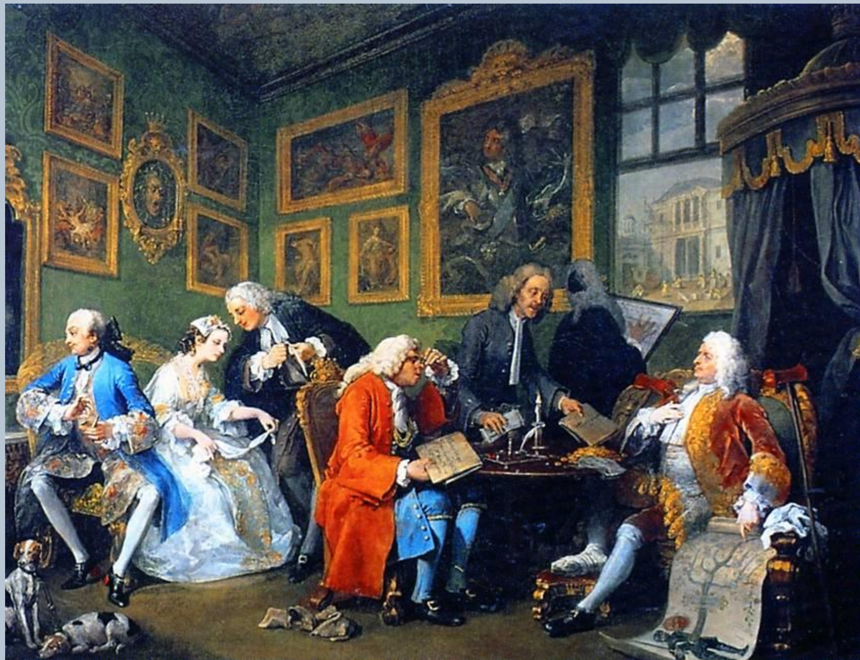
«Модный брак», картина 1 – «Брачный контракт»