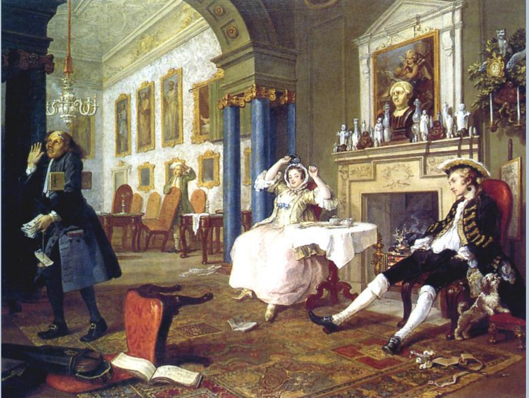
«Модный брак», картина 2 – «Тет-а-тет»