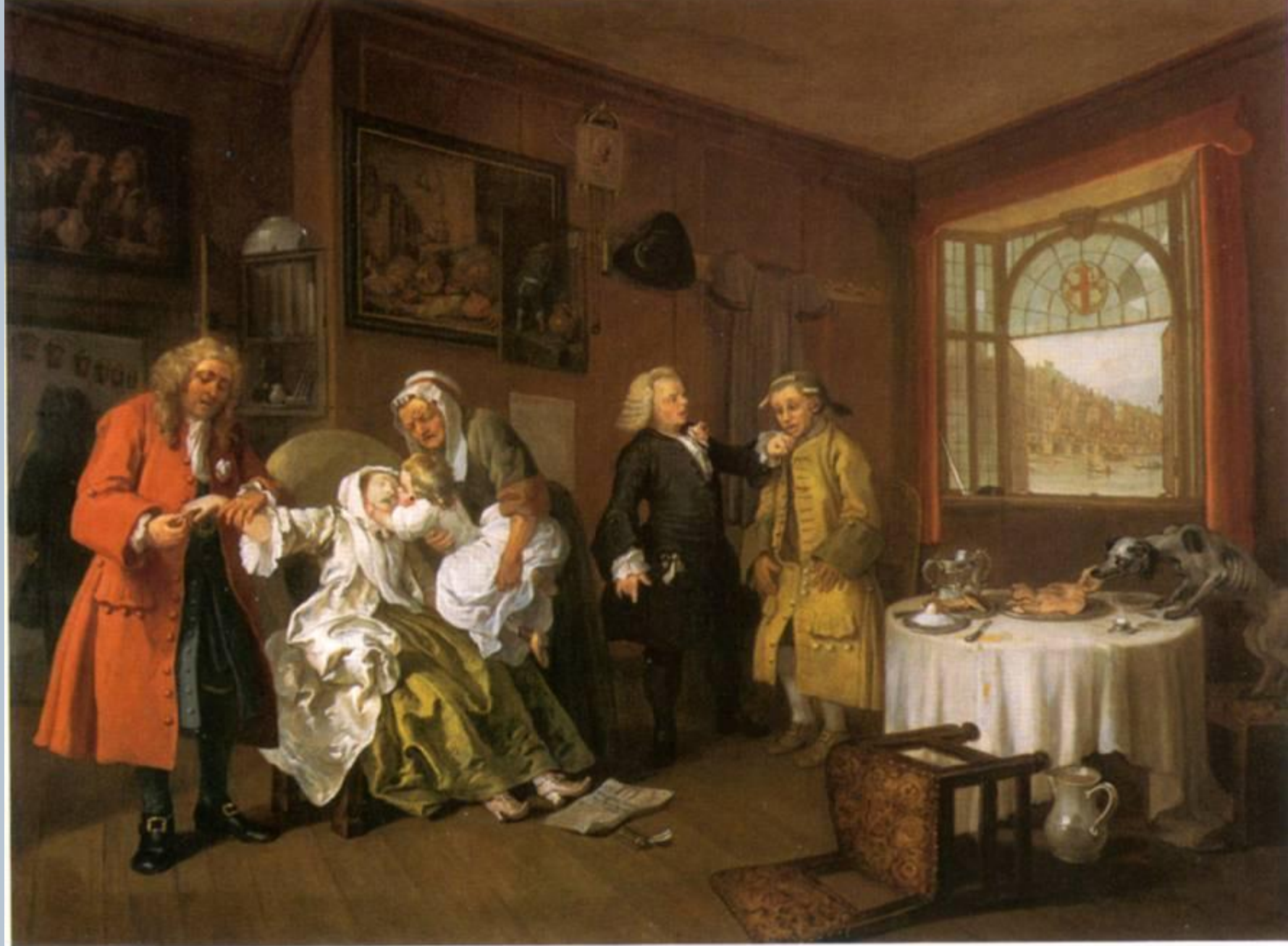
«Модный брак», картина 6 – «Смерть леди»