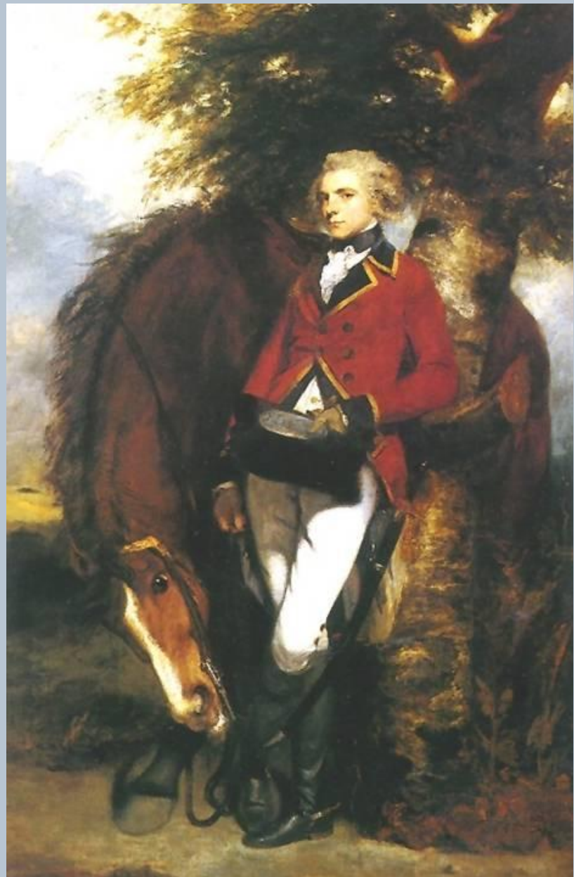
Джошуа Рейнольдс Портрет полковника гренадеров Джорджа К. Кроуссмейкера 1782