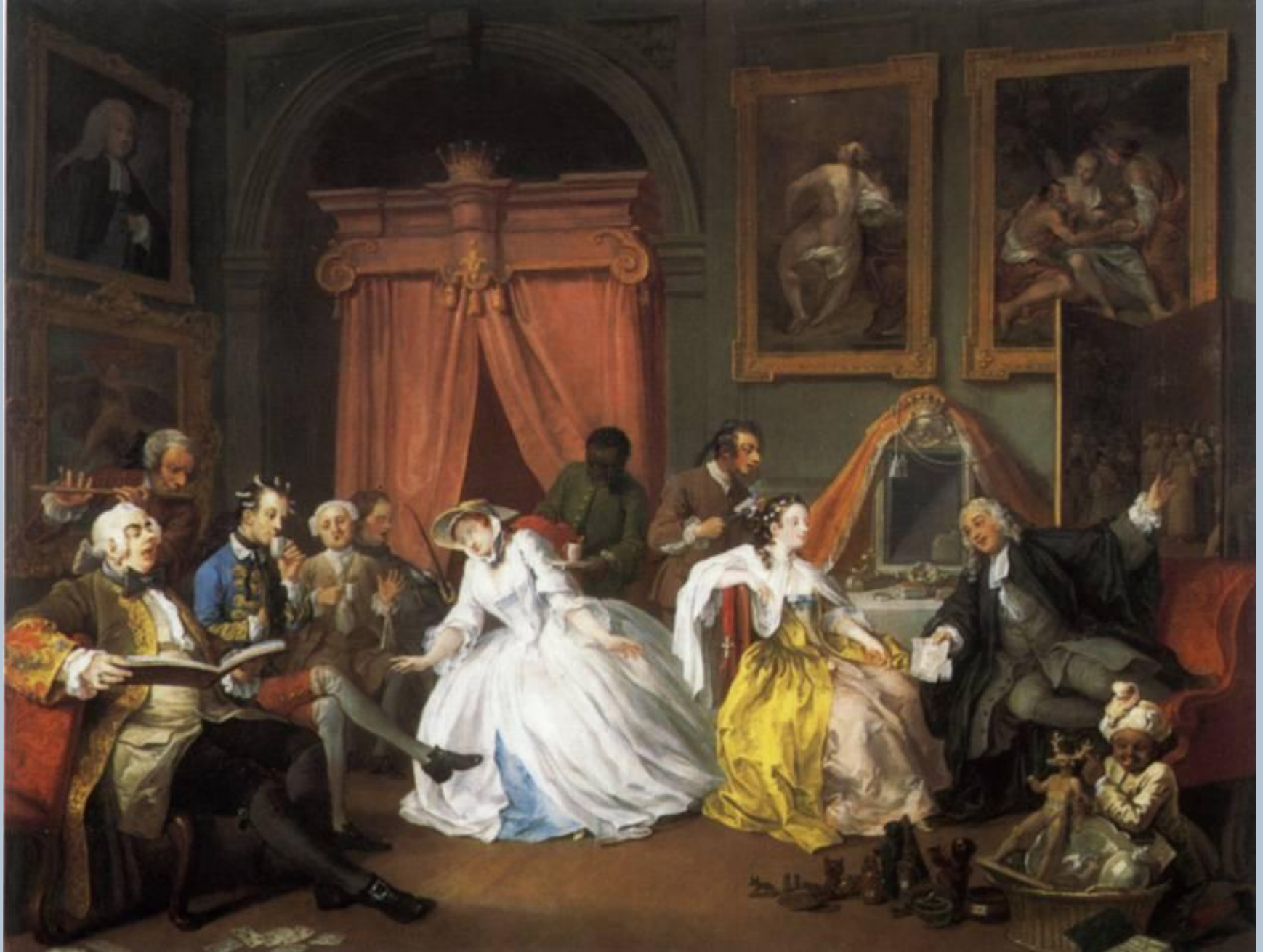
«Модный брак», картина 4 – «Туалет»