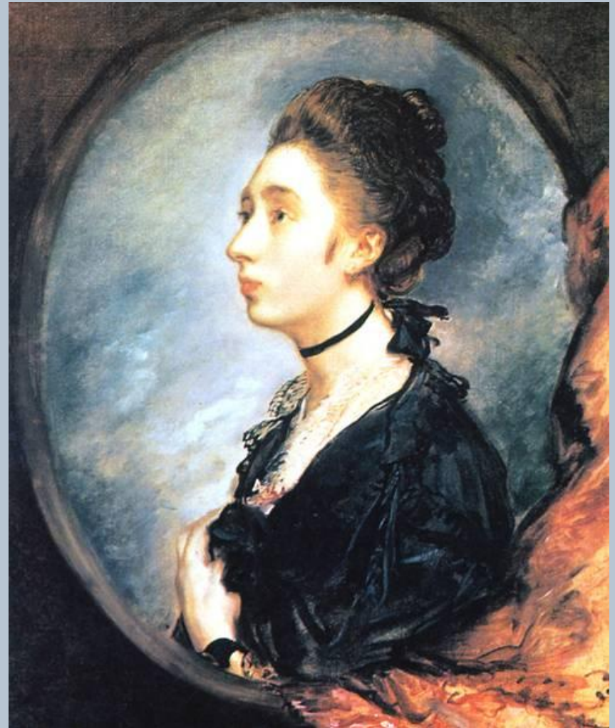
Томас Гейнсборо Портрет дочери Маргарэт Ок. 1770