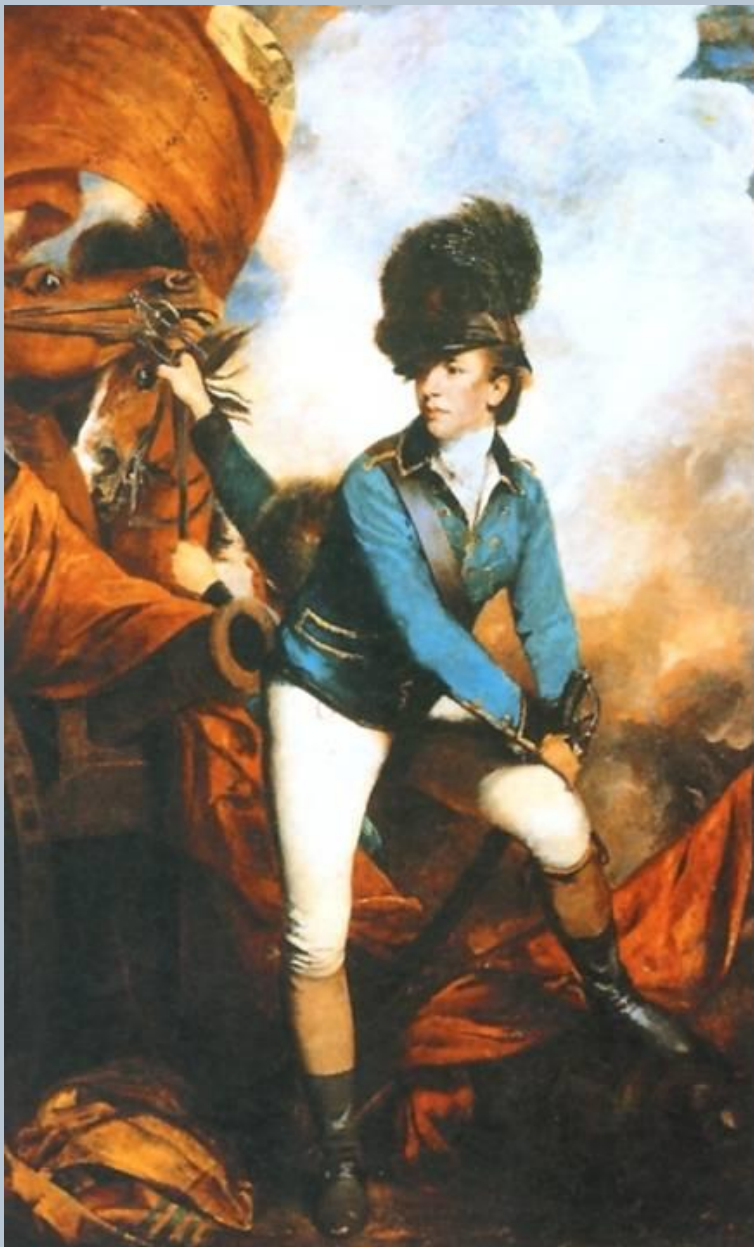
Джошуа Рейнольдс. Портрет полковника Бэнестра Торлтона 1761