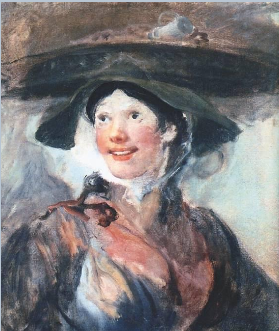
Хогард «Продавщица креветок» 1760