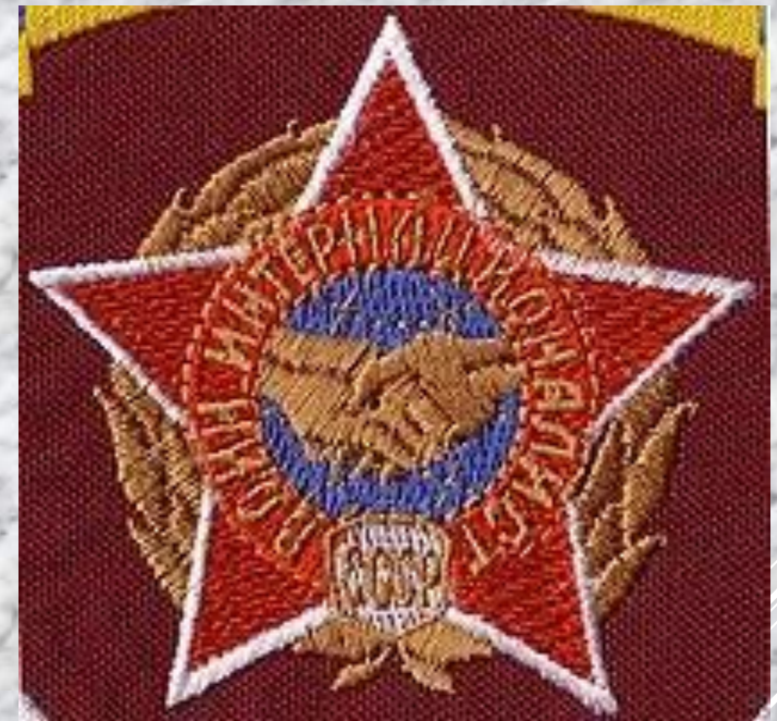
Знак «Воин-интернационалист СССР»

В соответствии с приложением Федерального закона от 12.01.1995 № 5-ФЗ «О ветеранах» советские и российские военнослужащие в период с 1936 по 2008 годы участвовали в 47 зарубежных конфликтах на территории 22 стран (не считая Великой Отечественной войны, а также боевых действий, ведшихся исключительно или преимущественно на территории РСФСР, СССР, России).