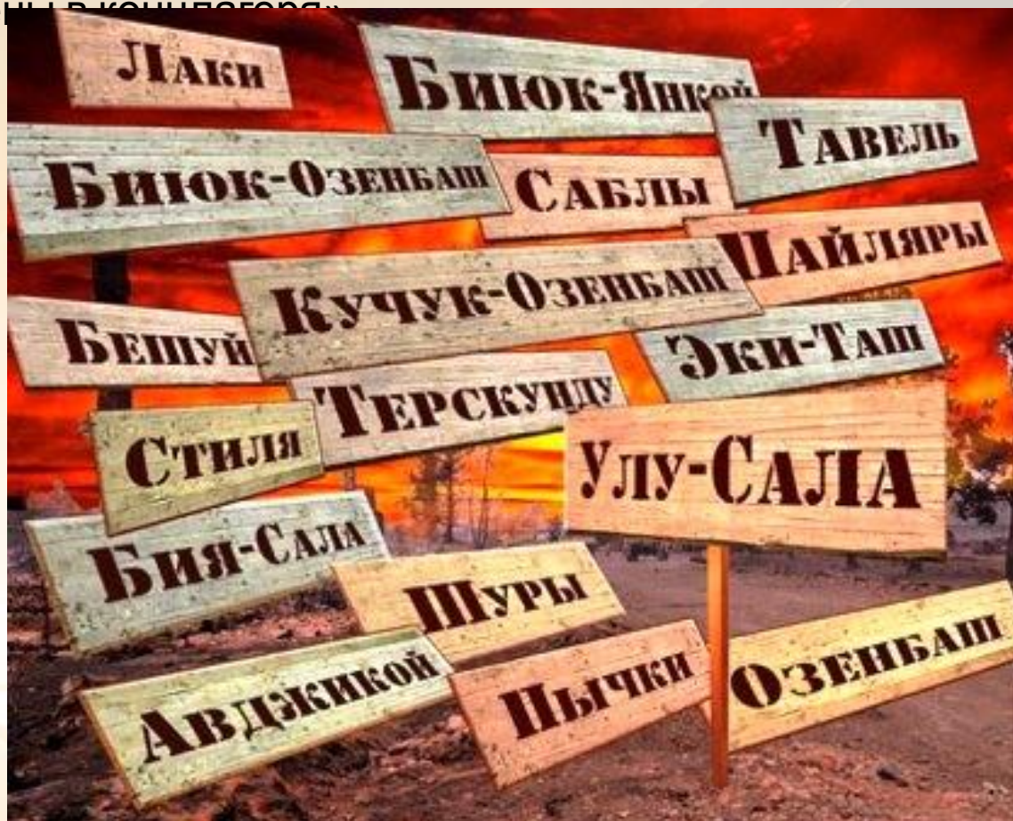
сожженные крымские деревни