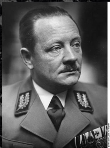
Рейхскомиссар Украины Эрих Кох

Полновластным правителем этих оккупированных территорий стал видный функционер нацистской партии ,палач - Эрих Кох. Он имел резиденцию в городе Ровно