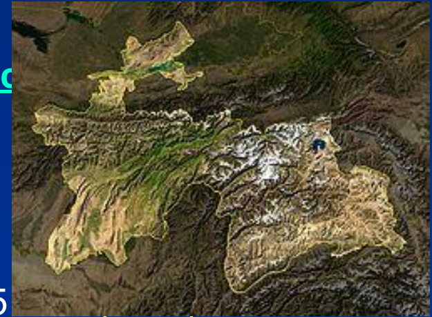
Таджикистана со спутника