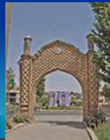
Арка в Истаравшане

Таджикиста́н ( тадж. Тоҷикистон), официально Респуб́лика Таджикиста́н ( тадж. Ҷумҳурии Тоҷикистон ) — государство государство в Центральной Азии , бывшая Таджикская Советская Социалистическая Республика бывшая Таджикская Советская Социалистическая Республика в составе СССР .