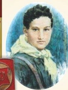
КОСМОДЕМЬЯНСКАЯ Зоя Анатольевна (1923–1941)

Военный лётчик, младший лейтенант, заместитель командира эскадрильи. Одним из первых в СССР совершил ночной воздушный таран немецкого самолёта-бомбардировщика.