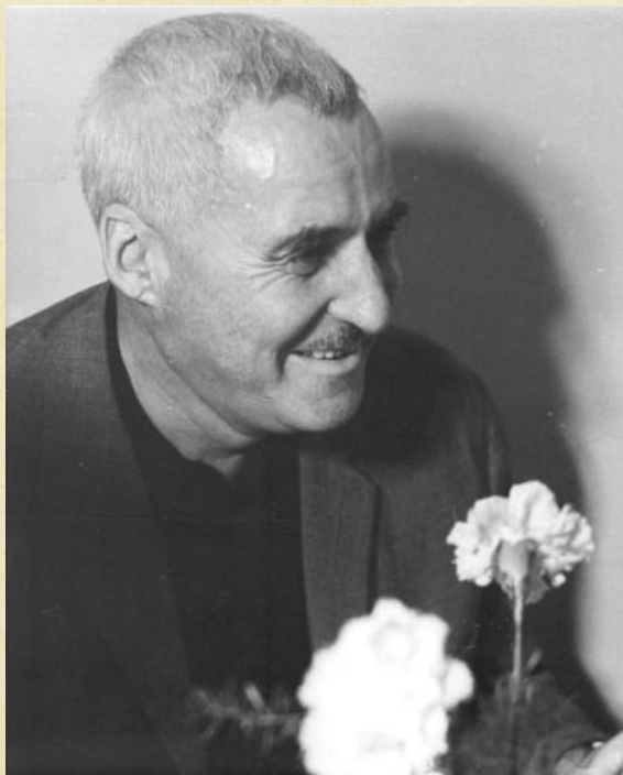
Константин Михайлович Симонов (1915—1979 гг.)