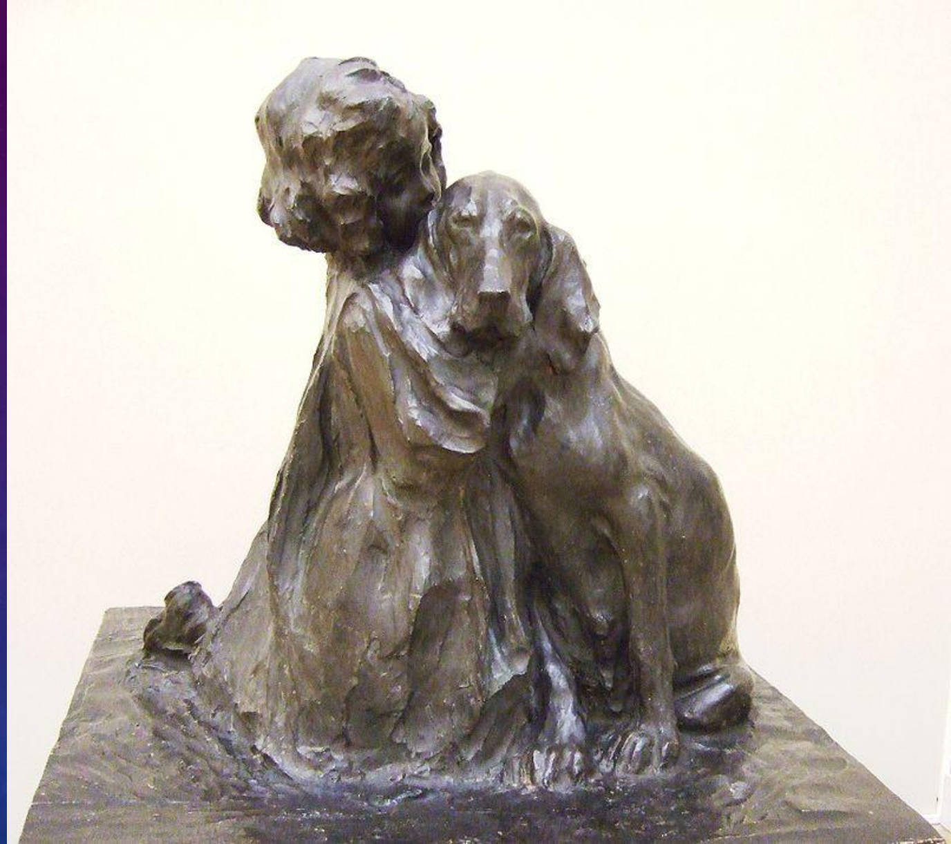
ДРУЗЬЯ, 1901 ГОД П. ТРУБЕЦКОЙ