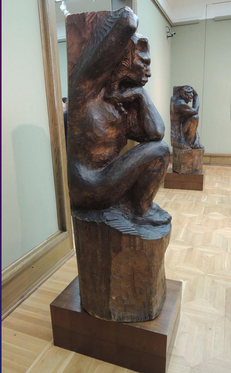
КАРИАТИДЫ, 1911 А. ГОЛУБКИНА