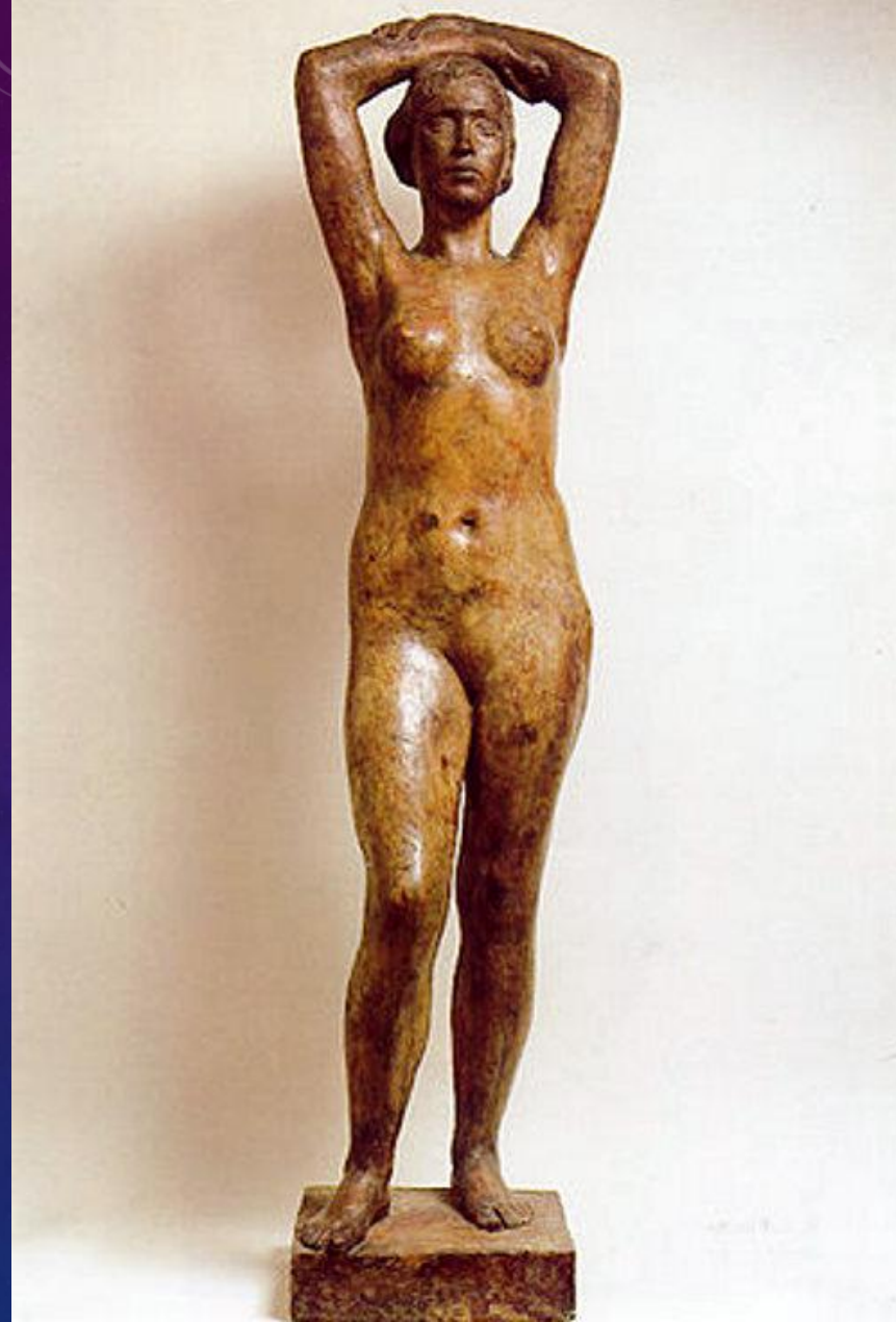
ЖЕНСКАЯ ФИГУРА А. МАТВЕЕВ