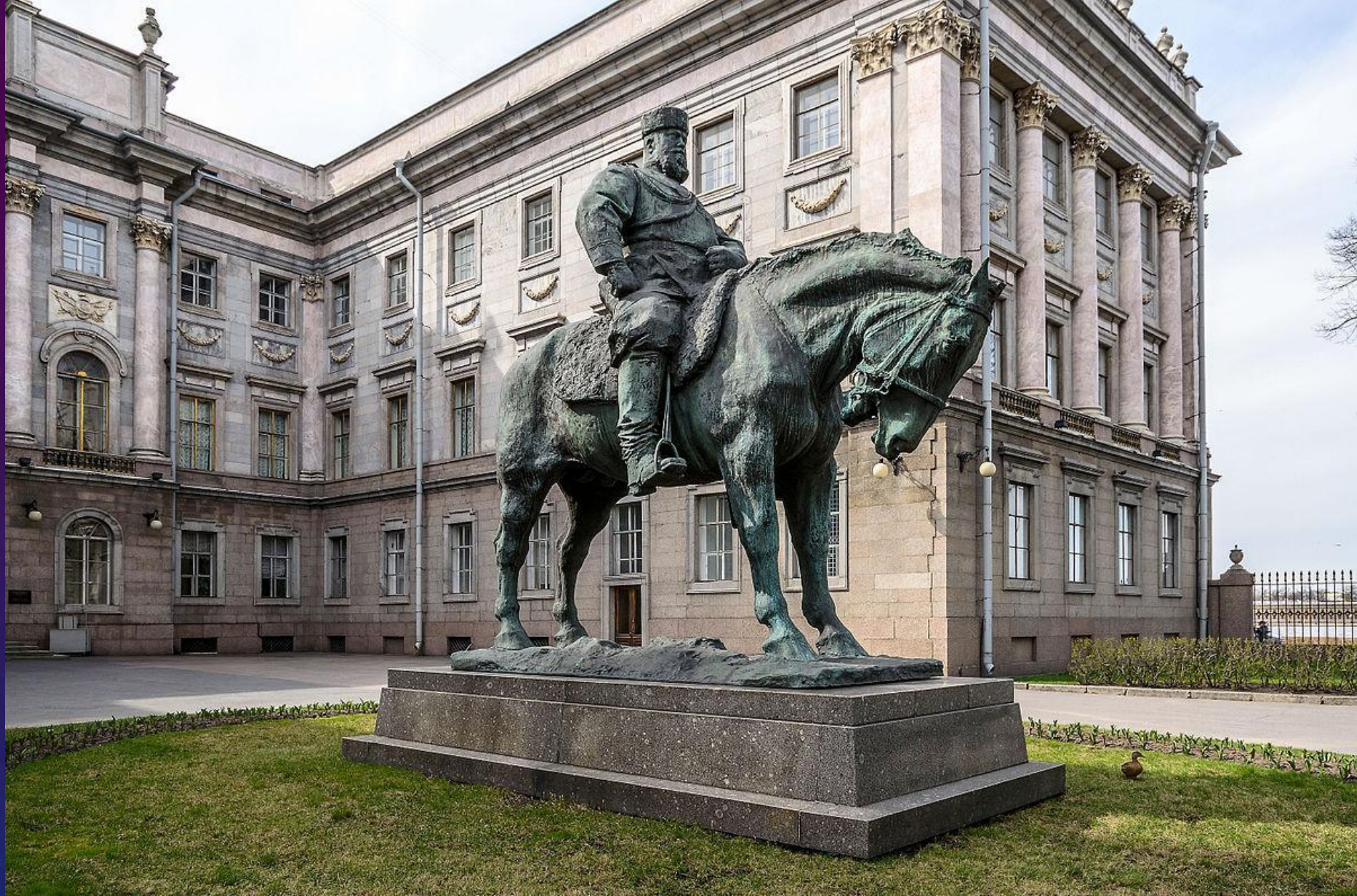
Памятник Александру III в Санкт-Петербурге