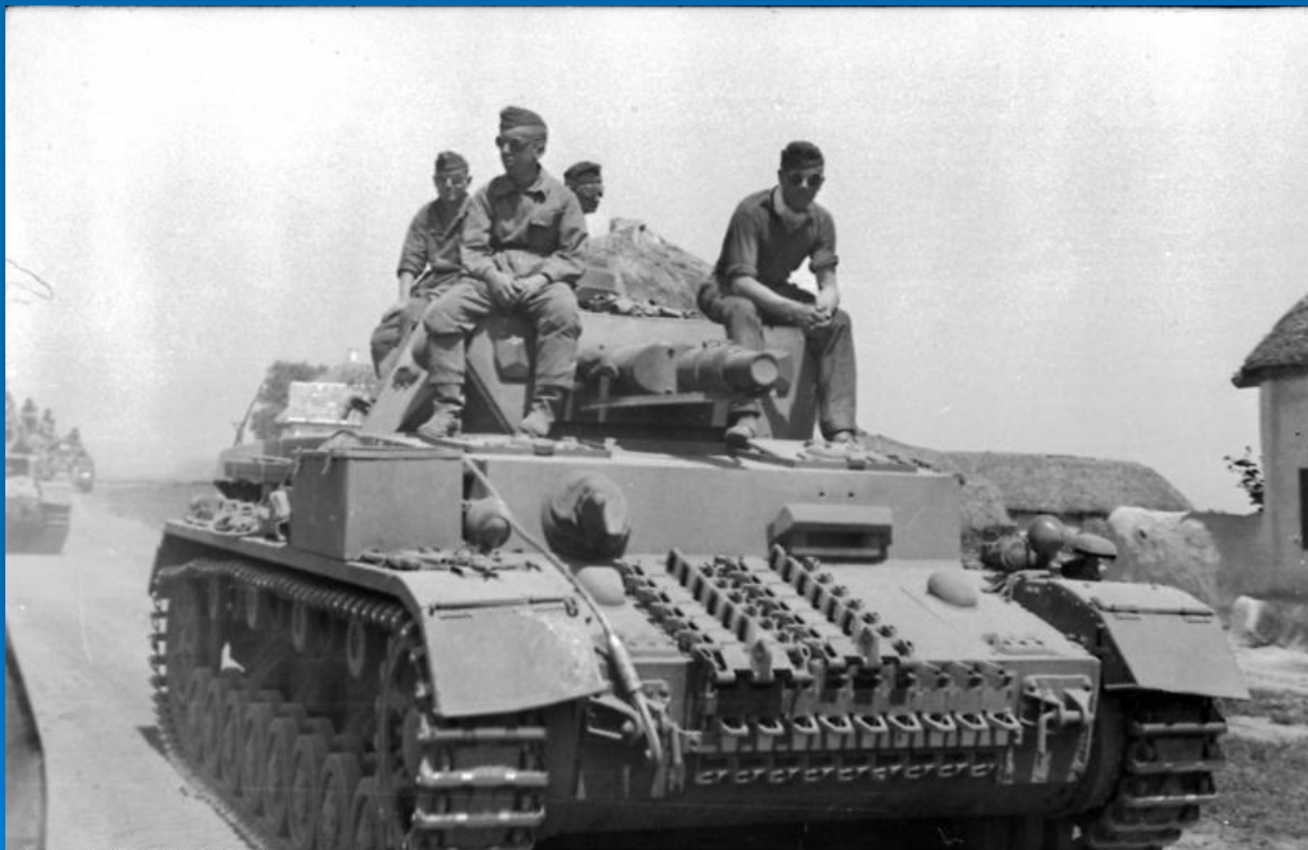
Juni 1942