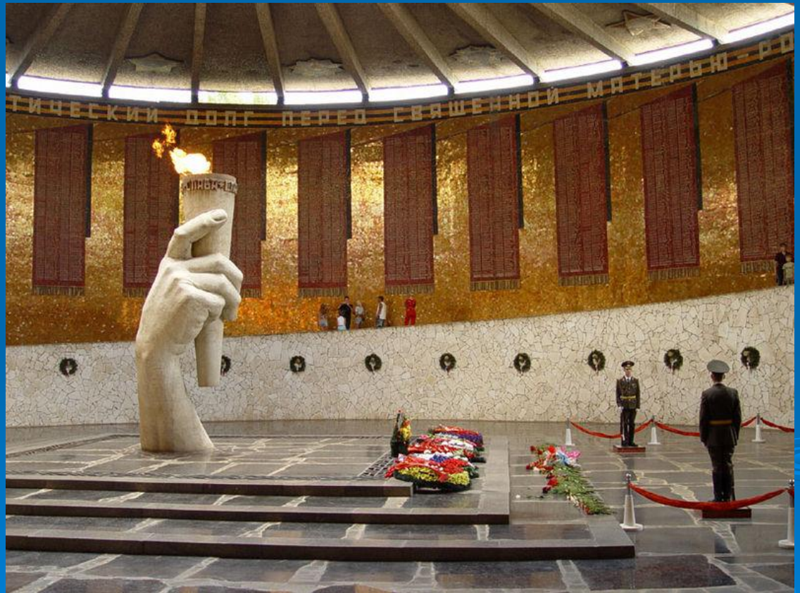
На фото: Вечный огонь

Мамáев кургáн расположен в Центральном районе города Волгограда, где во время Сталинградской битвы происходили ожесточённые бои (особенно в сентябре 1942 года и январе 1943) продолжительность ю 200 дней.