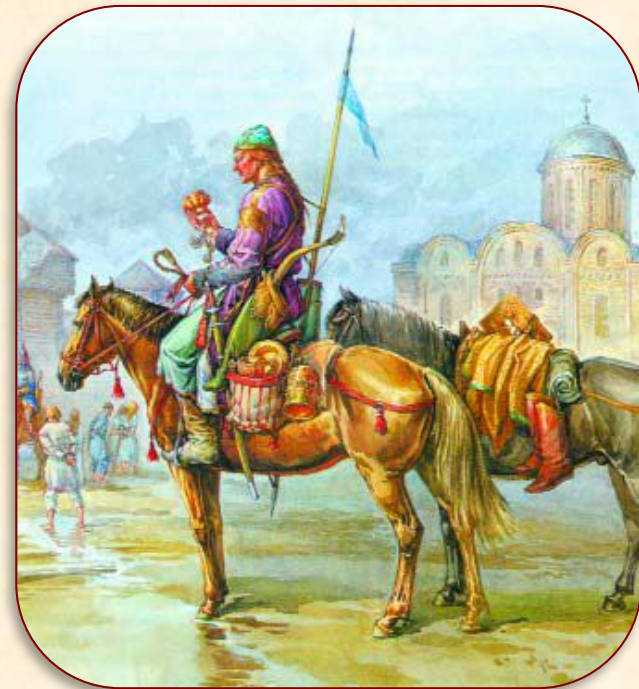
Половцы в захваченном русском городе