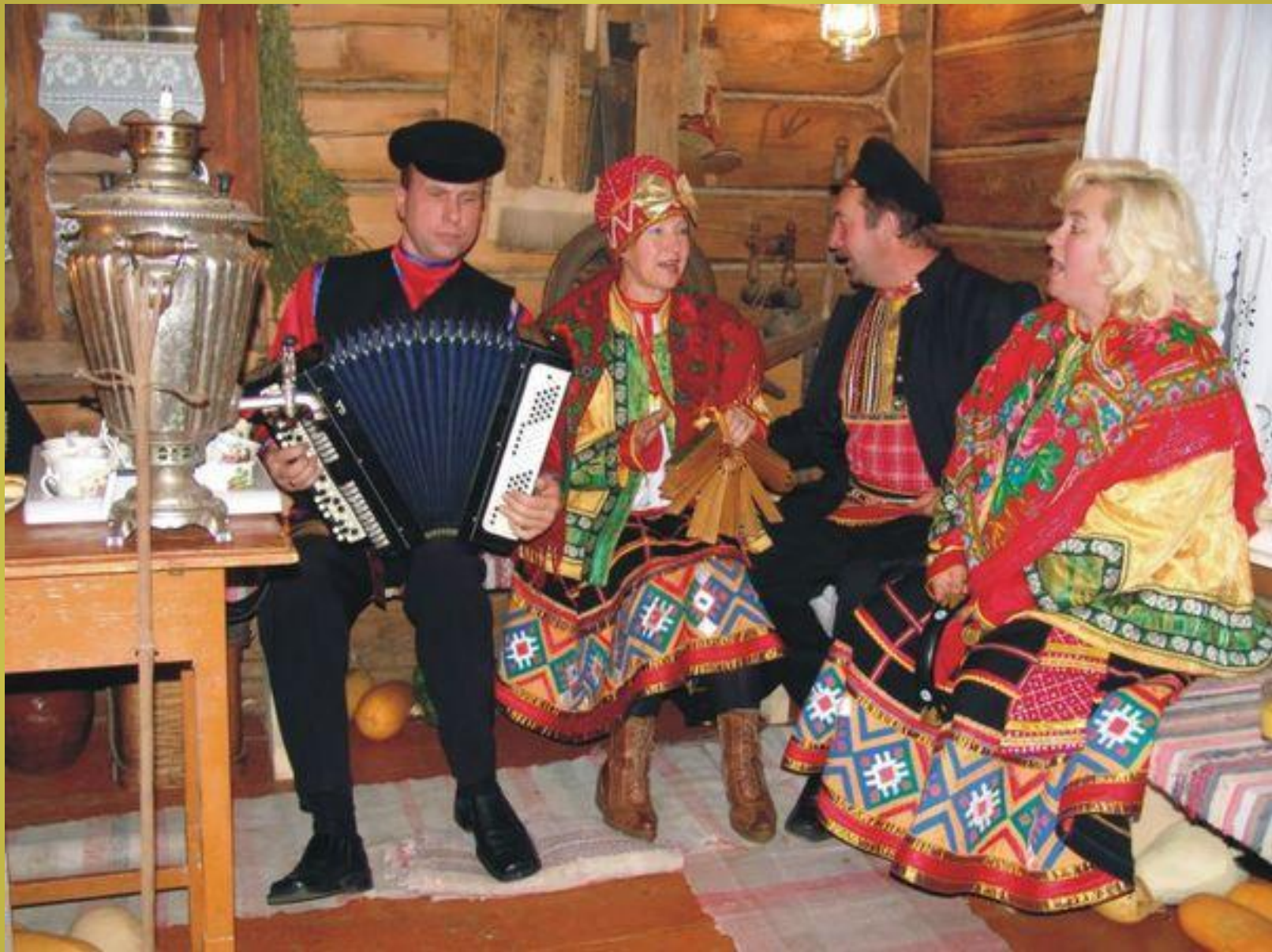
Суббота – посиделки.