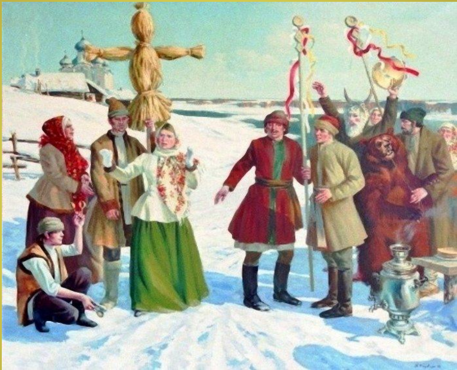
Понедельник – встреча Масленицы.