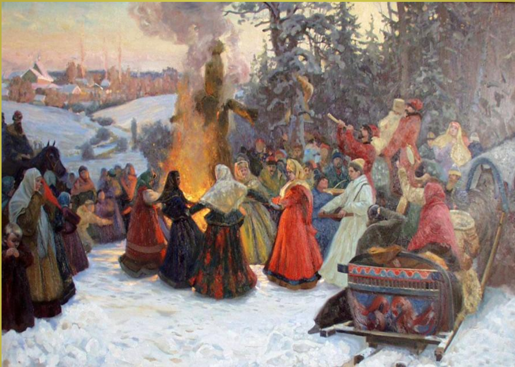
Воскресенье – проводы Масленицы.