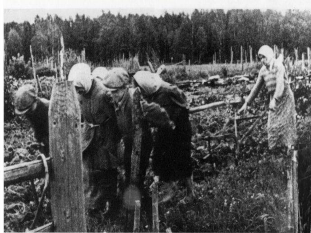
184 Пахота без машин и тягловых животных (без даты). Из-за военной разрухи и отсутствия лошадей плуг и борону приходилось тянуть людям. Здоровых мужчин призывного возраста, которые могли бы выполнять такие работы, не было.