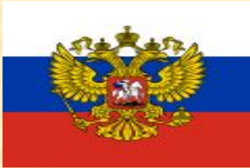
Штандарт (флаг) президента