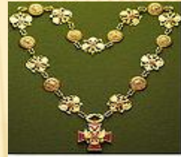
Знак Президента РФ