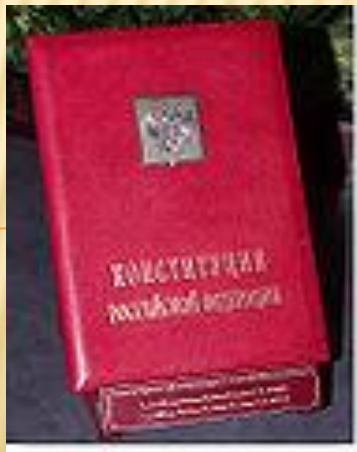
Специально изготовленный экземпляр Конституции РФ