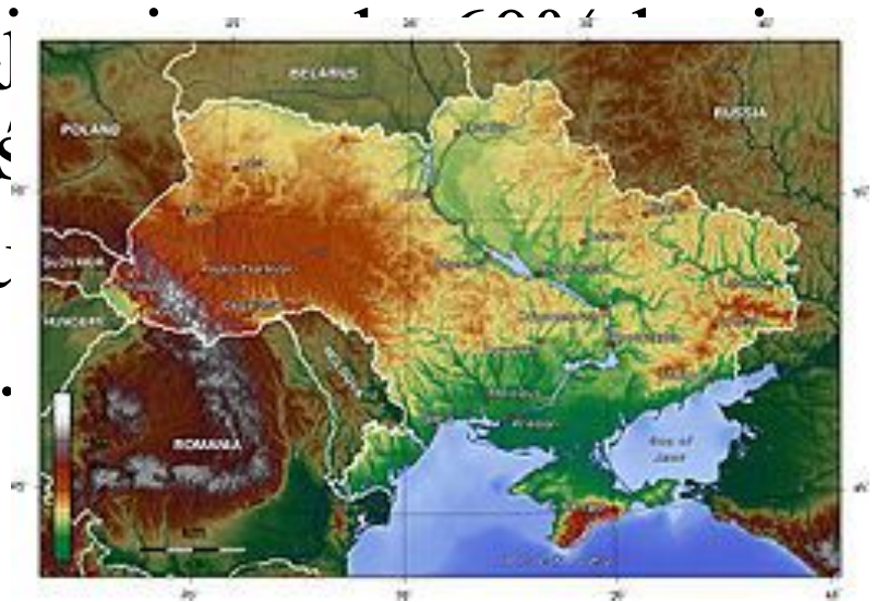
Mapa hipsometryczna Ukrainy