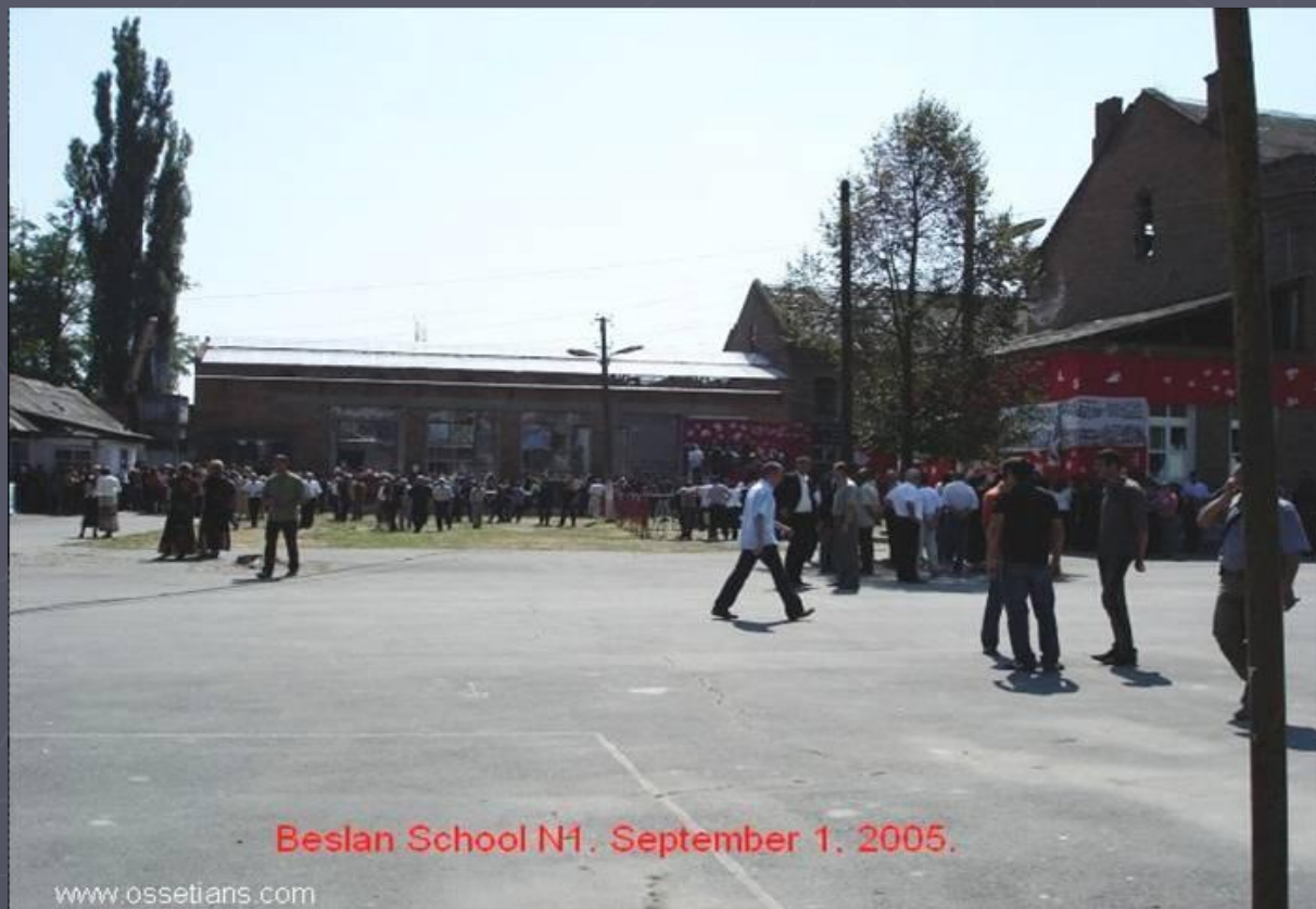
Beslan School N1. September 1, 2005.

Теракт в Беслане был спланирован тщательнейшим образом. Целью террористов был вывод российских войск из Чеченской республики и признание Чечни независимым государством и выпустить боевиков, арестованных за нападение на Ингушетию.