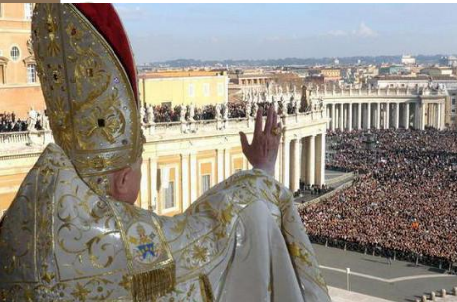
Ватикан. Папа Римский