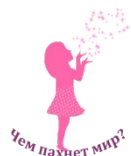
Фото отчет о проведении игровых мастер классов