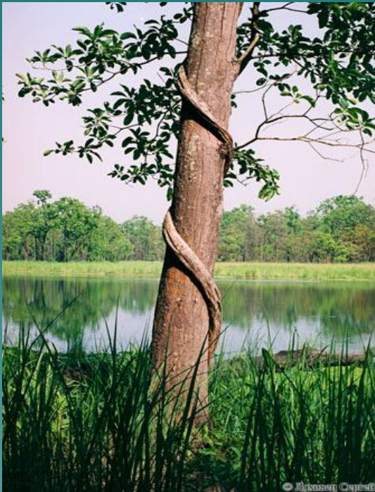
Лиана на стволе дерева.

Вид-квартирант обитает на другом виде или в его жилище, не принося виду-хозяину ни вреда, ни пользы.