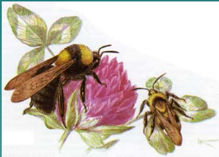
Шмель опыляет растение клевер.

- длительное взаимнополезное сожительство двух организмов разных видов.