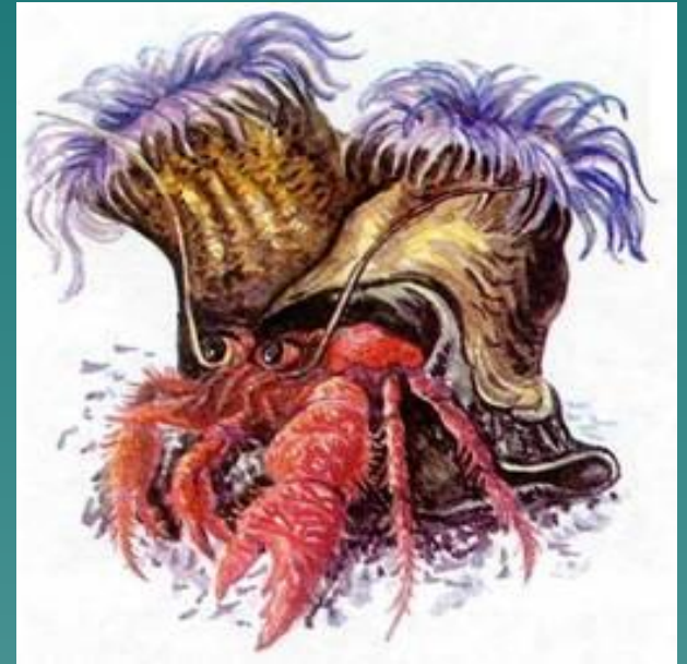
Рак-отшельник и актиния.