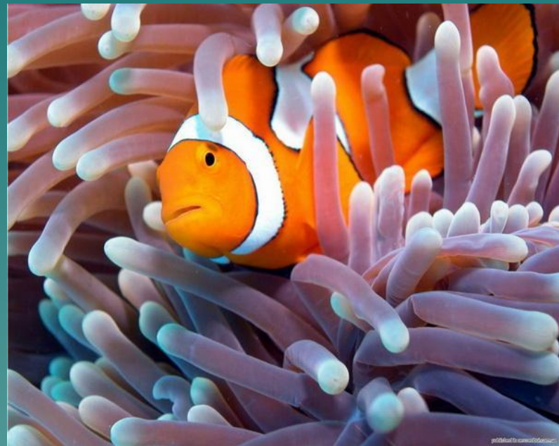
Рыба клоун прячется между щупалец актиний.