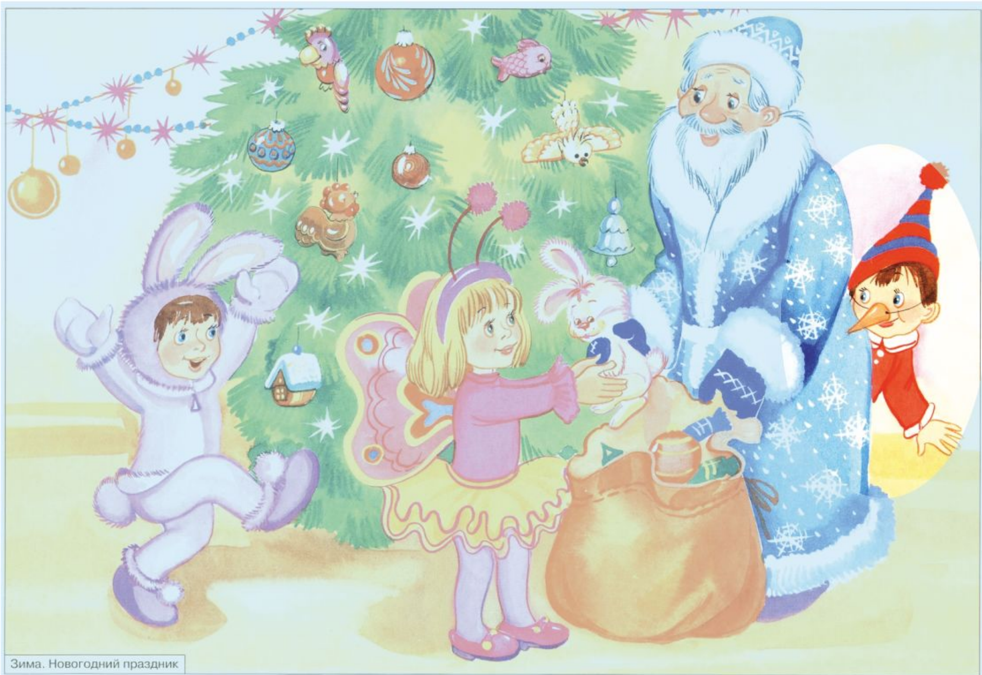
Зима. Новогодний праздник

Кто выглядывает из-за спины Деда Мороза? Как ты думаешь, какую роль исполняет медведик?