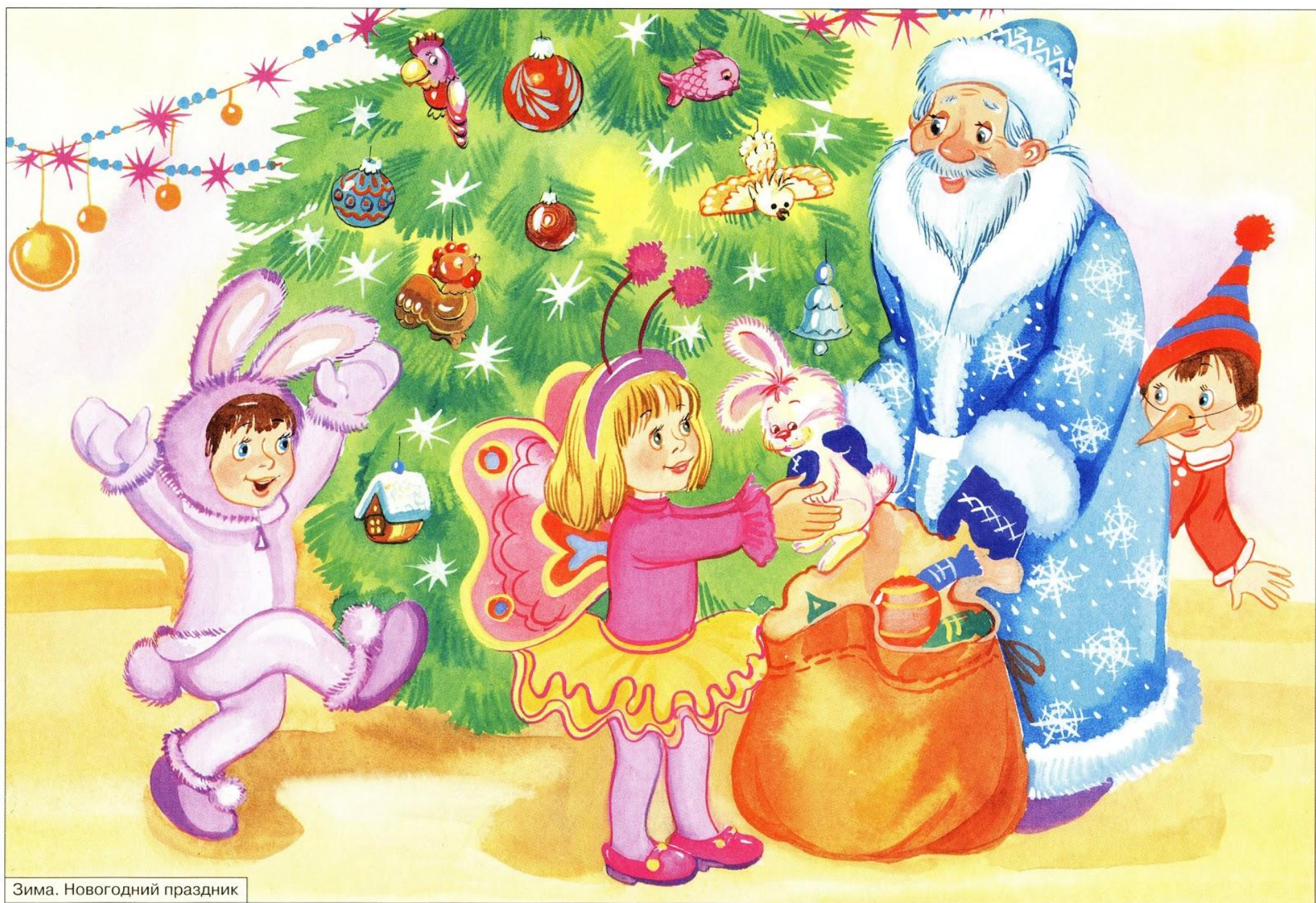
Зима. Новогодний праздник

Как ты думаешь, какое настроение у детей? Почему?