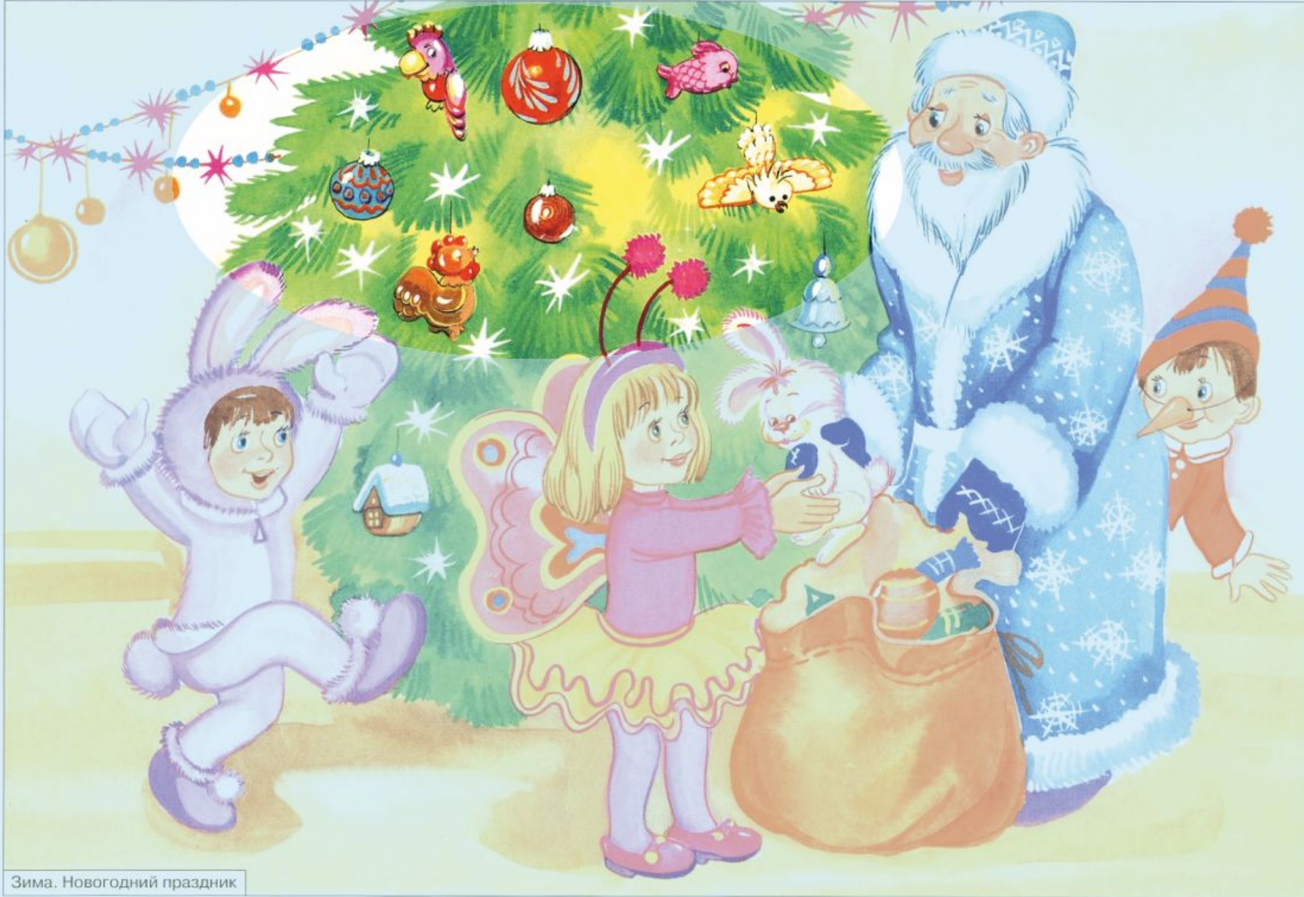
Зима. Новогодний праздник

Опиши ёлку и игрушки которыми она украшена.